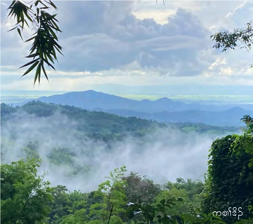
ကစားခိုက်

ကစားခိုက်အံ့မ့ကစားလအမံ့ဟူသည့်ဖျါ ဇီးမ့တံဆဲးတံလအရုဒိန်အလီတတီလအညီပုထူလံဖိသုတဖန်အ ကိန်န့လီ. ကစားခိုက်အံ့အိန်သုလီအသးဖဲပလထံးကဝီ, ထီတထုန်ကီဆန်, တီအူကီရုန်အပူန့လီ. ဒ်မိပံဖဲသု တဖန်အတံတဲယုဒးသုညါဖိလံသုတဖန်အိန်ဝဲအသိး. ကစားခိုက်အံ့မ့တံဒုန်တံထူအလီအကျဲတတီ လအဘန်တံ သုညါစုကီးအီလအမ့ဖဲနီန့န့, ဇီးတံလအလီဆီဘန်ထွဲဒီးကစားခိုက်တခိမ့ဝဲ အကွဲအဂီတံအိန်ဖျါလအလီကန်ဒ်သိး ပုကူပုကညီတဂအသိး ဖဲပမ့ကွဲထီန်ဖဲပအိန်တပူဂုတပူဂုအဆာကတီန့လီ. ဒ်န့အသိး, တံသုတံပိုလအလီ သးစဲဘန်ထွဲဒီးကစားခိုက်အံ့ မိပံစံင်ယဲဝဲဒုန်လအ ပုတဂလံလံမ့ဟးဖျိုးဟးကမန်ကျဲဖဲကစားခိုက်အလီဒီး မ့ထံင်ဘန် ဖုးထံကျိ, ထံပူ, ဇီးလံကအိတံလီတံကျဲသုတဖန်နအဲဒီးလဲဒုးနဲကွဲပုအဂုအဂဘန်ဆန် တံလီတံကျဲဒ်အံ့သု တဖန်နတထံင်န့အီလအဘန်. တံသုတံပိုအလီအကျဲဒ်အံ့သုတဖန် တံဒုးထံင်ဒုထဲပုလအတံအဲဒီးဒုးထံင်အီသု တဖန်ဇီးန့လီ. ဒ်လီကဝီပုထူလံဖိသုတဖန်အတံပံဖျါအဖိခိန်အိန်ဝဲအသိး, ကစားခိုက်အံ့ထူမိပုစုမိပုဟဲကွဲက ဒါကွဲတဘျီဘျီန့လီ. လအပုလီကဝီဖိသု တဖန်အဂီ, ကစားခိုက်အံ့ဟုန်အဝဲသုတံဘျး တံပိုင်အါမံ အကျဲတနီ ပန်ယုဒီးတံအိန် တံအိန်အမ့တံဖျိတံသု, တံဒီးတံလန်, ကသံသုဂံဂံဝဲ, ဟံင်ယီတံသုထီန်ဘျီ ထီန်ပီးလီ, ဇီးတံမံလံဆန်ဖိကီဖိလအတံ ဆဲးအိန်ခးအိန်အီသုသုတဖန်န့လီ. ကစား အခိခိန်အံ့ဟိန်ခိန်ညုထုန်အထူးအစီဂုဒိန် မးလအတံသုအိန်ဖျးအိန်အဂီဘန်ဆန်, မ့မ့ ဖဲကစားခိုက်အိန်ထံးတလီတနီန့န့ ဟိန် ခိန်ညုထုန်အထူးအစီတဂုလအတံသုတံ ဖျးအဂီဘန်. လအလီကဝီကညီပုထူလံဖိ သုတဖန်အဂီ မ့တံစီတံဆုံဒီးတံသုတံ ပိုအလီအကျဲတတီ လအတံကဘန်ယုးယီ ပံကဲ, ဟုန်လအဟုန်ကဝီ, ဟံပနီဒီးဒီသ ဒါကွဲအီတုလီတီလီန့လီ.