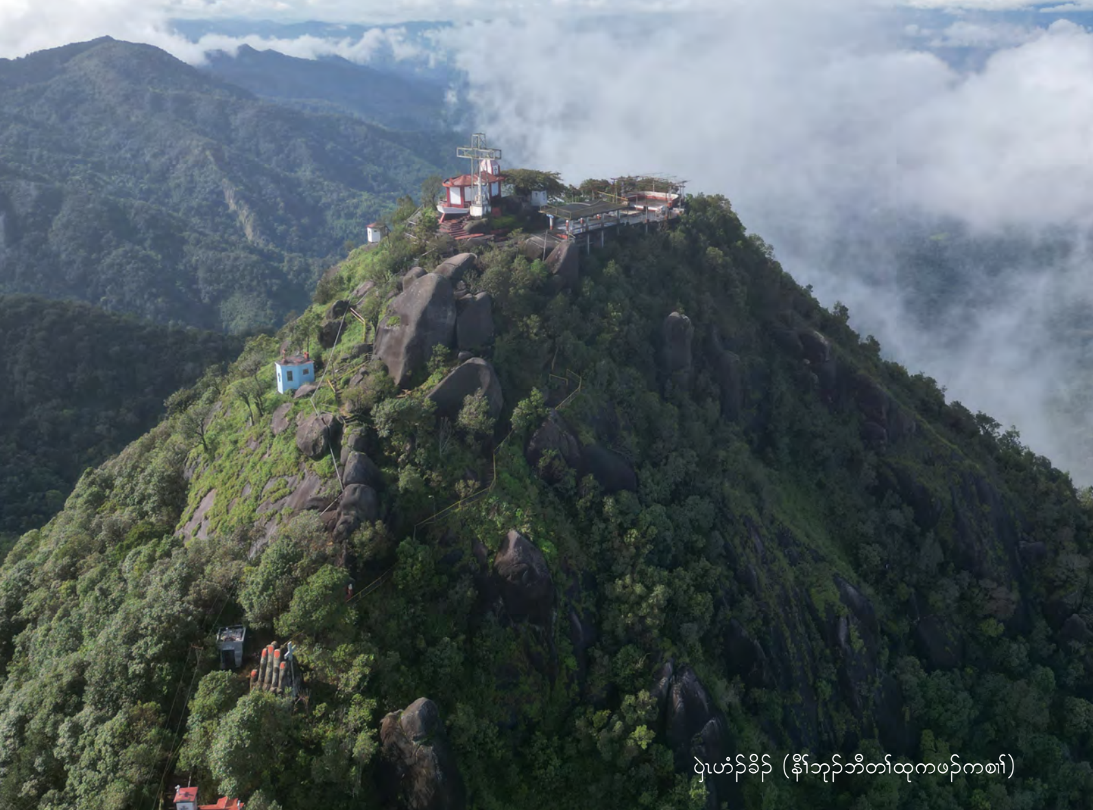
ပျူဟံဉ်ခိဉ် (နီၢ်ဘုဉ်ဘီတၢ်ထုကဖဉ်ကစၢ်)

ပျူထူလံဖိလဒါအအိန်ဆိးဖဲသီသံဉ်တီအူပျူထူလံဖိကရုာ်ပူသုဉ်တဖဉ် မ့ၢ်ပျူလဒါအဒီသအဒီးရဲဉ်သဲကတီၤက့ၤအဝဲ သုဉ်လုာ်လံာ်ထူသန့ဒီးတၢ်ဆဲးတၢ်လၢ ဒီးန့ဆၢဉ်တၢ်မူတတၢ်လၢပျဲခဲအံၤတစီၤ ယုဉ်ဒီးဖိလံၤကဟဲလၢခံတစီၤသုဉ်တဖဉ်အဂီၢ်န့ဉ် လီၤ. မ့ၢ်တၢ်မူအါကလုာ်အဟံဉ်အပီတၢ်အိဉ်ကဒုအလီၢ်အကျဲတတီၤအမဲဉ်ညါ ဟီဉ်ခိဉ်မဲဉ်ဖံးခိဉ်တၢ်လီၢ်တၢ်ကျဲလါဟ့ၣ်အံၤ ကဲထီဉ်တၢ်မၤစၢဖးဒိဉ်တခါလၢ တၢ်မၤလီၢ်ကဆုဉ်ဒီးမၤစၢလီၤကွံာ်တၢ်ကသုဉ်ကသံးတၢ်ဆိတလဲအဂီၢ်န့ဉ်လီၤ. သီသံဉ်တီအူပျူ ထူလံဖိကရုာ်အံၤ အုဉ်ကီၤက့ၤပျူထူလံဖိတၢ်သုန့ၢ်ဟီဉ်ခိဉ်ကပံာ်ခွဲးယၢ်, မၤဆုဉ်ထီဉ်က့ၤလီၢ်ကဝီၤယုဉ်ကတၢ်လုာ်အိဉ်သး သမူဒီးတၢ်အိဉ်က့ၤအီၤလၢ ဒီးမၤစၢလီၤကွံာ်တၢ်ဖျိဉ်တၢ်ယၢ်လၢကတီၢ်ယံာ်အဂီၢ်သ့ဝဲဒုဉ်ဂ့ၤန့ဉ်လီၤ.