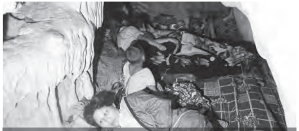
သုးမိဖိရဲကတီယုဟဲခဲလီတင် လီကဝီဖိတဘဉ်စုင်အိန်ကဒုလဲ လဲပုလဲပု၊ ပျါပုလဲလဲန့မ့ဆါ . တင်ဂီ-ခဲစါ

ပုထုလံဖိဒီး လီကဝီကမျှါတဖန် မ့ပျ တင်မံညါဖိလဲ အခိဆဲးဝဲဒုန် န့ဆဉ်တင်တတဉ်တ နါတဘိယုလီဒီး မ့ပျသ့ပျတဖန်လဲ အတီခိန်ရိန် ဝဲမတင်လာတင်ဒီးသဒါ ထံကီအဟိန်ခိန်ကပံင်၊ သ့ ပျှ၊ ဒီးထံကျိထံကွံင်တဖန်န့လီ။ စးထိန်လဲမိပံ ဖံဖုအစီဒီး တုလီလဲပစီ တစီဘဉ်တစီန့ အဲ