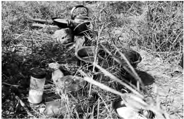
ပယီၤသုးမိၤစိရိထီၣ်ဒုးလုက့ၣ်ကိာ်, လီၢ်ကဝီဖိဘၣ်ဃုၢ်မုၢ်ဟးဖျိး တၢ်ဂီၤ-ခဲစါ

ပယီၤအတၢ်ဒုးထီၣ်ဒါတၢ်အံၤ နးထီၣ်ဆူၣ်ထီၣ် ဝဲကိးနံၤဒဲးန့ၣ်အယီၤ တၢ်ဘၣ်ယိၣ်အိၣ်ထီၣ်လၢ ပယီၤ သုးမိၤစိရိကသုဝဲကဘီယူၤလၢကဟဲခးလီၤတၢ်အယီၤ ဖဲလၢဒံၣ်စဲဘၣ် (၂၀) သီန့ၣ် (KNU) လီၢ်ခၢ်သးထုး ထီၣ်ရၢလီၤဝဲလံာ်ဘိးဘၣ်ရၢလီၤလၢ (ကဘီယူၤတဘၣ် ဟဲယူၤဘၣ်) No Fly Zone လၢလုက့ၣ်ကိာ်ဝဲန့ၣ်လီၤ. ပယီၤသုးမိၤစိရိတကပၤ အတၢ်လုၢ်ပိာ်ထွဲတအိၣ်ဘၣ် ဒီး တၢ်ဘိးဘၣ်ရၢလီၤလံာ်အံၤ (၃) သီဝဲအလီၢ်ခံလၢ ဒံၣ်စဲဘၣ် (၂၃) သီ, လၢမုၢ်န့ၣ်ယိၣ်ပုၤမံမုၢ်ဆၢကတီၢ် ပယီၤသုးဟဲခးလီၤကျိးဒိၣ်ဒီးကွံာ်လီၤမုၢ်ပိာ်သ့ၣ်တဖၣ် သကုၤဆးဒး လီၤဘၣ်ဝဲလၢပုၤလီၢ်ကဝီဖိအိၣ်တၢ်ဆိး တၢ်အလီၢ်ဒီးတၢ်ဖံးအိၣ်မၤအိၣ်အလီၢ်တဖၣ်န့ၣ်လီၤ. ပယီၤသုးဟဲခးလီၤတၢ်ဒီးကဘီယူၤကိးသီဒဲးလၢ (၅) သီအတီၢ်ပူၤဝဲ, လီၤမၢ်ကွံာ်တတီၤဘၣ်ဆၣ် ကဘီယူၤ ဟဲဆူၣ်တၢ်ဒီးခးလီၤဒဲးတၢ်တဘျီတဘျီန့ၣ်လီၤ. လၢန့ၣ်