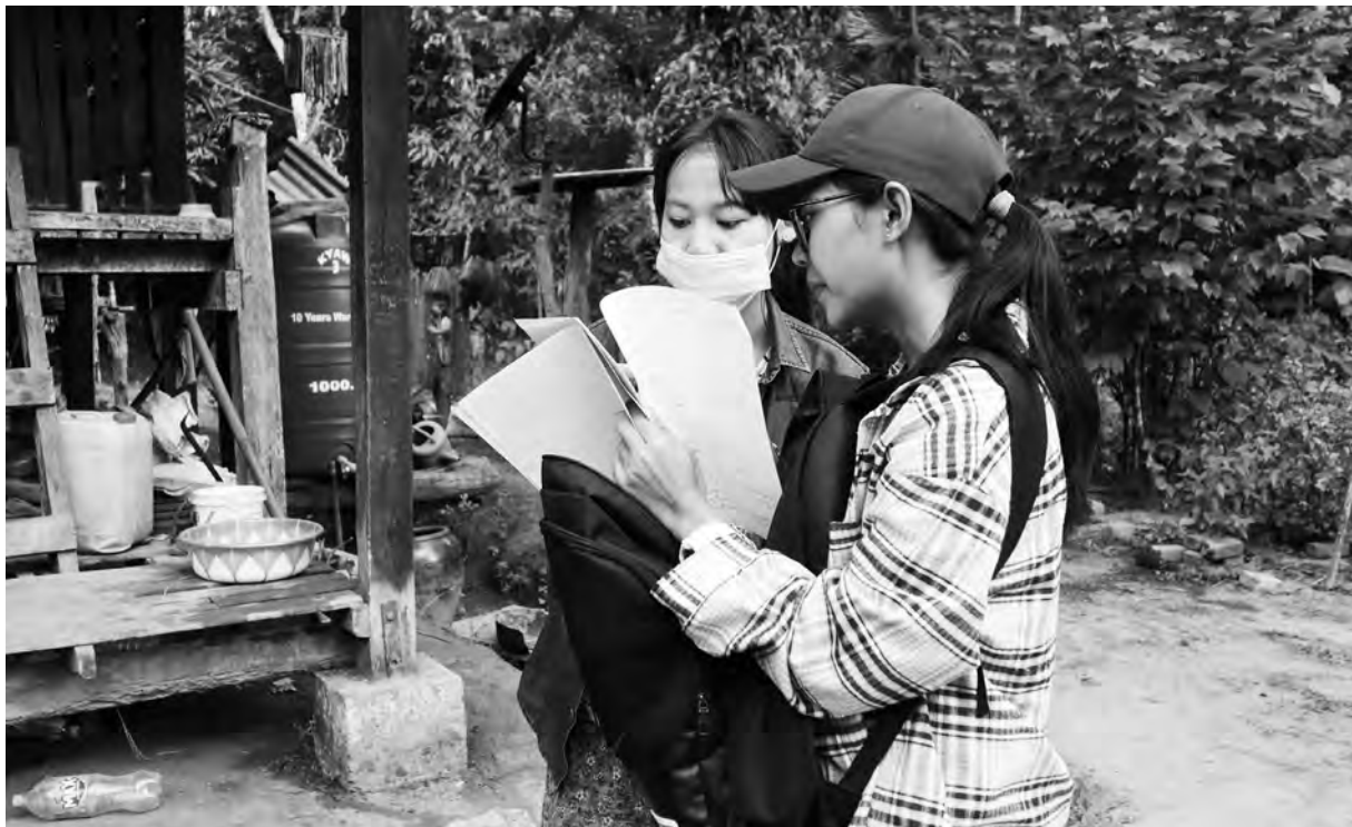
တီလါနီၣ်သးစါတဖၣ် ကတဲာ်ကတီၤထီၣ်အသးလၢတၢ်လီၤယုသ့ၣ်ညါတၢ်ထုၣ်တၢ်ဘိဒီးကသံၣ်သ့ၣ်ဂံၢ်ဝၣ်ဘိအဂီၢ်, တၢ်ဂီၤ-ခုစါ

တၢ်ဂ့ၢ်ကျဲးအိၣ်သ့ၣ်လၢတၢ်မၤဝဲတၢ်ယုထံၣ်သ့ၣ်ညါအလံာ်တဘျီအံၤ မ့ၢ်ဝဲ န့ဆၢၣ်တၢ်သုတၢ်သ့ၣ်ဒီး တၢ်ဒီးတၢ်လၢအမဲထီၣ်လၢ တီလါနီၣ်ဟီၣ်ကဝီၤပူၤတဖၣ်ဒီး သ့ၣ်ဂံၢ်ဝၣ်ဘိလၢအဂ့ၢ်ကသံၣ်ဖီၣ်လၢအအိၣ်မဲထီၣ်လၢ ယီၣ်မဲကျိၤဟီၣ်ကဝီၤတဖၣ်န့ၣ်လီၤ. သးစါတဖၣ်ယုသ့ၣ်ညါ, သံကွၢ်ဒီးကွဲးနီၣ်က့ၤဝဲ န့ဆၢၣ်တၢ်မ့ၢ်တၢ်ဘိအကလုာ်, အမံၤအသ့ၣ် ဒီးအိၣ်မဲထီၣ်တၢ်လီၢ်တၢ်ကျဲးတဖၣ် ဒီးတၢ်မ့ၢ်တၢ်ဘိတဖၣ်အံၤ အဟ့ၣ်ထီၣ်မၤစၢလၢပုၤလီၢ်ကဝီၤဖိအတၢ်လုၢ်အိၣ်သးသမူအိၣ်ဖဲလဲၣ်အဂ့ၢ်ဒီး ဂ့ၤလၢတၢ်အိၣ်ဆူၣ်အိၣ်ချ့ၣ်လဲၣ်အဂ့ၢ်တဖၣ်န့ၣ်လီၤ. တၢ်ယုသ့ၣ်ညါအံၤ ကျၢၢ်တံာ်စ့ၢ်ကိး ပုၤလီၢ်ကဝီၤဖိအတၢ်ထံၣ်လီၤဆီဘၣ်ယးဒီးတၢ်ကဲဘျီ