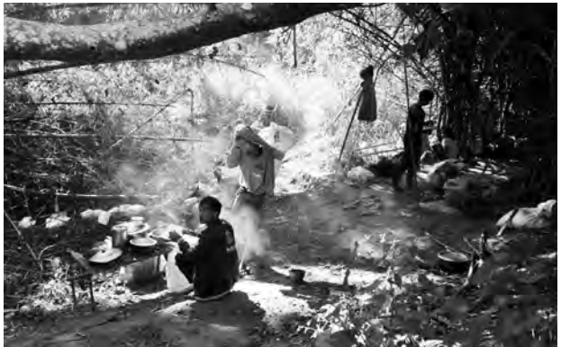
ပယီၤသုးမိၤစိရိထီၣ်ဒုးလုက့ၣ်ကိာ်, လီၢ်ကဝီဖိဘၣ်ဃုၢ်မုၢ်ဟးဖျိး ဒီးဘၣ်ဟံၣ်ကဲကွံာ်အဟံၣ်အယီၤ, တၢ်ဂီၤ-ခဲစါ