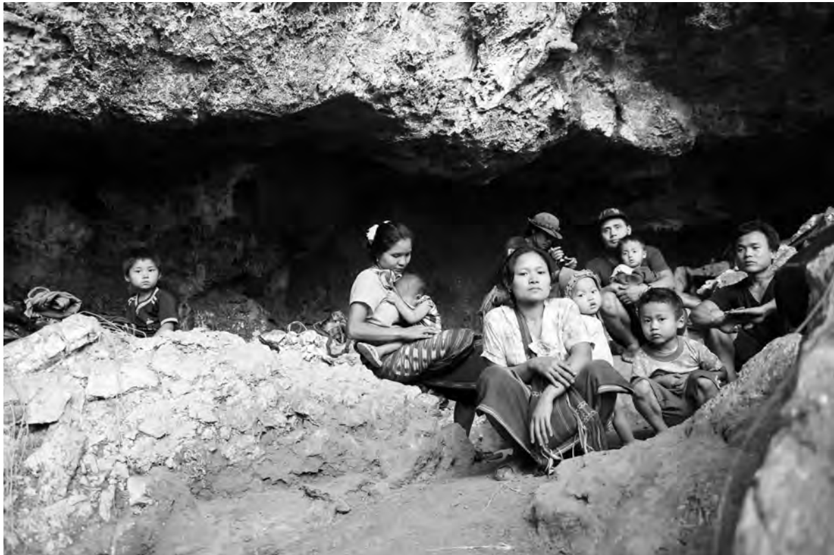
လီၢ်ကဝီၤပုၤကညီဖိတဖၣ်ဘၣ်ပျၢ်အိၣ်တၢ်အသးလၢပယီၤသးမိၤဖိရီၤအကဘီယုၤခးလီၢ်တၢ်အယီၤ. တၢ်ဂီၤ-ခ့ၣ်

ကညီဖိအတၢ်ပၢ်ဆၢဒီးအတၢ်ဂဲၤလိာ်အံၤယံာ် တ့ၢ်လံ ၇၃ နံၣ်လံဘၣ်ဆၣ် ကညီဖိအတၢ်မိၣ်န့ၢ်သး လီၢ်တၢ်မ့ၢ်တၢ်ခုၣ်ဒီးတၢ်သဘျုၣ် လၢကမျၢၢ်ဆၢမ့ၢ်လၢဒီး န့ၢ်ဝဲအံၤတုၤခဲအံၤပသ့ၣ်ညါဘၣ်လၢတၢ်တန့ၢ်ဘၣ်ဒီးအီၤ ဘၣ်ဒီးဆဲးပၢ်ဆၢဒီးတၢ်အဖၤမ့ၢ်န့ၣ်လီၤ. ■