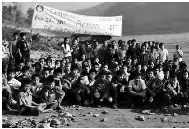
တံဟုဉ်တံသုဉ်ညါနုဉ်ဟံဘဉ်ထွဲတံဒီသအထံကျိထံကွဲအဂီဆု ဖိသုဉ်ဒီးသးစးလအအိဉ်ဝဲယိဉ်လိဉ်နံတဖဉ်, တံဂီ-ခွဲး

ခွဲးမတံတံအိဉ်အနန ၂၀ ဘဉ်ဆဉ်တမုာ် တံလတံပုးဒီးဘဉ်. တံလပမတံတဖဉ် အလီ အိဉ်လပကဘဉ်ဆဲးမအီဆုမဲဉ်ညါဒီးနနလီ. တံ လပကြးမဖျါထီဉ်, မဒိဉ်ထီဉ်အီတဖဉ်အိဉ်ဝဲဒဉ် တဘျူးမံ အဒိ, ယိဉ်လိဉ်တံမုာ်တံခုဉ်ကရူအတံ ဖံးတံမလပမတံ, ပဆိဉ်ထွဲဒီးမသကီးတံလံတ ဖဉ် ဒ်သးအမိလံမိဉ်ပုကဖျါဒိဉ်ထီဉ်ဒီးတုလီတံ လီအဂီနန ပဘဉ်မဆုဉ်ထီဉ်နုဉ်ပုထုလံဖိအတံ တီခိဉ်ရိဉ်မဲအနနဆဉ်ခိဉ်ယာ်, အဟီဉ်ခိဉ်ကပံအတံ လုအိဉ်သးသမူနန မုာ်တံလအရူဒိဉ်လပဘဉ်ဆဲး မအီ, ဟ်လီတံရဲဉ်တံကျဲလ ငးအိဉ်ထီဉ်ဝဲဒဉ်တံ ဖီဉ်လိဉ်စုလပတံတဖုဒီးတပအဘဉ်စာ ပဘဉ်မ ဆုဉ်ထီဉ်, ဒ်နနအသး တံလအတြီမတံတံပုခိဉ်ဖျိ တံငးတံယာ်အယီဒီး ပတံမတံကထီဉ်လိဉ်ထီဉ်ဘဉ် နနအိဉ်စုကီးအါမံနနလီ. တံဖံးတံမလတံဖိလံ