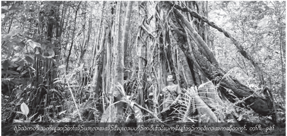
ရဲၣ်သဲကတိကုနုဆာန်တၢ်အိၣ်ယုၤလၢအအိၣ်ဒီးပုၤလၢပဟီၣ်ခိၣ်ကဝီၤဒ်သိးပကဒီးန့ၢ်ဘၣ်ကလံၤလၢအကဒိၣ်တက့ၢ်. တၢ်ဂီၤ-ခဲဖါ

ထါတယုၢ်အံၤဘၣ်တၢ်ဟံးန့ၢ်ကုၤ အီၤလၢသုလုၤကီၢ်ဝဲအဘၣ် (၁) နီၢ်ဂံၢ် (၁) (၁၉၉၉) နံၣ်