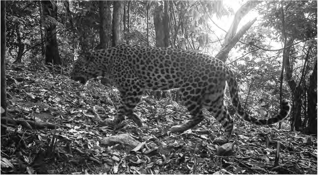
တၢ်ထံၣ်န့ၣ်ခ့ၣ်ပိၣ်ဖဲတၢ်ဒိလီၤခဲမၤဂၢၢ်ထြးလၢကညီကီၢ်စံၣ်. ကီၢ်သုလုၤအပူၤ.

၁၀ ခိၣ်ယီၤဒီးစံၣ်တၢ်အယံၤဆူမဲၣ်ညါတကယၤန့ၣ်ဝဲဒၣ် ၂၀ ခိၣ်ယီၤန့ၣ်လီၤ. နၢ်ဟူတၢ်ဂၤဒိၣ်န့ၣ်ပုၤကညီအနၢ် ဟူတၢ် ၅ ဘျီ ဒီးမ့ၢ်တအိၣ်ဘၣ်ထံလၢအသီ ၁၀ အတီၢ် ပူၤဘၣ်ဆၣ် လဲၤတၢ်ကဲဝဲဒၣ် မ့ၢ်လၢအအိၣ်သံသီဆၣ် ဖိကီၢ်ဖိလၢအဖိၣ်အိၣ်ဝဲအယံၤန့ၣ်လီၤ.