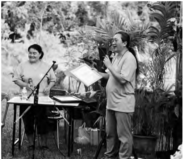
သရၣ်ဖီလဲၤဒီးသရၣ်မ့ၢ်ကီၢ်မ့ၢ်ဆၢၣ်တုၤလိာ်ခိၣ်ဆၢဒီးတုၤတၢ်တုၤတမ့ၢ်ဖဲဟါခီတၢ်ရဲၣ်တၢ်ကျဲၤအကတိၢ်. တၢ်ဂီၤ-ခုၣ်