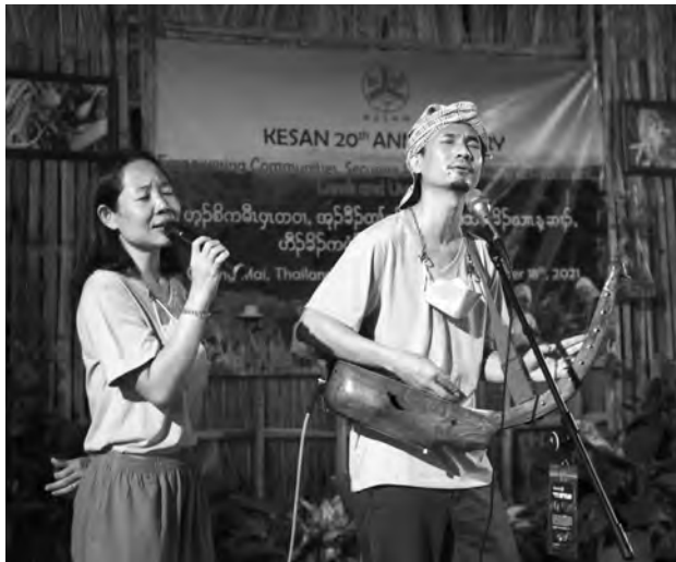
သရၣ်ခွဲးဒီးအမၤသးဝံၣ်ဆၢဂ့ၤဆၢဝါဖဲခုၣ် ၂၀ နံၣ်ဆဲးဆၢဟါခီတၢ်ရဲၣ်တၢ်ကျဲၤကတိၢ်. တၢ်ဂီၤ-ခုၣ်

တၢ်မၤလၢကပီၤခုၣ်နံၣ်ဆဲးဆၢတဘျီအံၤအဖီခိၣ် ပဒိၣ်မါဘးထိလၢအမ့ၢ် လီၢ်ခါၣ်သးသ့ၣ်ပုၤဝဲၤကျိၤခိၣ်ကတိၤဆၢဂ့ၤဆၢဝါ, ဟံၣ်ဖျါထီၣ်တၢ်မၤတၢ်လဲၤခီဖျိ, တၢ်မၤလုၢ်မၤသကိးတၢ်လုၢ်ဒီး တၢ်မၤအသုအသ့ၣ်လၢကရၢ်မိၢ်ပုၤမၤသကိးဘၣ်တၢ်ဒီးခုၣ်မ့ၢ်ဒ်အံၤလီၤ. “အနံၣ် ၂၀ မ့ၢ်ပုၤကညီန့ၣ် ကဲထီၣ်မ့ၢ်ကနီၤဖိၣ်သ့ၣ်ခါ, မ့ၢ်တၢ်ကရၢ်ကရီၣ်န့ၣ် န့ၣ်ဘၣ်တၢ်မၤလိလၢပုၤ, လၢပုၤဒီးတၢ်လဲၤခီဖျိ, ဒိၣ်တုၣ်ခိၣ်ပုၤ လၢပုၤဒီးဂံၢ်ဘါလၢကလဲၤဆူညါကွၢ်ကွၢ်န့ၣ်ပတဲသ့န့ၣ်လီၤ. ပမ့ၢ်ကွၢ်က့ၤလၢကညီတတၢ်အပူၤ, တၢ်ဟံၣ်ဆၢဟီၣ်ကဝီၤ, ကညီဖီအကျိၤ ကရၢ်လၢအဟူးဂဲၤလၢခိၣ်ယၢန့ၣ်ဆၢၣ်ဂ့ၢ်ဝီတကပူၤန့ၣ် အဆိကတၢ်မ့ၢ်ဝဲဒ်ခုၣ်တၢ်ကရၢ်ကရီၣ်န့ၣ်ပတဲသ့လီၤ.”