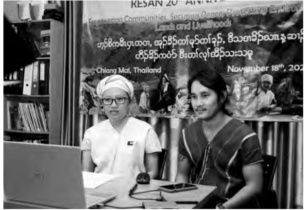
ကလံကျိပုဆုတံဉ်ရဲဉ်တံဉ်ကျဲ သရဉ်မုဉ်ဆဉ်မုဒီးသရဉ်စိဉ် ဝဲခဲဉ် ၂၀ နံဉ်ဆဲးဆာအကတီ၊ တ်ဂီ-ခဲဉ်

ကျိတဖဉ်ဒီးစံးဝဲ “တဂီအံဉ်မုဉ်တံဉ်ဆိဉ်ဂုဆိဉ်ဝါလါ ပဝဲခဲဉ်အဂီ လာပအိဉ်ဒီးမုဉ်တနံလောပမလကပီ ဘဉ်ကုဝဲဒဉ်ခဲဉ်ဟဲအိဉ်ထီဉ်ပဲထီဉ်အနံဉ် ၂၀ နံဉ် လီ၊ ပကွဲမုဉ်ဘဉ်တံဉ်သကိးပုမသကိးတံဉ်ဒီးပုဆိဉ် ထွဲပုသုဉ်တဖဉ် ယုဉ်ဒီးပုမသကိးတံဉ်ခိဉ်နါလခုဉ် အဲဉ်ယုဉ်တကပု လီဆိဒဉ်တံဉ် တံပဒိဉ်မါဘးထီလါ အမုဉ်လီဉ်ခါသးသုဉ်ပုဝဲကျိခိဉ် ယုဉ်ဒီးပုကိးဂုဒီး ပုဒီးတံဉ်ယုးယီဉ်အါ ဒီးသးခုတုလိဉ်ဘဉ်သုကိးနီ ဂုဒီးန့ဉ်လီ။”