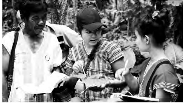
လီၤကဝီၤပှၤတၢ်ဖိတဖၣ်လီၤမၤတၢ်ယုသ့ၣ်ညါဒီးကွၢ်စ့ၣ်ကယၢ် အပှၤတၢ်သ့ၣ်ပှၤ. တၢ်ဂီၤ-ခ့ၣ်

မၤတၢ်တၢ်လၢပတၢ်ဖံးတၢ်မၤအပူၤအိၣ်ဝဲဒၣ်အါမးလီၤ. အဒိၣ်ကတၢ်ပသးလီၤက့ၤဝဲဒၣ်တၢ်ခွဲးတၢ်ယၢ်လၢပဂ့ၣ် ကျဲးစးတၢ်ဘၣ်ထွဲဒီးတၢ်ဒိသဒါက့ၤခိၣ်ယၤန့ၣ်ဆၢၣ်, တၢ်မၤဖျါထီၣ်ဒီးမၤမူထီၣ်က့ၤပပှၤထူလံၤဖိပှၤလီၤကဝီၤ ဖိအတၢ်န့ၣ်ပခွဲးယၢ် လီၤဆီဒၣ်တၢ် တၢ်န့ၣ်ပဆၢၣ်ဘၣ် အဝဲသ့ၣ်အဟီၣ်ခိၣ်ကပံၣ် ဒ်သိးတၢ်ကဟ်ပနီၣ်အီၤလၢ တၢ်သိၣ်တၢ်သီသန့ဖိလံၤစံၣ်အပူၤလီၤ. အဂၤတခါ ပှၤ ထူလံၤဖိတဖၣ်ကမၤဒိၣ်ထီၣ်ဒီးကမၤလဲၢ်ထီၣ်က့ၤအ တၢ်ပဆၢၣ်ရဲၣ်ကျဲးအလီၢ်အကျဲး အဒိ, တၢ်ဒုးအိၣ်ထီၣ် ယိၣ်လိာ်တၢ်မုၢ်တၢ်ခုၣ်အတၢ်ရဲၣ်တၢ်ကျဲးသ့ၣ်တဖၣ် ပ မ့ၢ်ဘၣ်ကွၢ်လၢကီၢ်ပယီၤဒိတဘျီအပူၤ ကလုာ်ဖျါဖိ အတၢ်လီၢ်တၢ်ကျဲးတဖၣ်န့ၣ် တၢ်မၤအီၤသ့အိၣ်အါတီၤ ဒီးပစးထီၣ်မၤတၢ်ဒီးမၤသကိးတၢ်ဒီးကရၢၢ်ကရၢအဂ့ၤ အဂၤလၢတၢ်သ့ၣ်ထီၣ်တၢ်မၤလၢအလီၤကၢ်ဒီးယိၣ်လိာ် တၢ်မုၢ်တၢ်ခုၣ်ကရၢၢ်န့ၣ်အိၣ်ဝဲန့ၣ်လီၤ. ဘၣ်ဆၢၣ်စးထီၣ် လၢသးဟံးန့ၣ်ဆၢၣ်တၢ်စိတၢ်ကမီၤန့ၣ် တၢ်ရဲၣ်တၢ်ကျဲး သ့ၣ်တဖၣ်န့ၣ်ယၤလီၤဒီးလီၤကဒုလီၤကဒါက့ၤ, ဒီးပှၤမၤ တၢ်အခိၣ်တဖၣ် ဘၣ်အိၣ်ခူသ့ၣ်စ့ၢ်ကိးအါဂၤလၢတၢ် ကလုာ်ယုလုာ်ဖိၣ်အဝဲသ့ၣ်အယိ တၢ်လီၤပျံၤလီၤဘၣ် ယိၣ်အိၣ်ဝဲဒၣ်အါမးစ့ၢ်ကိးလီၤ.