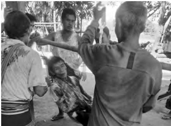
ပယီၤသုးမိၤစိရိၤအကဘီယူခးလီတၢ် ငုးအိၣ်ထီၣ်တၢ်ဘၣ်ဒိဘၣ်ထံးတၢ်သံတၢ်ပုၤဒီးတၢ်ဟးဂုၣ်ဟးဂီၤ, တၢ်ဂီၤ-ခ့ၣ်, KPSN