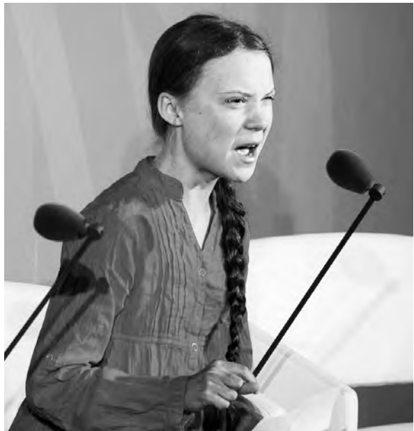
ကြံထံာ်ကတိၤလီၤတၢ်ဖဲဘိမုာ်စၢ်ဖျၢာ်ကရၢတၢ်အိၣ်ဖျၢာ်ဒိၣ်လၢ တၢ်ဘျီၣ်လီၤကွီဟ်ဖျၢာ်ကသုၣ်ကသံးတၢ်ဆီတလဲတၢ်ဘျီၣ်ဒိၣ်ထံး ဝဲဝဲန့ၣ်ယံး.

သး စာ်မုာ်ဖိလၢအမုာ် ကြံထံာ် သၢဟး (Greta Thunberg) န့ၣ်အိၣ်ဖျၢာ်ထီၣ် ဝဲလဲလၢယနူအါရံၤ ၃ သီ, ၂၀၀၃ နံၣ် ဝဲကီာ်စွံၤဒ့ၣ် (Sweden) န့ၣ်လီၤ. ဝဲ (၂၀၁၈) နံၣ်တချူးဒံးလၢ ကီာ်စွံၤဒ့ၣ် (Sweden) ထံကီာ်ခိၣ်နာ်တၢ်ဒီးယုထၢဒံး ဘၣ်န့ၣ်, သးစာ်လိာ်ဘိအသးအိၣ် ၁၅ နံၣ်လၢအမုာ် ကြံထံာ်သၢဟးန့ၣ် စးထီၣ်ဟူးဂဲလဲၤဟ်ဖျၢာ်ထီၣ်အသး လၢကီာ်စွံၤဒ့ၣ်ဘျီၣ်ဒိၣ်အမဲာ်ညါ ယုာ်ဒီးတၢ်ပနီၣ်လၢ အဟ်ဖျၢာ် “ကွီဟ်ဖျၢာ်သးလၢတၢ်ကသုၣ်ကသံးတၢ်ဆီတလဲသးအဂီၢ် (School strike for Climate Change)” န့ၣ်လီၤ. ဒီးဝဲမုာ်ယံာ်နံၤကီးနွံဒံးန့ၣ် အဝဲယုာ်ကွီလၢတၢ် ဟ်ဖျၢာ်ထီၣ်သးလၢကီာ်စွံၤဒ့ၣ် (Sweden) ဘျီၣ်ဒိၣ်အမဲာ် ညါန့ၣ်လီၤ. အခိၣ်ထံးအဝဲဟ်ဖျၢာ်ထီၣ်အသးထဲတဂၤ မိဘၣ်ဆၣ် လၢခံပုၤပၣ်ယုာ်ဟ်ဖျၢာ်ထီၣ်အသးဒီးအီၤ