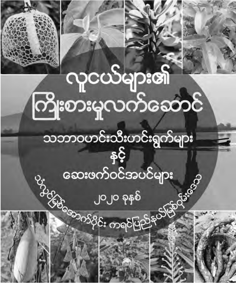
တၢ်ဒီးတၢ်လၢဒီးကသံၣ်သ့ၣ်ဂံၢ်ဝဲၣ်အါကလၢအလံာ်တၢ်ဟ်ဖျါလၢတီၢ်လါနီၣ်သးစၢ်ဒုးအိၣ်ထီၣ် လံာ်အကုအိၣ်, တၢ်ဂီၤ-ခုဲစါ

လၢလၢအိၣ်မဲထီၣ်တၢ်လီၤဖဲန့ၣ်တဖၣ် လီၤမၤကွံာ်ဝဲန့ၣ်လီၤ. တၢ်မုၢ်တၢ် ဘိမဲထီၣ်ညီန့ၣ်တၢ်လီၤလၢအမ့ၢ် ကစၢ်ကလိ, ပှၢ်ကျါ, ပှၢ်ထိးနါ, စံာ်ပှၢ်, ခုးသံၣ်ထိးနါ, နီၣ်ဒီးတၢ်လီၤအဂၤတဖၣ် ကဲထီၣ်က့ၤပှၢ်တဂၤအတၢ်န့ၢ်ဟ ဘၣ်အယိ ဒီးပှၢ်သ့ၣ်တဖၣ်အံၤ လၢကမၤဝဲတၢ်သ့ၣ်တၢ်ဖျးဒီးတၢ်ဖဲအိၣ်မၤ အိၣ်လီၤအဂီၢ် မၤပျီမၤဆ့ၣ်ဝဲသ့ၣ်ပှၢ်ဒီးတၢ်လီၤတၢ်ကျဲတဖၣ်ဒီးသ့ၣ်က့ၤ တၢ်မုၢ်တၢ်ဘိလၢတမ့ၢ်လီၤကဝီၤတၢ်မုၢ်တၢ်ဘိဘၣ်အယိ န့ဆၢၣ်တၢ်မုၢ်တၢ် ဘိအါကလၢ ဘၣ်လီၤမၤကွံာ်ဝဲန့ၣ်လီၤ. လၢန့ၣ်အမဲာ်ညါ တၢ်ထုးထီၣ်သ့ၣ် ဝဲဒီး တၢ်သ့ၣ်ဝဲဒီးဖီကဟၣ်လၢအမၤပျီထီၣ်ဝဲသ့ၣ်ပှၢ်အယိ မၤဟးဂီၤကွံာ် သ့ၣ်ပှၢ်, လၢတၢ်ကယုအိၣ်ဖိၣ်န့ၢ် ချံးဒီးဆီမံၤ ဒီးတၢ်ဖိတၢ်လံာ်မံၤလၢအဂၤ တဖၣ်အဂီၢ် တၢ်ဒွဲၣ်အူအိၣ်ကွံာ် စံာ်ပှၢ်ထိးနါ, သ့ၣ်ပှၢ်ထိးနါ, တၢ်ကျိတဲာ် မၤပျီဒီးဒွဲၣ်အူကွံာ် တၢ်မုၢ်တၢ်ဘိလၢအမဲထီၣ်လၢနီၣ်ပှၢ် ထံကမါသ့ၣ်တဖၣ် အံၤစ့ၢ်ကီး မ့ၢ်တၢ်ဖဲတၢ်မၤခိၣ်သ့ၣ်လၢ အမၤဟးဂီၤဒီးမၤလီၤမၤကွံာ် လီၤ ကဝီၤတၢ်မုၢ်တၢ်ဘိတဖၣ်န့ၣ်လီၤ.