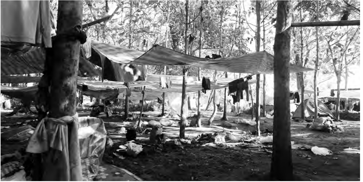
ပယီသုးမိစီရီထီၣ်ဒုးလုက့ၣ်ကိၣ် လီၢ်ကဝီဖိဘၣ်ယုာ်မ့ၣ်ဟးဖျိး. တ်ဂီ-ခုစါ

အမဲၣ်ညါ တ်ဒုးအံၤအါထီၣ်ရုၢ်ရုၢ်ဒီးသလၣ်လီၤတုၤလၢ သုၣ်ဘီဘိကရုၢ်ဒီးမိခံကရုၢ် ဒုပျၢ်ယာ်ကီၢ်ရုၢ်ကီးတရံး ကီၢ်ဆၣ် ဒီးသဝီအိၣ်သုၣ်လီၤသးလၢသုၣ်မ့ၣ်ကျိအက ပၤ လၢအအိၣ်ဘူးဒီးပယီသုးကလၢ လၢလုက့ၣ်ကိၣ် ကလံထံးတခီန့ၣ်လီၤ.