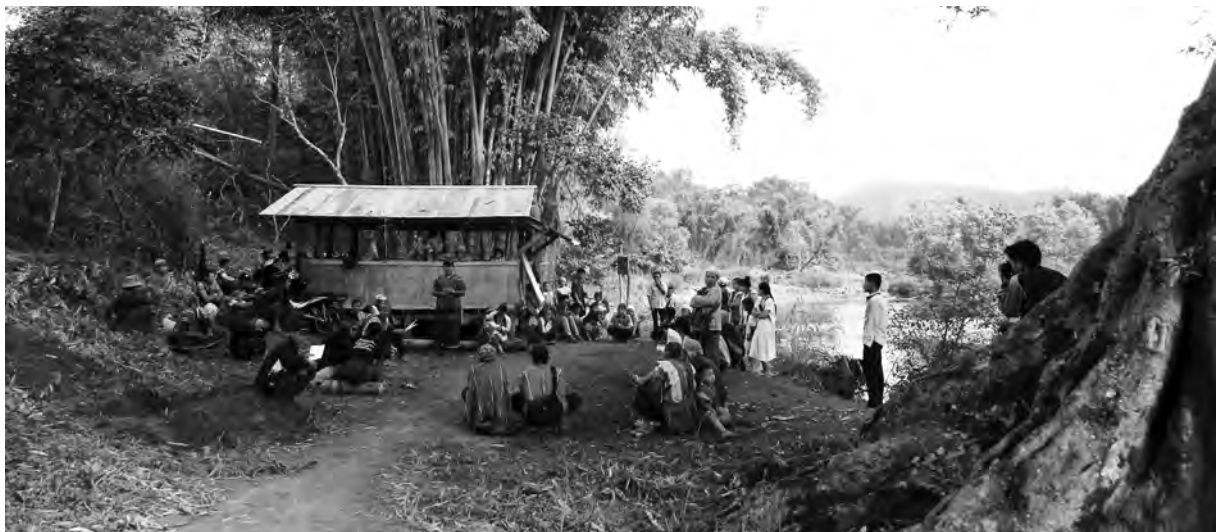
ပုၤထူလံၤဖိတဖၣ်အိၣ်ဒီးတၢ်ခွဲးတၢ်ယာ်လၢကဒီးန့ၢ်ဘၣ်တၢ်သ့ၣ်ညါန့ၢ်ဟံၣ်ဒီးနီၢ်ကစၢ်တၢ်ပတၢ်ပြးဒီးပုၤထူလံၤဖိတၢ်ဘျၢသဲးစး, တၢ်ဂီၤ-ခဲာ်

ဘိမ့ၢ်စၢဖျိၣ်ကရၢအလံာ်ဘိးဘၣ်သါလီၤလၢ အကူၣ် (၇) န့ၣ်ဘၣ်ထွဲဒီး နီၢ်ကစၢ်တၢ်ပတၢ်ပြးဒီးပုၤ ထူလံၤဖိတၢ်ဘျၢသဲးစးအဂ့ၢ်လီၤ. ပုၤထူလံၤဖိတဖၣ်အိၣ် ဒီးတၢ်ခွဲးတၢ်ယာ်လၢကပာ်လီၤတၢ်ဆၢတဲာ်လၢအနီၢ်က စၢ်ဒ်ဝဲ, မ့တမ့ၢ် ကဲထီၣ်ကရၢဖိဒ်အဝဲသ့ၣ်အလုာ်လၢ ထူသန့အိၣ်ဝဲအသိး, မၤတၢ်ဆၢတဲာ်လၢအတၢ်ကရၢက ရိတၢ်အိၣ်သ့ၣ်ထီၣ်ဆီလီၤသးအက့ၢ်အဂီၢ်လၢကစိာ်က ဖိထီၣ်ဒီးဟံးဃာ်ဟူဃာ်က့ၤအသးစးတၢ်မၤကျဲသန့ ဒီး အိၣ်ဒီးတၢ်ခွဲးတၢ်ယာ်လၢတၢ်ဟံးဃာ်ဟူဃာ်ဒီးတၢ်ဒုး အိၣ်ထီၣ်တၢ်ဆဲးကျဲဆဲးကျိး, တၢ်ရဲၣ်လိာ်မုာ်လိာ်, တၢ် ဟ်ဖျိၣ်မၤသကိးတၢ်ဒီးဒုးလိၣ်ထီၣ်ဖးထီၣ်က့ၤတၢ်အၢၣ် လီၤလံာ်ယံးဃာ်သ့ၣ်တဖၣ်န့ၣ်လီၤ.