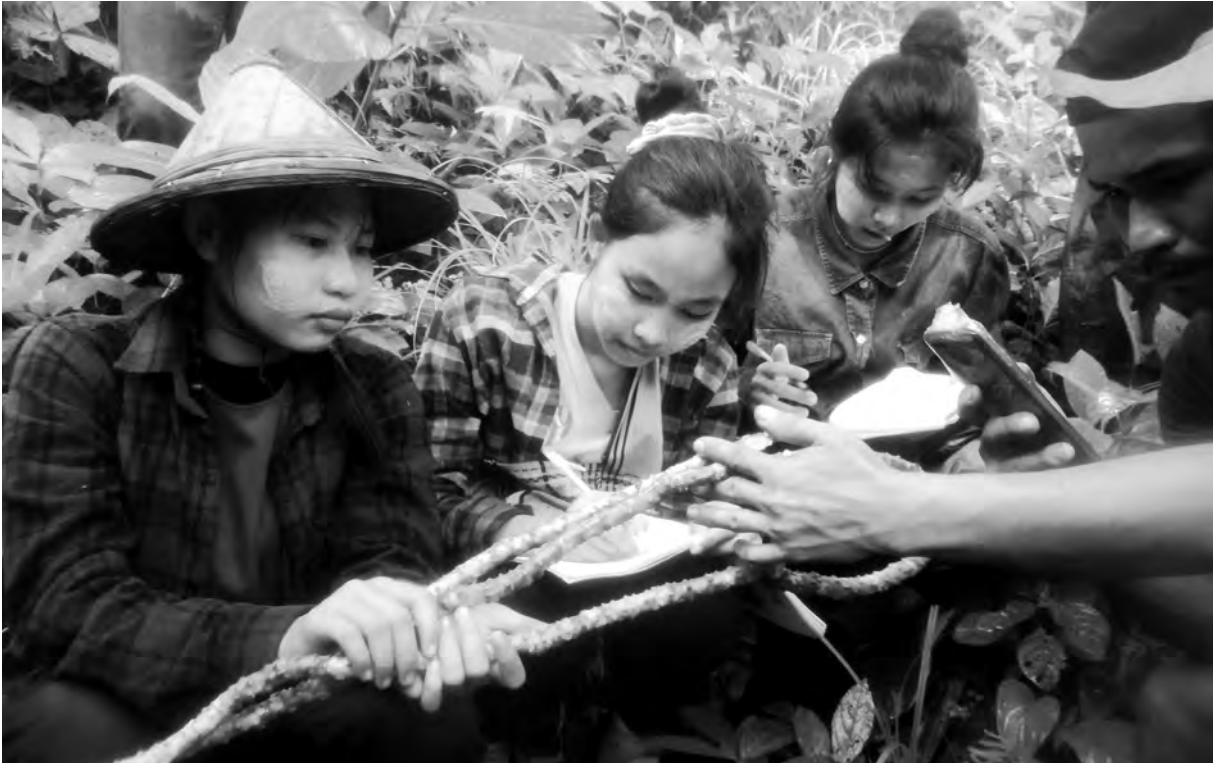
တီလါနိုဉ်သးစာ်တဖၣ် ကွဲးနီၣ်ကွဲးပါတၢ်ဖဲအလီၤယုသ့ၣ်ညါတၢ်ထုၣ်တၢ်ဘိဒီးကသံၣ်သ့ၣ်ဂံၢ်ဝဲၣ်စဲအဆၢကတီၢ်, တၢ်ဂီၤ-ခ့ၣ်စဲၢ်

ကဲဖျိၣ်ဟဲလၢတၢ်မုၢ်တၢ်ဘိအတၢ်မဲထီၣ်အလီၤအကျဲတၢ် အိၣ်သးတဖၣ်န့ၣ်လီၤ.