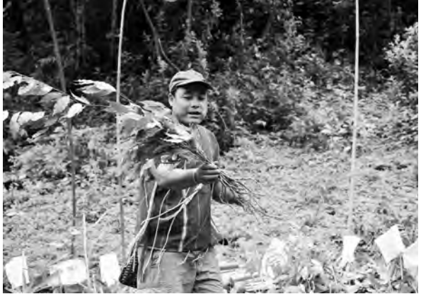
တံညၢၣ်ကံာ်လၢပုၤတတၢ်မၤအဂီၢ်က့ၤစးသပုၤပုၤ, တၢ်ဂီၤ-ခုစါ