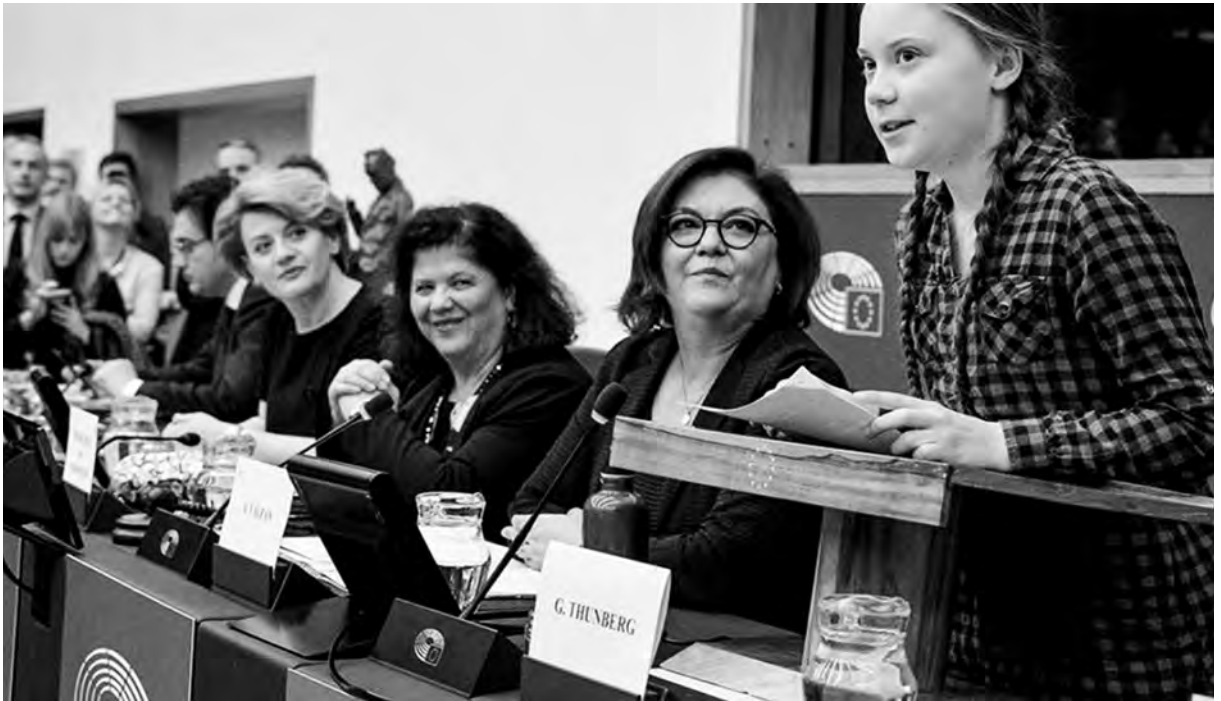
ကြံ့ထည်သဟဇာတတီလီတော်ဒီးဟ်ဖျါထီဉ်ခိဉ်ယာန့ဆာဉ်တော်ဂှ်ဆုခိဉ်နာ်ဖးဒိဉ် (MEPs) တဖဉ်အမဲဉ်ညါ ဖဲတော်အိဉ်ဖျိဉ်ဖးဒိဉ် လာ Strasbourg@ EP, တော်ဂီု https://www.europarl.europa.eu/news

လၢန့ဉ်ကဟ့ဉ်ပှၤလၢနီၢ်ခိတၢ်အိဉ်ဆုဉ်အိဉ်ချ့ တကး ဇံးဘဉ်ကဟ့ဉ်စ့ၢ်ကိးပှၤ လၢနီၢ်သးတၢ်သ့ဉ်ဖျိဉ်သးညီ န့ဉ်လီၤ. လၢတၢ်န့ဉ်အယီၤ ပဲသ့ဉ်ဘိဉ်သးစၢ်တဖဉ် ဖဲသိးပကအိဉ်ဒီးပခါဆုညါလၢအပျဲဒီးန့ဆာဉ်တၢ်ထူး တၢ်တီၤန့ဉ် ပကစးထီဉ်သကိးပတၢ်ဟူးတၢ်ဂဲၤလၢက မၤစ့ၤလီၤက့ၤကဲၤစီဟးထီဉ်တဖဉ် (Carbon) လၢအ ဘဉ်လးဒီးပတၢ်ဖဲတၢ်မၤ, ပတၢ်အိဉ်တၢ်အိ, ဒီးပတၢ် လဲတၢ်က့ၤလၢခဲအံၤတဘျီယီတဂၤလၢပလီၢ်ပကျဲဒုဉ် ပဲန့ဉ်တက့ၢ်. ပထံဉ်ဘဉ်လဲၤခိဖျိဘဉ်ပဲလၢတၢ်ကိၢ် တၢ်ခုဉ်တဘဉ်လီၢ်ဘဉ်စးဒဲးသိးလၢညါဘဉ်. ပဟီဉ် ခိဉ်ဖျါအံၤကိၢ်သွးထီဉ် ဒီးဟဲစိတၢ်ဆူးတၢ်ဆါအက လုာ်ကလုာ်န့ဉ်လီၤ. ပကက့ၢ်ထံ ဒီးသမံသမိးက့ၤပ တၢ်ဟူးတၢ်ဂဲၤလၢအမ့ၢ်တၢ်လဲတၢ်က့ၤ, တၢ်အိဉ်တၢ်အိ,