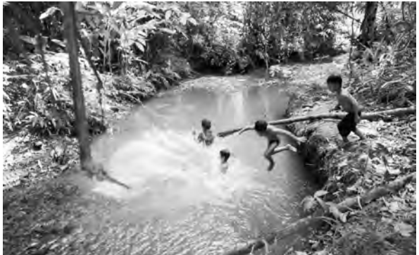
ရဲၣ်သဲကတီၢ်တၢ်အိၣ်ယုၤလၢပဖိလဲၤကဆိးကါဒီးမ့ၢ်လၢသးခု လၢခါဆူညါအဂီၢ်, တၢ်ဂီၤ-ခုစါ

ဆိးဟၤ ဒီးအတၢ်လုၢ်အိၣ်လုၢ်အိၣ်က့ၤအအံၤဖိတြီၤဖိတဖၣ် အဂီၢ်န့ၣ်လီၤ. ကဲ..ကဲ..မ့ၢ်စံးဒ်န့ၣ်ဒီး နီၢ်မ့ၢ်တြီၤဖိအဖိ မ့ၢ်ဖိခါ ဖါလူၤသီ, နီၢ်ဖိဒု, ဖါဘုသိၣ်, နီၢ်ဒုၣ်လိၤစၢ.. ပကဘၣ်မၤဒ်လဲၣ်. နသုသ့ၣ်တဖၣ် သုမ့ၢ်တ့ၢ်လံၤပုၤလၢ အခိၣ်ထီၣ်ဘးမံၤထီၣ်ဖျဲးလံ. ပနီၢ်ကစၢ်အတၢ်အိၣ်မ့ၢ် ဆိးဟၤမ့ၢ်ဂ့ၤ, ခိၣ်ယုၤန့ၣ်ဆၢၣ်ဒီးတၢ်အိၣ်ဝဲတရံးပုၤတဖၣ် မ့ၢ်ဂ့ၤ, ဖိပုၤတကလုာ်အလုၢ်လုၢ်ထူသန့အိၣ်အသးန့ၣ် တၢ်ထံကစၢ်တၢ်တီကစၢ်, လုၤဖးဒိၣ်လုၤဖးထီတၢ်အိၣ်အ သဝီပာဲအကစၢ်- သီသံၣ်ခိၣ်, ပုၤဂီၤခိၣ်-လၢၢ်မ့ၢ်, လၢၢ်ကိး, လၢၢ်ပီၤဟၤ, လူၤသီခိၣ်, ဖိဒုခိၣ်, တရံၢ်ခိၣ်က စၢ်အဲၣ်ဘၣ်သုလီၤ. လိာ်က့ၤဒၣ်တခါလၢသုကအဲၣ် ဆၢက့ၤအီၤပျဲးဒီး ထီၣ်ခ့ထီၣ်ကိးကယုၢ်သုကယုၢ်ပျဲးဒီး တၢ်ယုၤတၢ်အစ့ၢ်ခဲလၢာ် ဒီးသန့လိာ်အသးယၢ်ခိၣ်ယၢ် ဟဲန့ၣ် အိၣ်ပျဲးဝဲဒီးတၢ်အဲၣ်ဆၢက့ၤအီၤ ဒီးအတၢ်အဲၣ် တလီၤဆ့ၣ်လၢပယိဘၣ်န့ၣ်လီၤ. ■