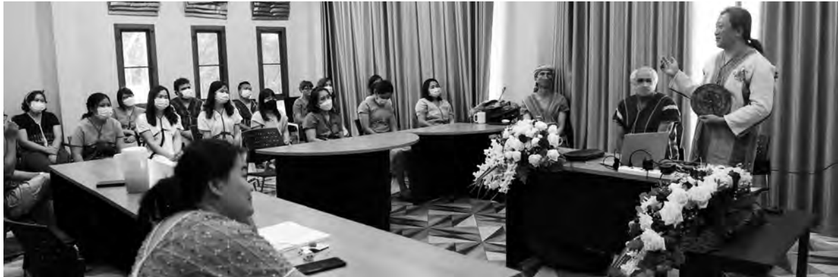
ခုစဲၢ်ပုၤနဲၣ်တၢ်ခိၣ်ကျါကတီၢ်ဟ့ၣ်ဂံၢ်ဟ့ၣ်ဘၢဒီးဆၢဂ့ၤဆၢဝါခိၣ်န့ၢ်ပုၤမၤသကိးတၢ်ဖိကိးဂၢဖဲ ခုစဲၢ် ၂၀ နံၣ်ဆဲးဆၢအကတီၢ်.

တၢ်ရဲၣ်တၢ်ကျဲၤလၢကလံၤကျါအကတီၢ် ခုစဲၢ် ပုၤနဲၣ်တၢ်ခိၣ်ကျါအိးထီၣ်တၢ်ရဲၣ်တၢ်ကျဲၤဒီးတုၢ်လိာ် မ့ၢ်ပုၤလၢအဟဲဒိကန့ၣ်ဒီးကွၢ်တၢ်ရဲၣ်တၢ်ကျဲၤလၢကလံၤ