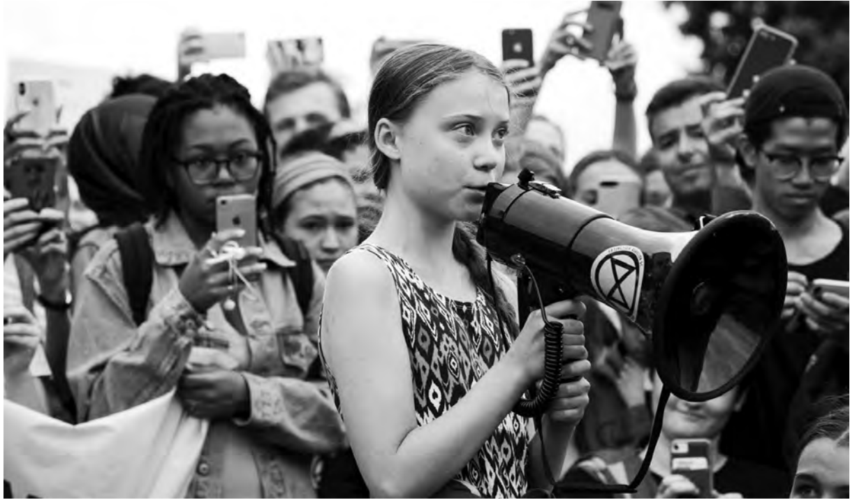
သးစၢ်မုၢ်ကြံထံၣ်သၢဟံၤ တီခိၣ်ရီၢ်ဖဲဟူးဂဲၤကတိၤန့ၣ်ခဲးတၢ်ဘၣ်ထွဲဟီၣ်ခိၣ်ကီၢ်သွးထီၣ်ဒီးတၢ်ကသုၣ်ကသံးတၢ်ဆိတလဲအဂ့ၢ် ဖဲလၢဖဲပထုဘၣ် ၁၃ သီ ၂၀၁၉ နံၣ်ဖဲ ကီၢ်အဝဲဂ့ၤက. Washington, DC, တၢ်ဂီၤ-Sarah Silbiger/Getty Images

က့ၤယမုၢ်ပုၤလၢအတၢ်ဟဲဝဲဂ့ၤတၢ်လီၤ. ပုၤအဂၤတဖၣ် တၢ်ဘၣ်ခိၣ်ဘၣ်တၢ်ဒီးသံဝဲဒၣ်န့ၣ်လီၤ. တၢ်မူအတၢ် လီၤပျီၢ်ကွၢ်. ဒီးတၢ်မူအတၢ်စးထီၣ်လီၤတူၣ်ကွၢ်ဝဲဒိၣ် ဒိၣ်မုၢ်မုၢ်န့ၣ်လီၤ. မ့ၢ်သုဝဲခိၣ်န့ၣ်သ့ၣ်တဖၣ် တၢ်လၢ သုဝဲန့ၣ် မ့ၢ်ထဲကျိၣ်စ့ဒီးတၢ်တဲမုၢ်န့ၣ်လၢအမ့ၢ် မုၢ်ကျိၣ် ဝဲၤကွၢ်တၢ်ဒိၣ်ထီၣ်ထီၣ် လၢအကမၤဟးဂီၤပခါဆူ ညါန့ၣ်လီၤ. တကးဒီးဘၣ် သုဝဲခိၣ်န့ၣ်တဖၣ် မၤလီၤစၢ် ကွၢ်ပသးသဟီၣ်, ဘၣ်ဆၣ်ပဝဲသ့ၣ်ဘီၣ်သးစၢ်တဖၣ် သ့ၣ်ညါဒီးန့ၣ်ဟံၤသုတၢ်ဆါလီၤကွၢ်ပုၤန့ၣ်လီၤ. စိလၢ ကဟဲသးစၢ်တဖၣ် ကကွၢ်ဟ့ၣ်ကွၢ်စ့ၣ်သုတၢ်ဟူးတၢ် ဂဲၤန့ၣ်လီၤ. သုမုၢ်ဆဲးမၤတၢ်ဟူးတၢ်ဂဲၤ ဒီးတၢ်ဖဲတၢ်မၤ လၢအမၤလီၤတဲၣ်ကွၢ်ပုၤန့ၣ် ပတပျၢ်သုတၢ်ကမၣ်နီတ ဘျီဘၣ်” လီၤ. ခိဖျိလၢအဝဲအတၢ်ဟူးတၢ်ဂဲၤ ဒီးတၢ် စံးတၢ်ကတိၤအယိ ပုၤအါဂၤစးထီၣ်သ့ၣ်ညါအိၣ်န့ၣ် လီၤ. ပုၤဖဲအ့ၣ်ဖိတဖၣ်မုၢ်ဂ့ၤ, ပုၤလၢအဟူးဂဲၤလၢတၢ်က သုၣ်ကသံးတၢ်ဆိတလဲတဖၣ်မုၢ်ဂ့ၤ, ဒီးပုၤကမုၢ်အါဂၤ ဘၣ်သးဒီးဆိၣ်ထွဲအဝဲအတၢ်ဟူးတၢ်ဂဲၤအံၤန့ၣ်လီၤ.