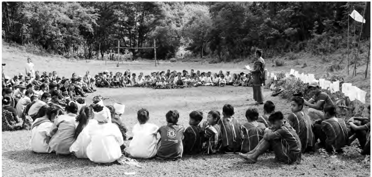
တံညၣ်ကံၢ်လၢပုၤတတၢ်မၤ, ဟ့ၣ်ဂံၢ်ဟ့ၣ်ဘါဒီးဟ့ၣ်သဆၣ်ထီၣ်ပုၤသးစၢ်လၢတၢ်ကတဲၣ်ကတီၤမၤဂ့ၤထီၣ်ခိၣ်ယၤန့ၣ်ဆၣ်, တၢ်ဂီၤ-ခုစၢ်

မ့ၢ်စံးဒ်န့ၣ်ဒီးအဝဲသ့ၣ်မ့ၢ်အအိၣ်ဒီးကစီဒီခါ, မ့ၢ်တမ့ၢ် အသံလၢ်လံၤခါ, မ့ၢ်အလီၤမၢ်သုၤပါလၢ်လံၤ ခါ. အသံလၢကျဲၣ်လဲၣ်, အလီၤမၢ်လၢကျဲၣ်လဲၣ်, မ့ၢ်တ မ့ၢ် မ့ၢ်အတအိၣ်ဘၣ်လၢကညီဖိအစုယံၣ်ခိၣ်မူး, အ မ့ၢ်ခိၣ်ထံခိၣ်, အသဘျုၣ်တၢ်ယါ ဒီးသံးကတံၤအထံ သ့ၣ်တဖၣ်န့ၣ်လၢဘၣ်အယိန့ၣ်ခါ. မ့ၢ်တမ့ၢ် ဒ်အဝဲသ့ၣ် အလီၤကျိၤခူသ့ၣ်အိၣ်ဟ်အသး ပတသ့ၣ်ညါနၢ်ပာ်လၢ အတၢ်အကျိၤအကျဲၤလၢဘၣ်တခီခါ. မ့ၢ်တၢ်တဆဲးကျိး ဒီးအီၤဘၣ်အယိန့ၣ်ခါ. သးပုၤမုၢ်နီၢ်ခုမိၢ်အိၣ်ဆိး လၢ် မ့ၢ်ပျီကဲခရံၣ်ဖိလီၤ. တချုးလၢအဝဲသံးဘၣ်န့ၣ် စံးဝဲ ဒ်အံၤ, “မိၢ်ပာ်ဖဲပုၤလၢပျာ်သ့ၣ်တဖၣ် အိၣ်ဒီးတၢ်အဲၣ်တၢ် ကွံ တၢ်ယုတၢ်ဖိးအါမးအယိမ့ၢ်ဂ့ၤ အဝဲသ့ၣ်အိၣ်ဒီး တၢ်ယုးယီၣ်ပာ်ကဲခိၣ်ယၤန့ၣ်ဆၣ် ဒီးတၢ်အိၣ်ဝဲတရံး သ့ၣ်တဖၣ် ဒီးဆိးကါတၢ်သိၣ်တၢ်သီအယိ အဝဲသ့ၣ် မ့ၢ်ဖျီၣ်လၢတၢ်ကျဲၣ်ဘၣ်ကျဲၣ်သ့ဘၣ်ဆၣ် အတၢ်အိၣ်မူ ကဆီၣ် ဒီးဂ့ၤဒိၣ်န့ၣ်ဒီးစါခဲအံၤတက့ၢ်န့ၣ်လီၤ.”