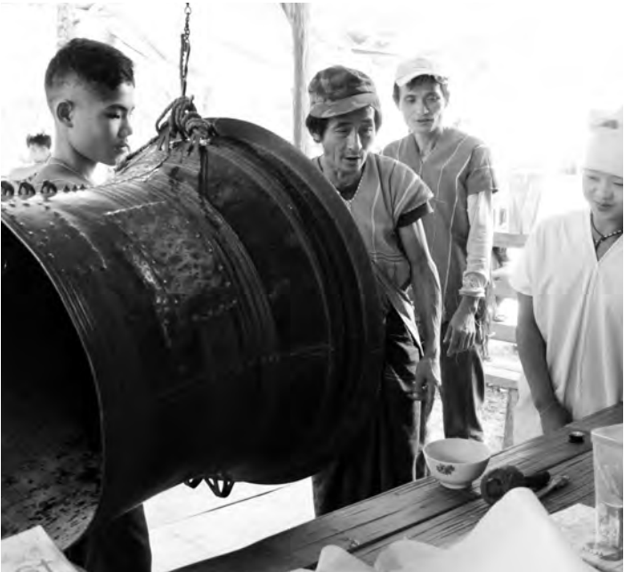
ပူထူလံာ်ဖိတဖဉ်အိန်ဒီးတၢ်ခွဲးတၢ်ယၢ်လၢတၢ်စ့တၢ်နာ်ဒီးတၢ်စိာ်စိာ်ထီဉ်ကွၢ်တၢ်ဆဲးတၢ်လၢ၊ တၢ်ဂီၤ-ခ့စၢ်