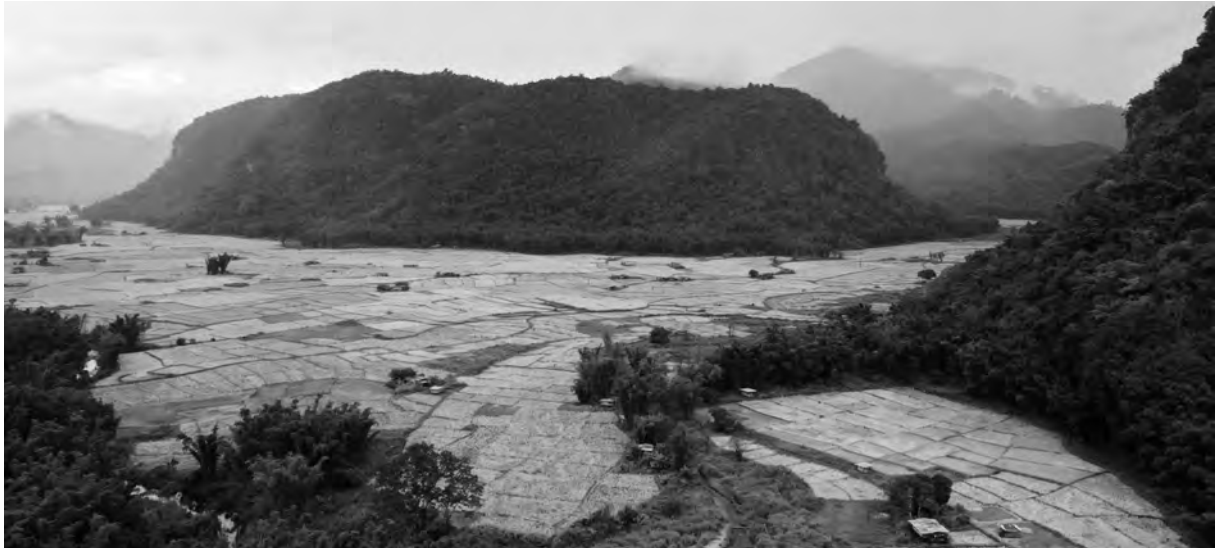
ပှထူလံဖိတဖှ်အိဉ်ဒီးတံးခွဲးတံးယံာ်လံာ်တံးန့ၢ်ပာဘဉ်ဟီဉ်ခိဉ်ကပံာ်, ထံ, သုဉ်ပှာ ပှထူလံဖိလီၢ်ကျဲးလံာ်သဘျူအပှာ, တံးဂီၤ-ခုစဲာ်

ဘီမုာ်စာဖျိဉ်ကရၢအလံာ်ဘိးဘဉ်သါလီၤအကူာ် (၈) ဟ်ဖျါထီဉ်ဝဲဘဉ်ယးဒီးတံးဒုးလိဉ်ထီဉ်ဖးထီဉ်က့ၤလံာ်ဘိးဘဉ်သါလီၤလၢပှထူလံဖိခွဲးယံာ်တဘျုးအံၤန့ၢ်လီၤ. ထံကီၢ်ပဒိဉ်တဖှ်လၢတံးကူာ်လိဉ်တၢ်ပီဉ်ဒီးတံးဟ်ဖျိဉ်မၤသကိးတံးတပှာလီၤဒီးပှထူလံဖိသုဉ်တဖှ်အဖီခိဉ်, အဝဲသုဉ်ကဘဉ်ဟ်လီၤတံးမၤရဲဉ်ကျဲးဒီးတံးမၤအကျိၤအကျဲးလၢအကြးအဘဉ် လၢတံးကွဲးဒုးအိဉ်ထီဉ်တံးသိဉ်တံးသီ လၢတံးမၤလၢပှထူထီဉ်ပှထူလံဖိခွဲးယံာ်, ဒီးအိဉ်ဒီးတံးခွဲးတံးယံာ်လၢတံးဒီးန့ၢ်ဘဉ်ကျိဉ်စ့ဒီးပီညါအကျိၤအကျဲးတံးဆိဉ်ထွဲမၤစၢလၢပဒိဉ်ပပှာဒီးထံဂုၤကီၢ်ကသုဉ်တဖှ်လီၤ. ဒ်န့ၢ်အသိး ပှထူလံဖိသုဉ်တဖှ်အိဉ်ဒီးတံးခွဲးတံးယံာ်လၢလၢပှထူလံဖိခွဲးယံာ်န့ၢ်ဘဉ်တံးယုဉ်လီၤဘျါလီၤတံးသဘဉ်သဘျုး ဒီးတံးဂုၤလိာ်ဘျီလိာ်လၢအအိဉ်ဒီးတံးတီၤဖါအိဉ်မးဒီးလၢအတီၤအတြၢ် ဖဲထံကီၢ်ပဒိဉ်ပပှာဒီးကရၢကရၢသုဉ်တဖှ်မုာ်လုာ်သုဉ်ခါပတ်, မၤဟးဂီၤဒီးတယူးယိဉ်ဟ်ကဲအဝဲသုဉ်တံးခွဲးတံးယံာ်အဆၢကတီၢ်, ဒီးဒီးန့ၢ်ဘဉ်တံးဆိဉ်ထွဲမၤစၢလၢဘီမုာ်စာဖျိဉ်ကရၢဒီးပဒိဉ်ပပှာကရၢသုဉ်တဖှ်တကးဘဉ်ဘီမုာ်စာဖျိဉ်ကရၢအပှာဟ့ဉ်ကူာ်တဖှ်ကဘဉ်စိာ်ကဖီထီဉ်, ဟ်ကဲ, ဒီးဆိးကါလံာ်ဘိးဘဉ်သါလီၤတဘျုးအံၤတုၤလီၤတီၤလီၤန့ၢ်လီၤ.