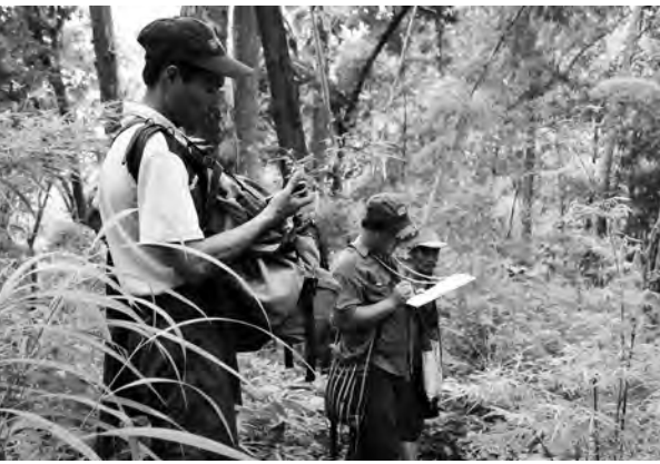
ဝဲတံလီမတံဃုသုဉ်ညါဆဉ်ဖိကီဖိဒီးတံမတံလပပုထုလံဖိ အဟီဉ်ကဝီပုအဆကတံ, တံဂီ-ခွဲး