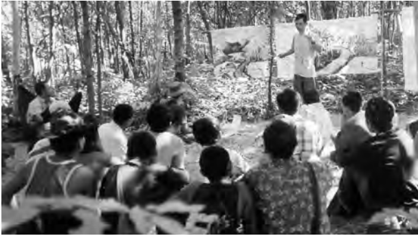
တၢ်ဟ့ၣ်တၢ်သ့ၣ်ညါန့ၣ်ဟံၣ်ဘၣ်ထွဲတၢ်ဒုးအိၣ်ထီၣ် ပှၤတၢ်သ့ၣ်ပှၤလၢကီၢ်ရၢၣ်တဘျီတဘျီတဘျီ. တၢ်ဂီၤ-ခ့ၣ်