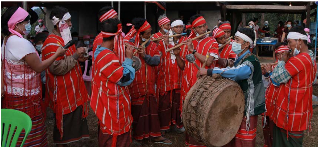
ကဲဘါကညီထူလံဖိတံဒုတံအုတံဆဲးတလး, တံဂီ-ကဲဘါ Affair