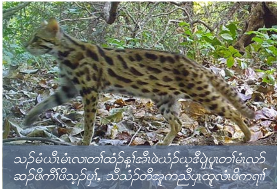
သၣ်မံပဟီၤမံလၢတၢ်ထံၣ်န့ၢ်အီၤဖဲပံၣ်ယုဒီပျဲပူတၢ်မံလၢဆၣ်ဖိကီၢ်ဖိသွန်ပွၢ်. သီသံတီအူကညီပူထူလံဖိကရား