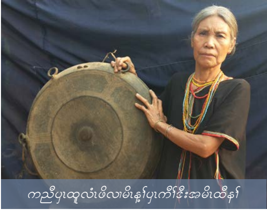
ကညီပုထူလံဖိလမိန့်ပုကီဒီးအမိထီနီ