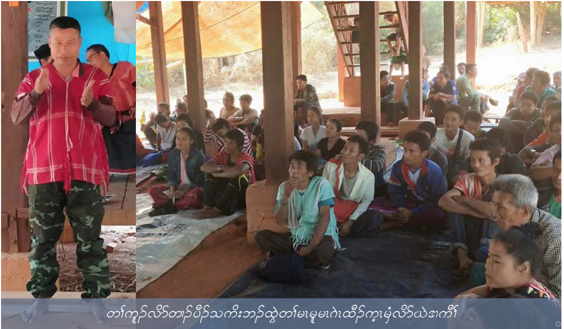
တၢ်ကူၢ်လိာ်တၢ်ပိာ်သကိးဘၣ်ထွဲတၢ်မၤမုၤတၢ်ထီၣ်က့ၢ်မ့ၢ်လိာ်ယဲၤအဂီၢ်