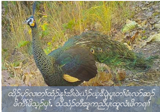
ထီၣ်ပုၤလၢတၢ်ထံၣ်န့ၢ်အီၤဖဲပံၣ်ယုဒီပျဲပူတၢ်မံလၢဆၣ်ဖိကီၢ်ဖိသွန်ပွၢ်. သီသံတီအူကညီပူထူလံဖိကရား

စါတဲစါအလီၢ်အကျဲသွန်တဖၣ်လၢကညီပူထူလံဖိသွန်တဖၣ်အဂီၢ်န့ၢ်လီၤ. နတၢ်ဆဲးတၢ်လၢအတၢ်ပနီၣ်ဒီးတၢ်အရူဒိၣ်တခါအသိး, လဲလိာ်, ကဲလိာ်, ဒီးဘဲသီလိာ်ကျိသွန်တဖၣ်အံၤ မ့ၢ်ထံကျိထံကွၢ်သွန်တဖၣ်လၢအဟဲယုၤလီၤလၢကရၢ်ပူအံၤန့ၢ်လီၤ. တၢ်မံလၢဆၣ်ဖိကီၢ်ဖိဒ်အမ့ၢ်ဘီၣ်သိၣ်, တၢ်ဘီနၢၤ, မဲးတဲးလဲးမံၤ, ကျိမံၤ, ပနၢ်မံၤ, တၢ်ဟံပဇဲ, ထီၣ်အကလုာ်ကလုာ်သွန်တဖၣ်ဘၣ်တၢ်ထံၣ်န့ၢ်အီၤဖဲတီအူကီၢ်ရၣ်ပူန့ၢ်လီၤ.