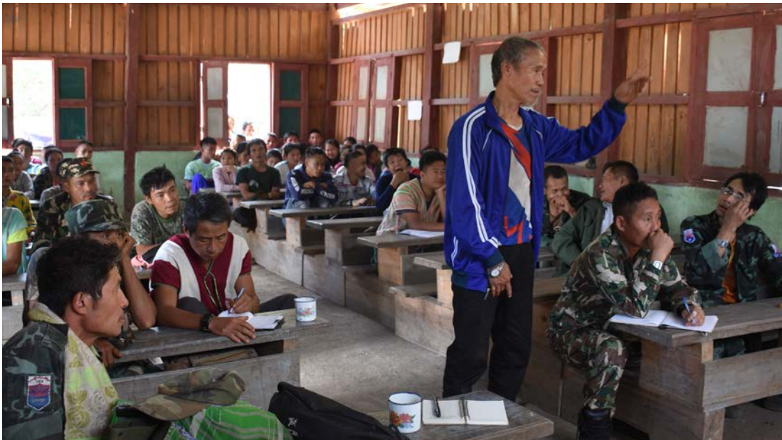
တၢ်ကူၣ်လိာ်တၢ်ပိၣ်သကိးဘၣ်ထွဲတၢ်ကပံၣ်နီၣ်က့ၤသိသံၣ်တီၢ်အူဒီးပိၣ်လိာ်တၢ်မုၢ်တၢ်ခ့ၣ်ကရၢၤအဆၢသလီ

ကညီပုၤထူလံၤဖိသ့ၣ်တဖၣ် မ့ၢ်ဒ်လဲၣ်ပုၤလၢအပၤဆၢရဲၣ်ကျဲၤဟီၣ်ခိၣ်ကပံၣ်ဒီးန့ၣ်ဆၢၣ်တၢ် အိၣ်ယၢၤဖဲယုၣ်ကတၢ်မၤကျဲၤအသိးတဘျုးစိးဒ်ကယၢ်, တၢ်ဘျုးဒီးကံၢ်ခိၣ်ထံးတၢ်သိၣ်တၢ်သီမိၢ်ပုၤ လၢအဝဲသ့ၣ်ဆိးကါအီၤဒီးဒုးလိၣ်ထီၣ်ဖးထီၣ်အီၤသ့ၣ်တဖၣ် တအိၣ်ကွဲးဟံၣ်လီၤအသးလီၤတံၢ်လီၤဆဲး ဒီးဘၣ်န့ၣ်လီၤ. လၢတၢ်န့ၣ်အယိ, ဒ်သိးသိသံၣ်တီၢ်အူပုၤထူလံၤဖိကရၢၤပၤဆၢတၢ်ကမံးတံၢ်ကသ့ပၤဆၢဒီး အံးထွဲကွၢ်ထွဲက့ၤတၢ်ဖဲတၢ်မၤအလုၢ်အလၢ ဒီးတၢ်သိၣ်တၢ်သီတၢ်ဘျုးလၢဟီၣ်ကပီၤတခါစုၣ်စုၣ်ကသ့ အဂီၢ် တၢ်ဟူးတၢ်ဂဲၤဖဲအမ့ၢ်တၢ်မၤနီၣ်မၤသါက့ၤလီၢ်ကပီၤပုၤတၢ်တၢ်သိၣ်တၢ်သီတၢ်ဘျုးသ့ၣ်တဖၣ်တၢ် စးထီၣ်မၤတၢ်အီၤလံၤန့ၣ်လီၤ.