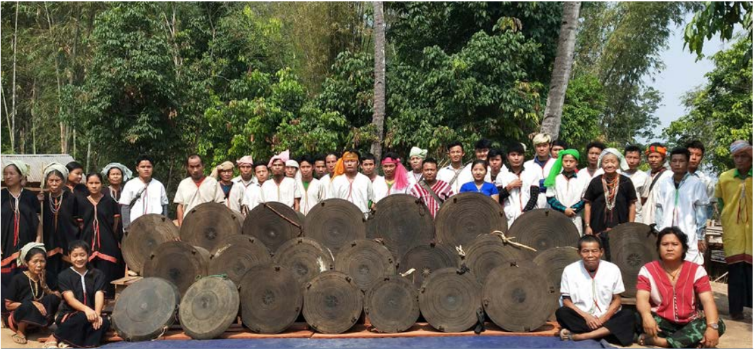
ကညီပုထူလံဖိမိန့်ပုကီ ဒီးသကိးတါဂီဒီးအဝဲသုဉ်အကျိဉ်ဒီးမိထီနီ

ပုထူလံဖိကရုာ်အပုလီဆီဒုဉ်တါ ထီတထုဉ်ကီဆဉ်ဟီဉ်ကဝါ ကျိဉ်အနီဉ်ဂံဉ်နီဉ်ဒူး လတါထာန့ဉ် စရီတဖဉ်အိဉ်ဝဲ (၁၂၆) ဒုဒီးမ့မ့မိထီနီအိဉ်ဝဲဒုဉ် (၁၀) ဒုန့ဉ်လီၤ. လန့ဉ်အမဲဉ်ညါ, ဟီဉ်ကဝါတါလီတါကျဲအါတါဖဲသိသံဉ်တီအူပုထူလံဖိကရုာ်ပုသုဉ်တဖဉ်အဲဘဉ်တါပဆုရဲဉ်ကျဲအီဒ်မိလုာ်ပုလါကီတါမကျဲသနူအိဉ်ဝဲအသိး, ဒီးတါပတါပြဲဒီးတါမတါဆာတ်အကွါအဂီသုဉ်တဖဉ်အိဉ်ဝဲဘူးထီယာ်အသးလပုတဝါအတါပလုာ်ပဉ်ပုတမံဉ်ဒီးတါကဟုကယာ်ရဲဉ်သဲကတီကျဲန့ဆဉ်တါအိဉ်ယါအဖီခိဉ်န့ဉ်လီၤ.