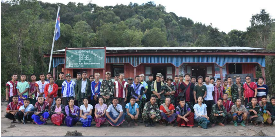
တၢ်ကူၣ်လိာ်တၢ်ပိၣ်ဘၣ်ထွဲတၢ်ဒုးအိၣ်ထီၣ်ကျဲၣ်ထၣ်ပုၤတၢ်သ့ၣ်ပုၤ

လၢတၢ်ကဒုးလိၣ်ထီၣ်ဖးထီၣ်က့ၤသီသံၣ်တီ အူပုၤထူလံၤဖိကရၢၢ်အတၢ်ထံၣ်စိအဂီၢ် တၢ်ဟူးတၢ် ဂဲၤလၢတၢ်ကဘၣ်မၤအိၣ်သ့ၣ်တဖၣ်အိၣ်ဒီးဝဲဒၣ် အါမးန့ၣ်လီၤ. လၢစုလီၤယုၣ်တၢ်ဟံၣ်ဖျိၣ်မၤသကိး တၢ်တပူၤပီၤအပူၤ, တၢ်ဟူးတၢ်ဂဲၤ မ့ၢ်တမ့ၢ် ခိၣ်ခါ အခိၣ်သ့ၣ် (၅) ခါလၢတၢ်ကမၤဖျါထီၣ်အမိၢ်လံၢ် မိၢ်ပုၤသ့ၣ်တဖၣ်မ့ၢ်ဒ်လၢာ်အံၤအသိးန့ၣ်လီၤ.