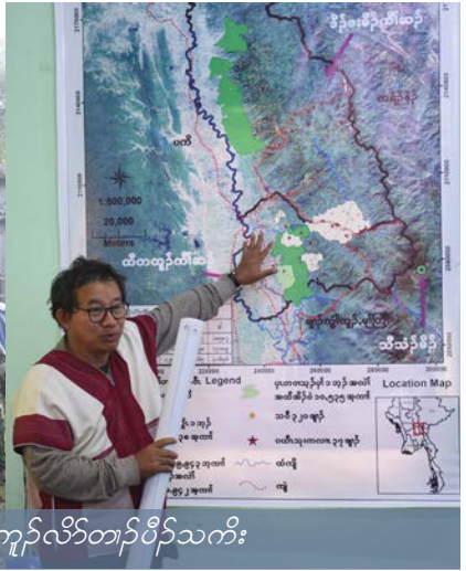
တၢ်မၤမူထီၣ်ဂၤထီၣ်ကၤမ့ၢ်လီၤလဲၤအပူၤထူလံၤဖိကီၢ်တၢ်ကူၣ်လိာ်တၢ်ပိာ်သးကိး