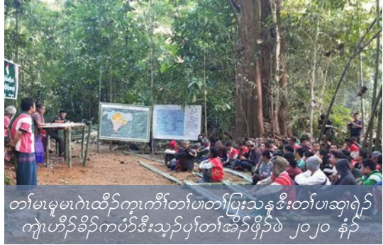
တၢ်မၤမူမၤဂဲၤထီၣ်က့ၤကီၢ်တၢ်ပၤတၢ်ပြးသန့ဒီးတၢ်ပၤဆုၤရဲၣ် ကျဲၤဟီၣ်ခိၣ်ကပံာ်ဒီးသ့ၣ်ပုၤတၢ်အိၣ်ဖျိၣ်ဖဲ ၂၀၂၀ နံၣ်

ဒ်ယိၣ်လိာ်တၢ်မ့ၢ်တၢ်ခ့ၣ်ကရၢၢ်တၢ်လဲၤ ခိဖျိအသိး, လၢတၢ်ဒုးလိၣ်ထီၣ်ဖးထီၣ်က့ၤသီသံၣ် တီအူပုၤထူလံၤဖိကရၢၢ်အတၢ်ထံၣ်စိအဂီၢ်, ပုၤအါ ဒ်အါဂၤလဲၤလိာ်ပၣ်ယုၣ်ဝဲဒၣ်န့ၣ်လီၤ. လၢသီသံၣ် တီအူပုၤထူလံၤဖိကရၢၢ်ကမံးတံာ်ရဲၣ်ကျဲၤတၢ် (၂၉) ဂၤလၢအဘၣ်တၢ်ဒုးအိၣ်ထီၣ်အိၣ်လဲၤလဲၤပထုဘၣ် (၂၀၁၉) နံၣ်အကျါ ပၣ်ယုၣ်စ့ၢ်ကိးဒီးခ့ၣ်အဲၣ်ယုၣ် တီအူကီၢ်ရၣ်ခိၣ်န့ၢ်, လီၢ်ကဝီၤခိၣ်န့ၢ်, ကမ့ၢ်, ဒီးပုၤပတီၢ်မ့ၢ်ဖိကရၢ (CSOs) ခၢၣ်စးသ့ၣ်တဖၣ် န့ၣ်လီၤ. ကမံးတံာ်တဖၣ်အံၤအမူဒါခိၣ်သ့ၣ်တဖၣ် မ့ၢ်ဝဲ တၢ်ကဘၣ်ကွၢ်ထွဲဒီးတၢ်ပိၣ်ရဲၣ်ကျဲၤက့ၤ တၢ်လၢတၢ်ဒုးအိၣ်ထီၣ်ဒီးတၢ်မၤဖျါထီၣ်က့ၤ ပုၤထူ လံၤဖိကရၢၢ်အတၢ်မၤမိၢ်လံၤမိၢ်ပုၤ ဒီးတၢ်ဟူးတၢ်ဂဲၤ သ့ၣ်တဖၣ်န့ၣ်လီၤ. ခါဆူညါန့ၣ်, သီသံၣ်တီအူ ပုၤထူလံၤဖိကရၢၢ်အံၤတၢ်ကဘၣ်ပၤဆုၤအိၣ်လၢဘျီၣ် ဒိၣ်တၢ်အိၣ်ဖျိၣ် (General Assembly) ဒီးဘျီၣ် ဒိၣ်ကရၢဖိသ့ၣ်တဖၣ်ကမ့ၢ်ဝဲပုၤတၢ်, ခ့ၣ်အဲၣ်