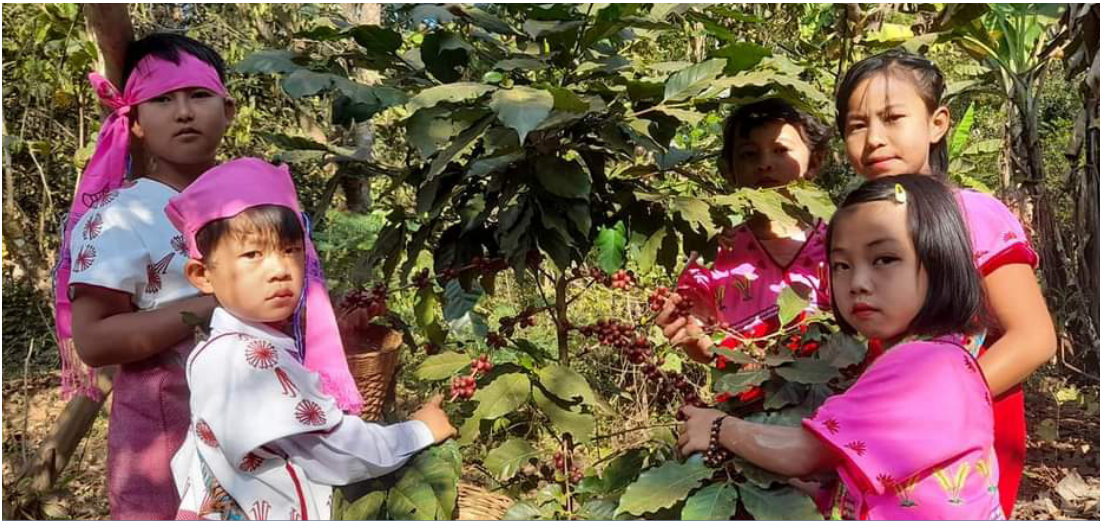
ကလေးကညီထူလံးဖိဒီးတၢ်ကတၢ်သးတဖၣ်, တၢ်ဂီၤ-ကလေး Affair