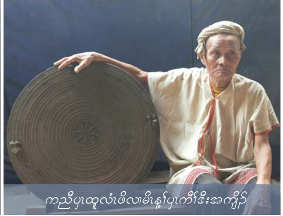
ကညီပုထူလံဖိလမိန့်ပုကီဒီးအကျိန်

ကညီပုထူလံဖိလမိန့်အစဉ်ဆိးဖဲသိသံဉ် တီအူပုထူလံဖိကရုာ်ပုသုဉ်တဖဉ် ဟ်ကဖာလသးဒိဉ်မးလအဝဲသုဉ်စိဉ်မူစိဉ်ဂဲ ဒီးဟံးယာ်ဟယာ်ဘဉ်ဒီးအလုာ်လုာ်ထုသနူဒီးတါဆဲးတါလသုဉ်တဖဉ်န့ဉ်လီၤ. တါဆဲးတါလဒီးတါဘူဉ်တါဘါတါမလုာ်လုာ်သုဉ်တဖဉ် မ့တါအရူဒိဉ်နီဉ် မးလကညီပုထူလံဖိအဒုဉ်အထာ န်အမ့ကညီဝါ, ကဲဘါ, ပကူ, ပကူမိန့်ပု, ပကူတလပု (စါလါပု), မိပု ဘဲ, ဒီးကယီလအစဉ်ဆိးဖဲသိသံဉ်တီအူပုထူလံဖိသုဉ်တဖဉ်အဂီဉ်န့ဉ်လီၤ. န်တါယုသုဉ်ညါဒီးတါမနီဉ်မယါတခါအစပဉ်ဖျါဝဲအသိး, ထဲဒုဉ်လသိသံဉ်တီအူ