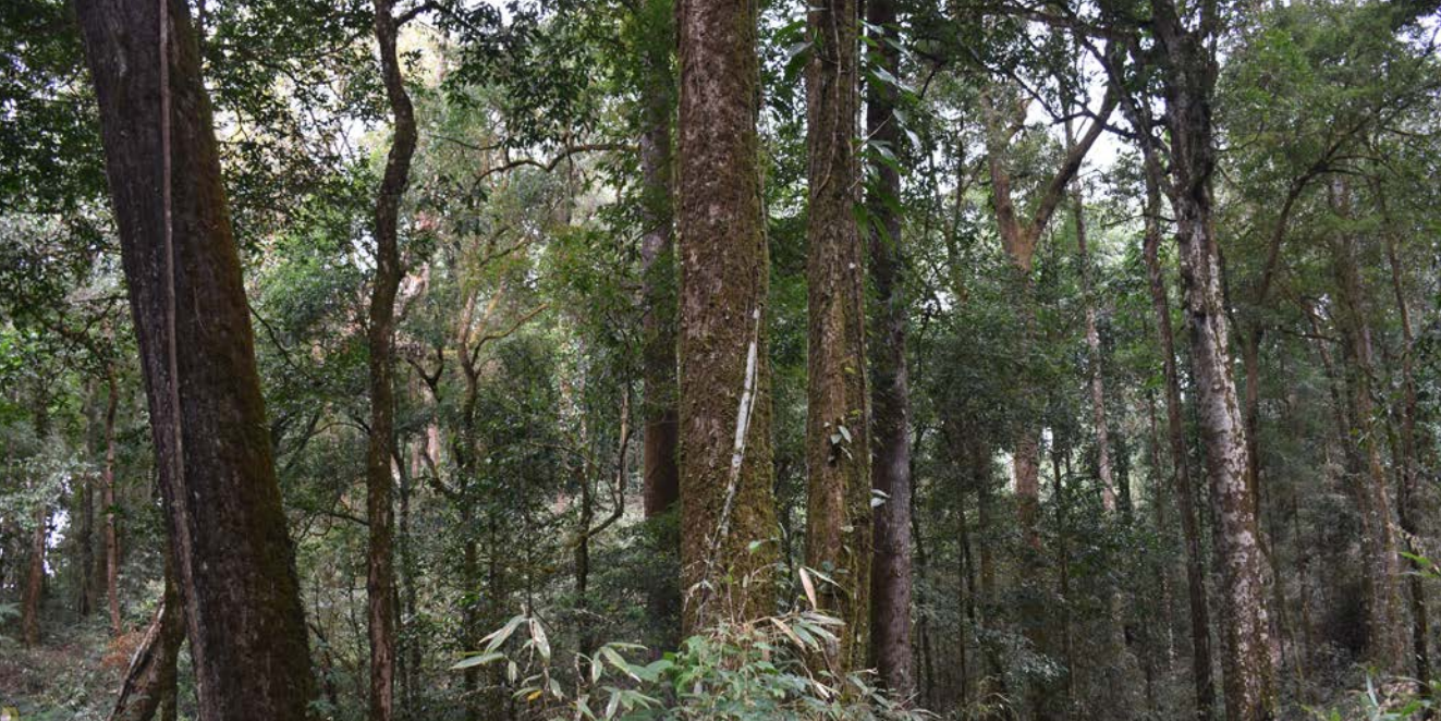
သွန်ပွားထူလံလောအအိပ်ပဲသီသံတီအူပူထူလံဖိကရားပူ