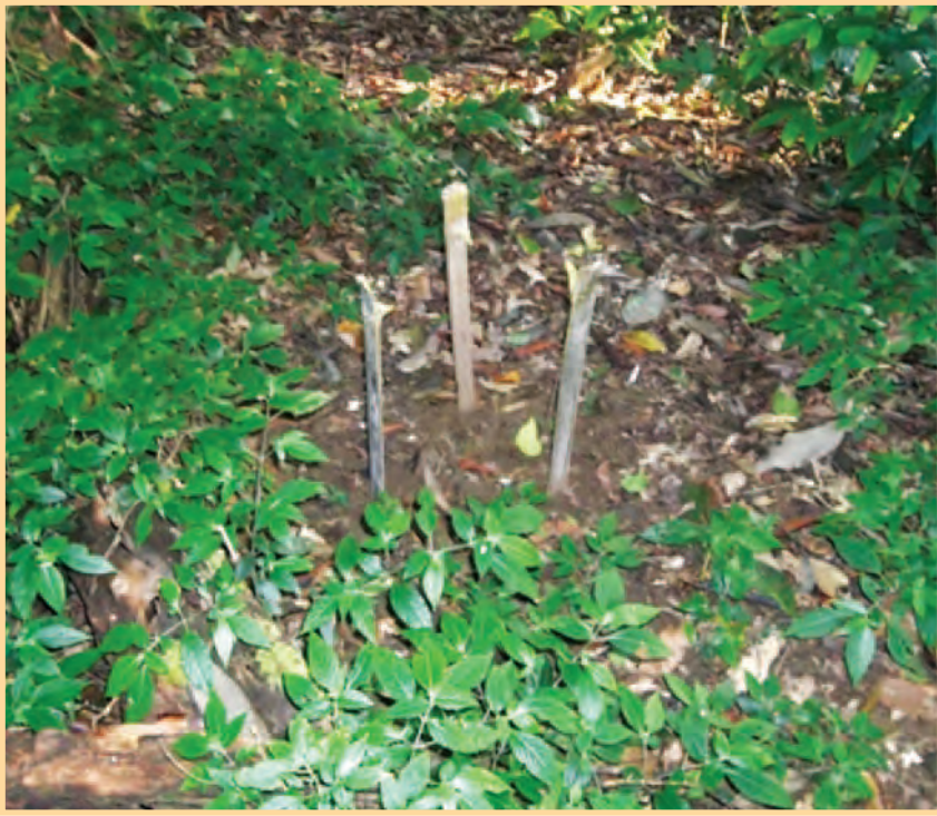
တၢ်မၤနီၣ်ဃၢ်ဟီၣ်လၢ်မ့ၣ်ပီၤအိၣ်အလီၤလၢအဘူးဒီး KMWS ကီၢ်ဆၢအကလံၤထံးတကမၤ

အိၣ်လီၤဆိးဒၣ်ဝဲ, ဒီးဖဲန့ၣ်တၢ်ဟးခး အိၣ်တၢ်အတၢ်ဟူးတၢ်ဂၢၤတဖၣ် ဇုၤလီၤ ကွံာ်ဝဲဒၣ်န့ၣ်လီၤ.