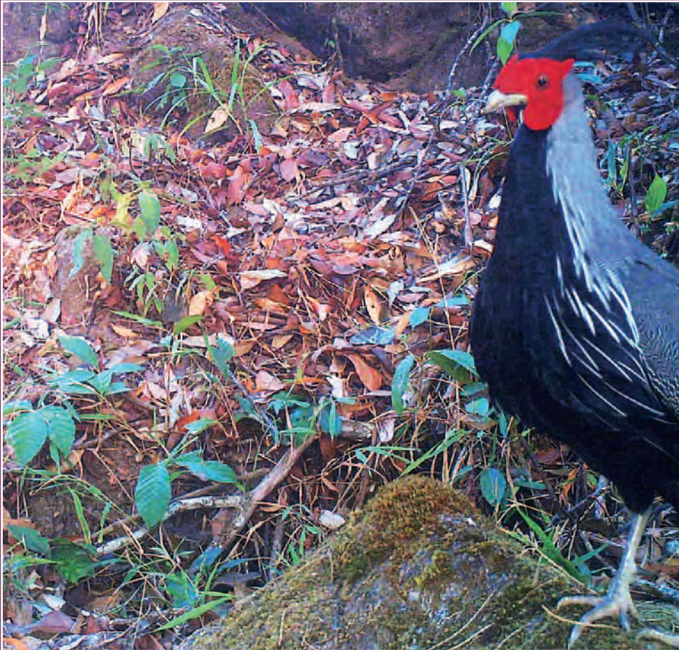
ထီၣ်ဂံၢ်အဂီၢ်, တၢ်ဒီးန့ၣ်အီၤလၢခဲမရၢ ဖဲက့ၣ်ဒိၣ်မဲးညီပျံၤဆၢၣ်ဖိကီၢ်ဖိမံၤလၢသ့ၣ်ပုၤပျံၤကွီၤ