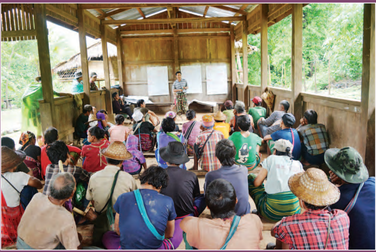
တံမသဝီတံတၚ်ပီၚ်တဲက့ၚီသကီးတံၚ် ၂၀၁၆ အပူ

က့ဒိၚ်မဲးညီပုတတတဖန် ဟံဖိၚ်ထီၚ်အသးဒီး KFD ဒီး KWCI လအတံဒုးအိၚ်ထီၚ်ပျံပူၚ်ဆၚ်ဖိကီၚ်ဖိသ့ညီပျံ ပျံက့ၚီ, ဒီးန့လီပၚ်ယုတ်လအတံဒုးအိၚ်ထီၚ်တံသိၚ်တံသီဒီး တံဘျာသဲစးတဖန်လအဘၚ်ထွဲဒီး တံစူးကါသ့ညီ ပျံတံအိၚ်ယံတဖန်အပူန့လီ။ စးထီၚ်လလါအီးကထီဘၚ် ၂၉ သီ တုလလါ လါနီၚ်ဝုဘၚ် ၆ သီ, ၂၀၁၆ န့ၚ်,