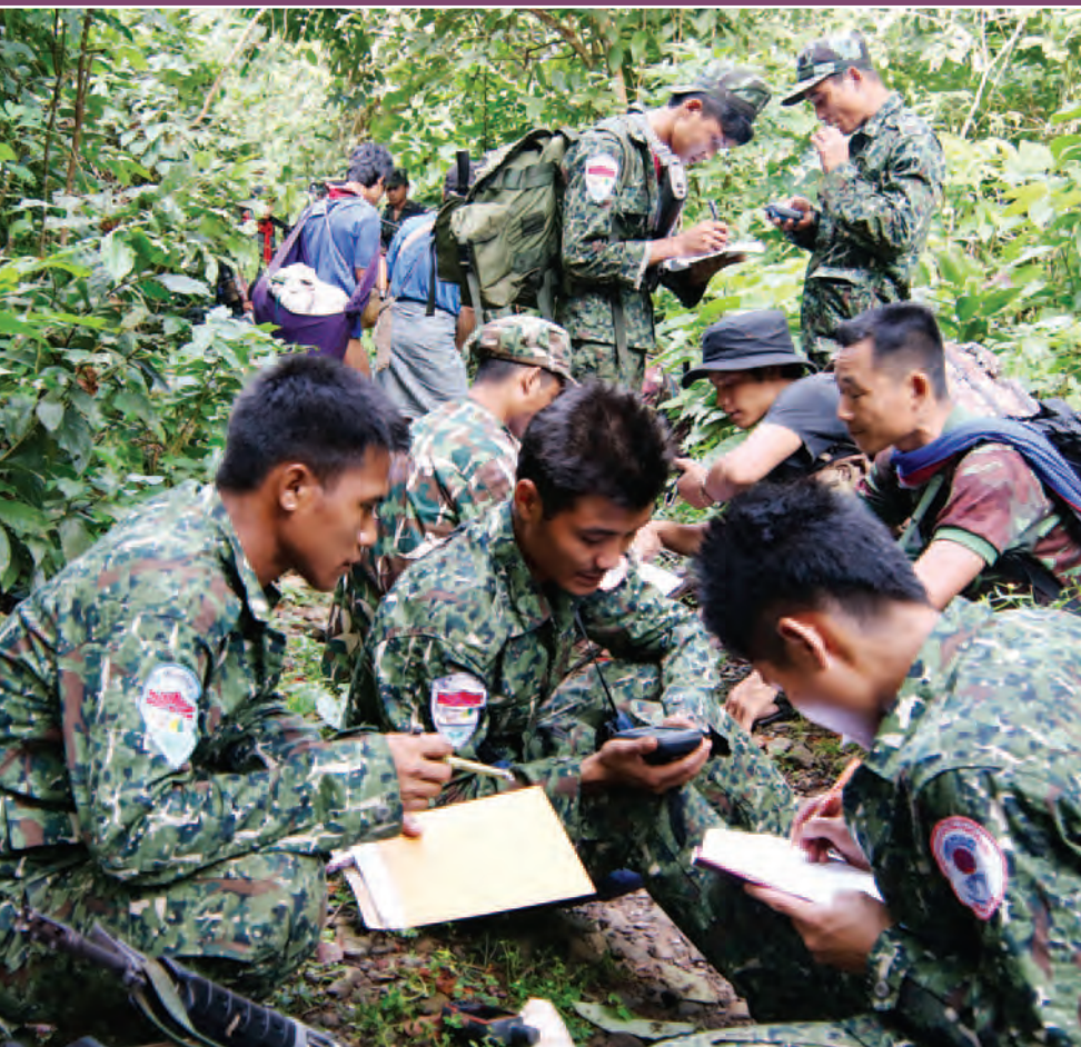
WPU မနီဉ်မဲလဲတာ်ဂ့ၢ်တာ်ကျိထာ်ဖိဉ်ပဲ KMWS အပူ