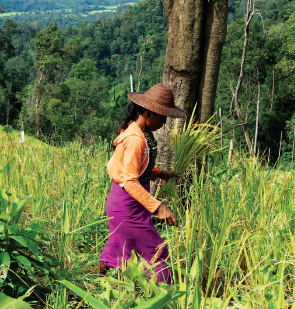
သဝီဖိဖဲကုဒိပ်မဲးညီပျဲပုဆောင်ဖိကိမ်မဲလင်သုဉ်ပျဲပုကွီ KMWS အကပိကပတဖဉ် မဲဖဲဒဉ် တာ်သုဉ်ပျဲဖျဲလဲအလဲတရဲးသးတကတီာ်ဘဉ်တကတီာ်