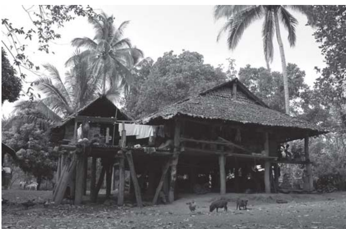
မိခံသဝီမ့ၢ်သဝီအိၣ်ထုအိၣ်လံၤတဖျၢၣ် ဘၣ်ဆၣ်တၢ်အိၣ်သးခဲအံၤမၤပျံၤမၤဖုးအီၤဘၣ်သး တၢ်ကခူၣ်လၢၢ်လၢအသဝီဆၢခိၣ်ထံခံတဖၣ်အယိန့ၣ်လီၤ.

ဒဲလဲၣ်ဂုၤဂုၤ မိခံသဝီဖိတဂၤစံးဝဲ “ယတဘၣ်သး လၢပုၤကခူၣ်လၢၢ်န့ၣ်ကု ပုၤခိၣ်ပုၤန့ၣ်လၢထးမ့ၢ်ဟ့ၣ်အခွဲး န့ၣ် ပမ့ၢ်သဝီဖိပမၤတၢ်တသ့နီတမံၤဘၣ်.” ■