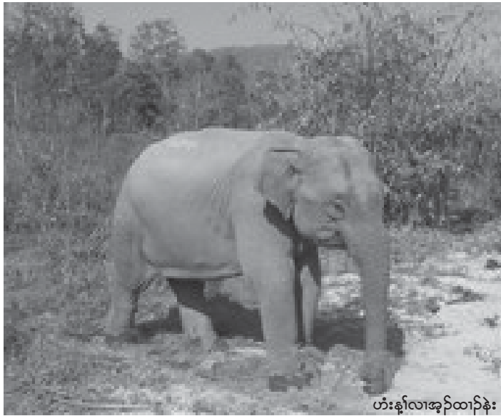
ဟံးန့ၢ်လၢအုၣ်ထၢၣ်န့း

သရၣ်မိၣ်စ့ၣ်စံးကဒီးဝဲလၢ တချုးဒံးလၢကဆိမံး တဖုအံၤဟဲလီၤဘၣ်န့ၣ် သီခါတပါမံမိာ်ဝဲလၢကဆိတ ဖုအံၤအိၣ်ဒီးအကစၢတဂၤ ဒီးအကစၢအံၤစံးဘၣ်အီ လၢတၢ်မံမိာ်အပူ လၢသါကဆိတဖုအံၤအိၣ်လၢပကိရီ မၣ်ကစၢတုၢ်အံၤမ့ၢ်လၢပှ်က့ၢ်လီၤသ့ၣ်ဝဲလီၤပျီလၢာ်လံ , ပှ်မၤပျီစ့ၢ်ကိးတၢ်လီၢ်တၢ်ကျဲလၢတၢ်ကမၤထံတမၢ် ဒီးထံဘီတဖှ်အယိ, တၢ်ပျီလဲၢ်ပျီထီဒီးသါကဆိတဖှ် ကအိၣ်ဆိးအဂီၢ်တၢ်လီၢ်တအိၣ်လၢဘၣ်, ကအိၣ်ဆၣ် အဂီၢ်အဆၣ်အိၣ်တအိၣ်လၢစ့ၢ်ကိးဘၣ်. လၢတၢ်န့ၣ် အယိသါကပျဲလဲလီၤအီဆူပျီပူလၢကအိၣ်ဘၣ်အဆၣ် အဂီၢ်န့ၣ်လီၤ. လၢတၢ်န့ၣ်အယိဝဲဘၣ်ဖုဖိသဝီဖိလၢ ကပျဲဒုးအိၣ်စ့ၢ်ကိးအဆၣ်လၢအကြးဒီးယုကညးဝဲ လၢ တဘၣ်မၤအမၤသီကိကဆိတဖှ်အံၤတဂ့ၤန့ၣ် သီခါတ