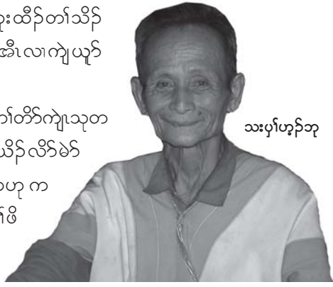
သးပျံၤဟ့ၣ်ဘု

မ့ၢ်လၢထံတမာ်တၢ်တိာ်ကျဲလၢကတဲာ် ထီၣ်တဂ့ၢ်အဂီၢ်န့ၣ် ယိၣ်လိာ်မဲၣ် ချံၤက ရုၢ်, ကညီတၢ်ကဟု က ယာ်ထံကျိကရၢပျံၤမၤတၢ်ဖိ တဖၣ်အိၣ်သကိးတၢ် ဝီၣ်ဒီးငူဖိသဝီဖိ, ဃု