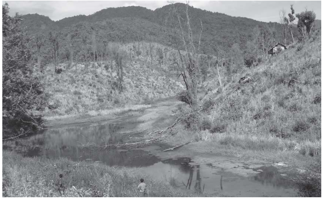
မ့တမ့ၢ်လၢဒူဖိသဝီ ဖိဘၣ်စံၣ်ပယီၤသုး ဘၣ်န့ၣ် အဝဲသ့ၣ် လဲၤဖိၣ်အိၣ်ဝဲဒုၣ်ဘီ ဆုဖဲဘီဆုခိၣ်ကိး နံၣ်ဒဲးန့ၣ်လီၤ.

လၢတၢ်န့ၣ်အယီၤ “ဘီဆုခိၣ်” တဘျီဒုးသုၣ်ဒု သးခုဝဲကညီ ပုၤထူလံၤဖိသ့ၣ်တဖၣ် ဘၣ်ဆၣ်ခဲအံၤ ဘၣ်အိၣ်သယုၢ်အိၣ်လီၤဖးကွံာ်ဝဲဒုၣ်လီၤ. သဝီဖိဖဲန့ၣ် တဂၤစံးဝဲ “ပမုၢ်လၢဝဲသပျီၢ်ပျီၢ်လၢ ပယီၤသုးမိၤစီရိၤတ ဖၣ်ကက့ၤလီၤက့ၤဆုအုအုၣ်လၢအဆိအချွဒီးပက က့ၤသးဖွံၣ်ဘၣ်က့ၤလၢဘီဆုခိၣ်” န့ၣ်လီၤ. ■