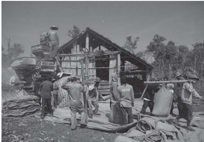
ပုၤမၤဘုခုကျိးအါဂၤ မၤလဲၤထီၣ်အဘုခုကျိးဘဉ်ဆဉ်အဘုခုအကံလိတန့ၣ်အါထီၣ်ဘဉ် မ့ၢ်လၢ ကီၣ်တဲာ်သ့ၣ်ခိၣ်လၢအလဲၤဟံလီၢ်ဝဲအစုတၢ် မၤဆူၣ်ထီၣ်ကံလိစပြုအယံန့ၣ် လီၤ.

သဝီဖိတၢ်စံးဝဲ “ပမၤတၢ်ဒိတနံၣ်ဘဉ်ဆဉ်အမ့း တအိၣ်ဘဉ်, မ့ၢ်လၢပဖိၣ်သ့ၣ်ခိၣ်အယံ သ့ၣ်ခိၣ်ဟ့ၣ်ပုၤ ဘုခုအပူၤဆဲးလီၤ.”