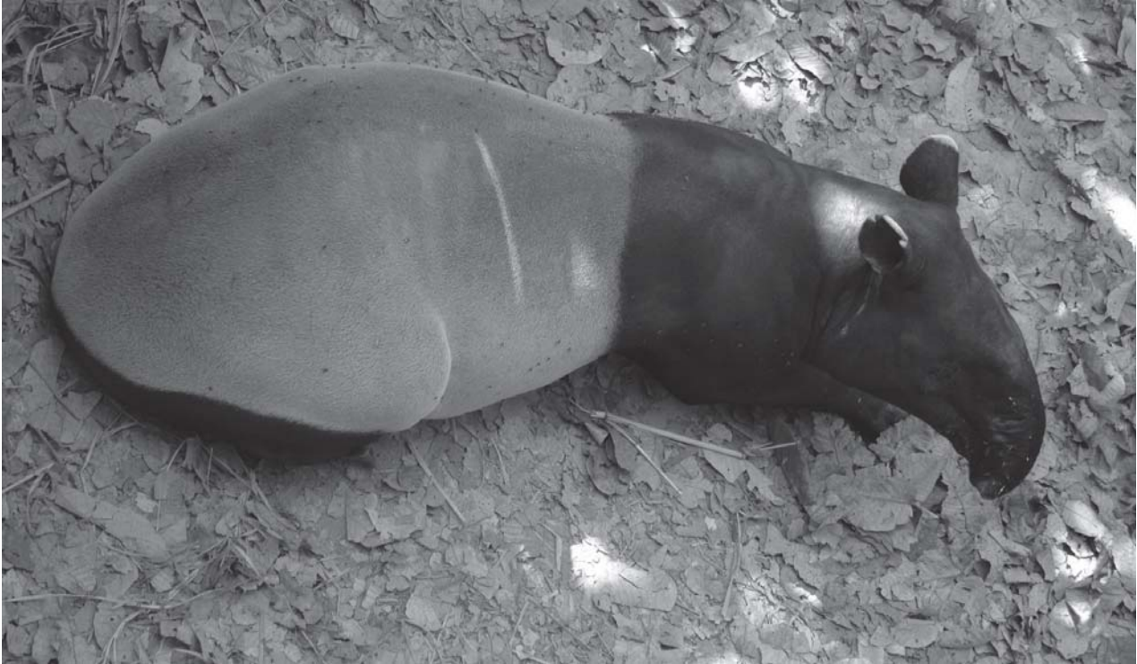
တၢ်ဒိၣ်ကွီၢ်မ့ၢ်စ့ၢ်ကီၢ်ဆၣ်ဖိကီၢ်ဖိလၢအဂ့ၢ်ထီၣ်စ့ၢ်ဒီးကီၢ်သူလုၤပဒိၣ်တြိဝဲ အိၣ်ဒီးလၢန့ၢ်ပုၣ်ယၢ်ကီၢ်ရၣ်ပှၤ, တၢ်ဂီၤ - ကံၢ်မဲတၢ်ကွီၢ်ဆၣ်ဖိကီၢ်ဖိကရၢ်

ယအဲၣ်ဒီးတဲဒ်အံၤ သ့ၣ်ပှၤဒီးအတၢ်အိၣ်ယၢၤတ ဖၣ် မ့ၢ်န့ၢ်ဆၣ်အတၢ်န့ၢ်သါလၢကီၢ်သူလုၤအဂီၢ်န့ၢ်လီၤ. မ့ၢ်ပှၤကီၢ်သူလုၤဖိခဲလၢ်အတၢ်န့ၢ်သါဒီးတၢ်ကဲဘျူးလၢ အဂီၢ်လီၤ. ဘၣ်ထွဲဒီးကီၢ်သူလုၤဖိကိးဂၤလီၤ. ကပျါ ယံလၢ ကဂ့ၢ်ဒီးကဲဘျူးလၢအယုၣ်ကၢလၢကီၢ်သူလုၤဖိ ကိးဂၤအဂီၢ် မ့ၢ်ကီၢ်သူလုၤဖိကိးဂၤအမူဒါလီၤ. ထဲကီၢ် သူလုၤသ့ၣ်ပှၤ ပှၤဘၣ်မုၢ်ဘၣ်ဒါဖိးန့ၢ် တၢ်ကဲဘျူးကဲ ဖျိၣ်ဒ်အကြးဝဲဘၣ်ဝဲအသိး ကဲထီၣ်လိာ်ထီၣ်ဝဲတန့ၢ် ဘၣ်. ပှၤကီၢ်သူလုၤဖိကိးဂၤ အနီၢ်ကစၢ်တၢ်သးအိၣ်ဟ် ဖျိၣ်မၤသကိးတၢ်လၢအသနၢ်ဒၣ်ဝဲမ့ၢ်အိၣ်ထီၣ်ဝဲလဲၣ်န့ၢ် တၢ်မၤကဲထီၣ်ဝဲလဲၣ်ဒီးတၢ်ကဲဘျူးကဲဖျိၣ်လၢတၢ်သးလီၤအီၤ န့ၢ် အိၣ်ထီၣ်ဝဲလဲၣ်န့ၢ်လီၤ. ■