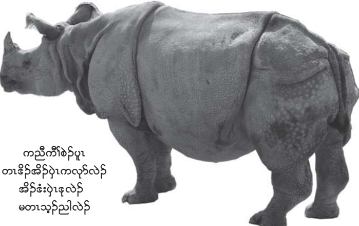
ကညီကီၢ်စဲၣ်ပျာ တၢ်ဒိၣ်အိၣ်ပျာကလုာ်လဲၣ် အိၣ်ဒီးပျာလဲၣ် မတၢ်သ့ၣ်ညါလဲၣ်

“ဒိၣ်ပျာအိၣ်ဒီးတၢ်မုာ်ဒီး တၢ်ဒိၣ်အိၣ်မိကဝီၤရဲး”