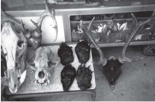
တၢ်မံလၢာ်အညၣ် န့ၣ် ပအိၣ်ဝဲဒီး အပူၤဂ့ၤလီၤ. ဘၣ်ဆၢဝဲတၢ်မၤ ကၢအိၣ်တၢ်မံလၢာ် ဒ်အံၤန့ၣ် တၢ်မံ လၢာ်လီၤတုၢ်ကွၢ် သ့လီၤ.

တၢ်မံလၢာ်ဆၢဝဲကီၢ်ဖိတဖၣ်အံၤကဲထီၣ်တၢ်ဘျူး တၢ်ဖျိၣ်လၢအဝဲသ့ၣ်ကဲကဲအဂီၢ်အိၣ်စ့ၢ်ကီးဒ်အမ့ၢ် ထီၣ်ခုၣ်, ထိးမံ, ဆိမံ န့ၣ်လီၤ. တၢ်မံလၢာ်သၢကလုာ် အံၤအိၣ်မ့ၢ်ဘၣ်ထွဲကဲဘျူးမၤစၢ်လိာ်အသးသ့ဒီးအါတ က့ၢ်ဟးပိာ်လိာ်သးအခဲလီၤ. ဘၣ်မနုၤလၢကဲဘျူးဒီး သန့ထီၣ်လိာ်အသးသ့လဲၣ်န့ၣ် ဝဲအဝဲသ့ၣ်ဟးအဆၢ ကတီၢ် မ့ၢ်ဘၣ်သၢကံၢ်ဒီးသ့ၣ်သ့ၣ်ဝၢ်သ့ၣ်ဒ်အမ့ၢ်အဘျူးက