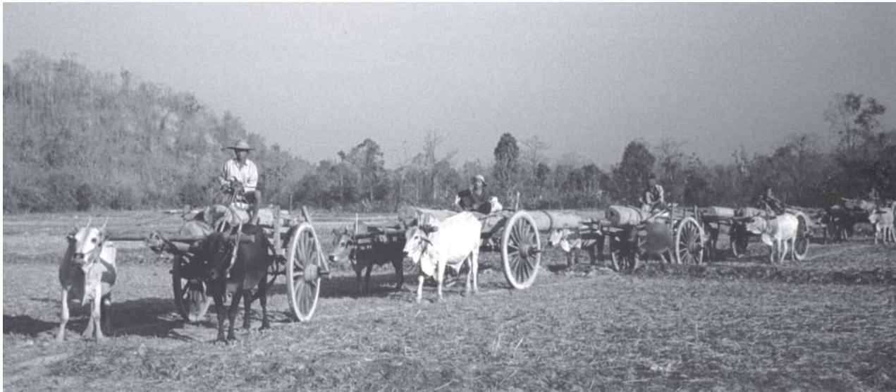
ထီတထုဉ်ကီဆဉ်ပထံးကဝီန့ဉ် အပုကွံဉ်တံမအိဉ်သုဉ်အါမးဒီးဖုဖိသဝီဖိပတ်ဖျါထီဉ်တံဂီလအမုာ် ထံနီလီသးဒိဉ်ဒိဉ်မုာ်ဖဲတံကိခါအဆာကတီ ဒီး မုာ်မဆါတနံအံ အဝဲသုဉ်ပတ်ဖျါထီဉ်ဝဲတံဂီကီအသီတမံလအ ဆုဉ်အိဉ်ဟးဂီကွံဉ်ဝဲဘုန့ဉ်လီ.

လအတံနးဒီးတံနးအဖိခိဉ်န့ဉ် တံဂီအဂတမံခီ ဖျါတံပုလီ ပသံဉ်ထံတမံအပီ လအစံဉ်ပုထုထံဂံဘါ အါထီဉ်, ထံလအစံဉ်ပုထုအိဉ်ပတ်စာတနီဒီး တမံ ထံ အါထီဉ်တနီအပီ လုာ်ဘကွံဉ်ဘုဖိဒီးဘုသံဝဲဒ်န့ဉ် လီ. တံဂီလအကွဲပတ်ဖျါထီဉ် ဆုသုလုာ်ကီလုအပု အံန့ဉ် ယတံပညိဉ်မုာ်ဒ်သိးပုဖးလံဖိတဂလံလံ ဒီး ပုဘဉ်ဒါသုဉ်တဖဉ်ကပတ်သုဉ်ပတ်သးဒီး ဟုဉ်ကုဉ် ကုပုဒ်အလီအိဉ်အသိးန့ဉ်လီ. ■