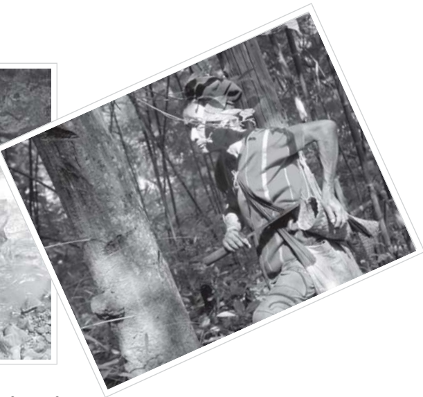
သ့ၣ်ပုၢ်တၢ်အိၣ်ယၢၤ, န့ၣ်ညါဖိသ့ၣ်တဖၣ်ကဲထီၣ်ဝဲဒၣ် တၢ်အိၣ်တၢ်အိ တၢ်မၤစၢလၢ သဝီဖိသ့ၣ်တဖၣ်အဂီၢ်