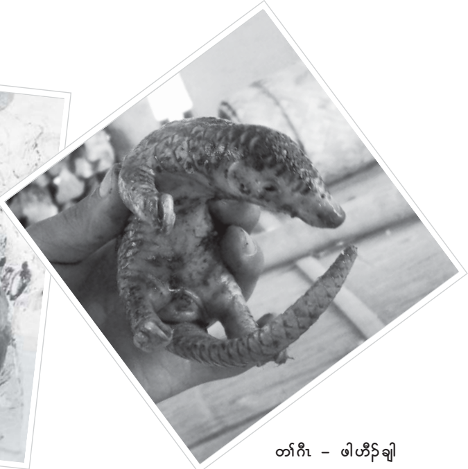
တံဂီၢ် - ဖါဟီဉ်ချါ