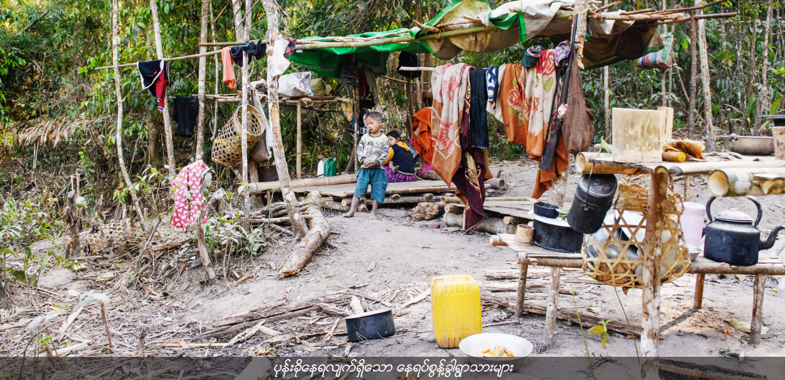
ပုန်းခိုနေရလျက်ရှိသော နေရပ်စွန့်ခွါရွာသားများ