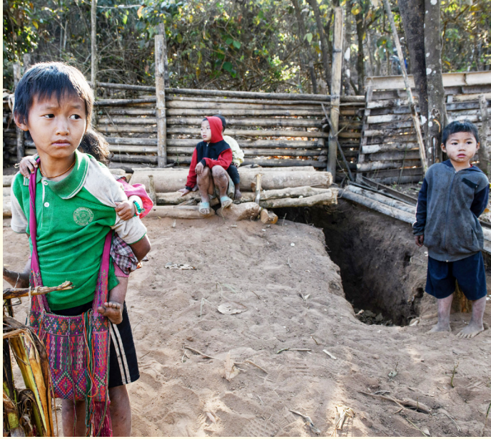
စစ်တပ်၏ အမြောက်ပစ်ခတ်မှုများမှ ကာအကွယ်ရန် ပုံးခိုကျင်းများအား အတင်းအဓွမတူးရန် ခိုင်းစေခံရသော ရှာသားများ