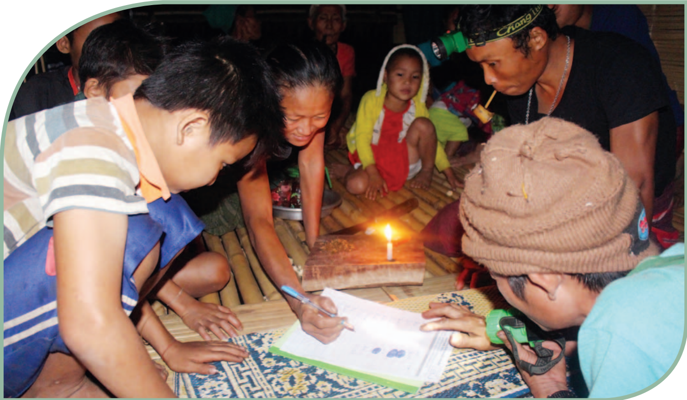
သံလွင်ငြိမ်းချမ်းရေးဥယျာဉ်အခြေခံဥပဒေမူကြမ်းအား ထောက်ခံကြောင်း အမျိုးသမီးတစ်ဦးမှ လက်မှတ်ထိုးပေးခဲ့စဉ်၊ သံလွင်ငြိမ်းချမ်းရေးဥယျာဉ်အခြေခံဥပဒေဆိုင်ရာလူထုဆန္ဒကောက်ယူခြင်း၊ ၂၀၁၈ ခုနှစ်။

အထက်ပါဆုံးဖြတ်ချက်ကိုချပြီးနောက် ၂၀၁၈ ခုနှစ်၊ ဇန်နဝါရီလမှ အောက်တိုဘာလအထိ ဆယ်လအချိန်ကာလတွင်း ဒေသလူမှုဖွံ့ဖြိုးတိုးတက်ရေးအတွက် စည်းရုံးလှုပ်ရှားသူအဖြစ် ရွေးချယ်ပျိုးထောင်တာဝန်ပေးခံရသူများက သံလွင်ငြိမ်းချမ်းရေးဥယျာဉ်အခြေခံဥပဒေမူကြမ်းနှင့်ပတ်သက်ပြီး ရွာသူရွာသားများအား ချပြရင်းပြရန်နှင့် ဤဥပဒေမူကြမ်းကိုထောက်ခံသောသူများ၏ အမည်နှင့်လက်မှတ်ကိုကောက်ယူရန်အတွက် ကျေးရွာများဆီသို့ကွင်းဆင်းသွားရောက်ခဲ့သည်။ ထိုသို့သွားရောက်ရာတွင်လည်း ၎င်းတို့မှာ စိန်ခေါ်မှုများစွာနှင့် ကြုံတွေ့ခဲ့ရသည်။ အကြီးမားဆုံးသောစိန်ခေါ်