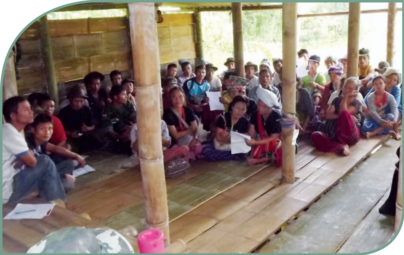
ကျေးရွာအုပ်စုအဆင့် သံလွင်ငြိမ်းချမ်းရေးဥယျာဉ်ဆိုင်ရာ အများပြည်သူနှင့်ဆွေးနွေးညှိနှိုင်းမှုအစည်းအဝေး