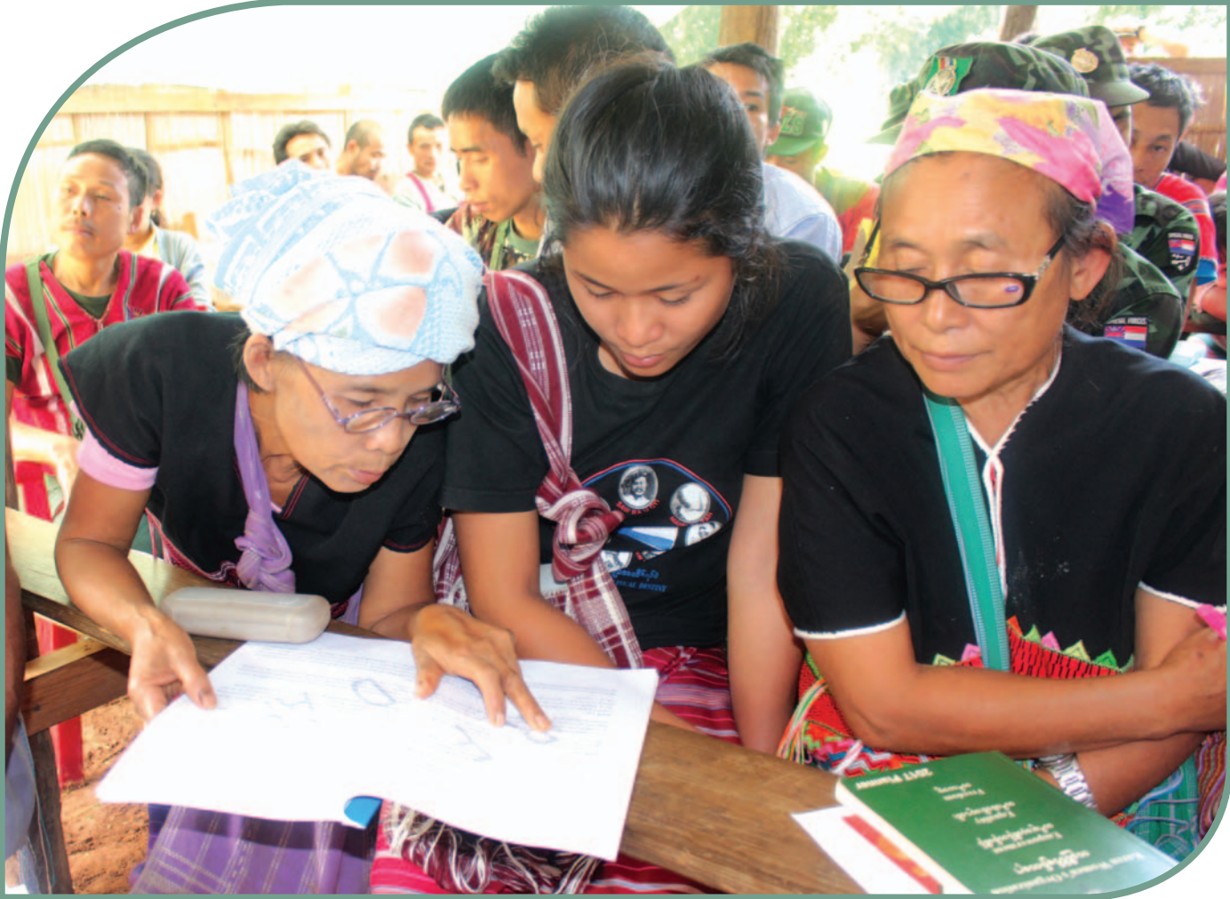
သံလွင်ငြိမ်းချမ်းရေးဥယျာဉ်ဆိုင်ရာ အများပြည်သူနှင့်ဆွေးနွေးညှိနှိုင်းမှုအစည်းအဝေးတွင် ရွာသူရွာသားများမှ သံလွင်ငြိမ်းချမ်းရေးဥယျာဉ်အခြေခံဥပဒေမူကြမ်းအား သုံးသပ်နေကြစဉ်

မည်သည့်အခြေအနေမျိုးတွင် မည်သည့်ကျင့်ဝတ်စည်းမျဉ်းများကို လိုက်နာရမည်များအပါအဝင် သက်ဆိုင်သူအား လုံးအတွက် အငြင်းပွားမှုများကို တရားမျှတစွာဖြေရှင်းပေးနိုင်စေရန် လုပ်ထုံးလုပ်နည်းများနှင့်ပတ်သက်ပြီး အသေးစိတ်ကို ငြိမ်းချမ်းရေးနှင့်တရားမျှတမှုအခန်းတွင်ဖော်ပြထားသည်။ ဥပမာ တရားခွင့်ကြားနာစစ်ဆေးစီရင်မှုကို အများပြည်သူအား လွတ်လွတ်လပ်လပ်ဝင်ရောက်နာကြားခွင့်ပြုပြီး ပွင့်လင်းမြင်သာမှုရှိသည့်ပုံစံတစ်ခုဖြင့် သက်ဆိုင်ရာကျင့်ဝတ်စည်းမျဉ်းကို လေးစားလိုက်နာသော တာဝန်ရှိသူတရားစီရင်ရေးအာဏာပိုင်များ၏ရှေ့မှောက်တွင် ပြုလုပ်ရမည်။ ရည်ညွှန်းကိုးကားရမည့်ကျင့်ဝတ်စည်းမျဉ်းများမှာ လူမှုအသိုက်အဝန်း ကျင့်ဝတ်ကိုချိုးဖောက်သည် သို့မဟုတ် သံလွင်ငြိမ်းချမ်းရေးဥယျာဉ် အခြေခံဥပဒေကိုချိုးဖောက်သည် သို့မဟုတ် KNU ဥပဒေများနှင့်မူဝါဒများကိုချိုးဖောက်သည့် ပြစ်မှု သို့မဟုတ် ဥပဒေနှင့် မညီသောလုပ်ဆောင်ချက်ဖြစ်သည်ဟူသော အချက်ပေါ်မူတည်သည်။