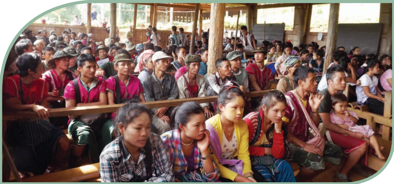
ကျေးရွာအုပ်စုအဆင့် သံလွင်ငြိမ်းချမ်းရေးဥယျာဉ်ဆိုင်ရာ အများပြည်သူနှင့်ဆွေးနွေးညှိနှိုင်းမှုအစည်းအဝေး၊ ၂၀၁၈ ခုနှစ်။