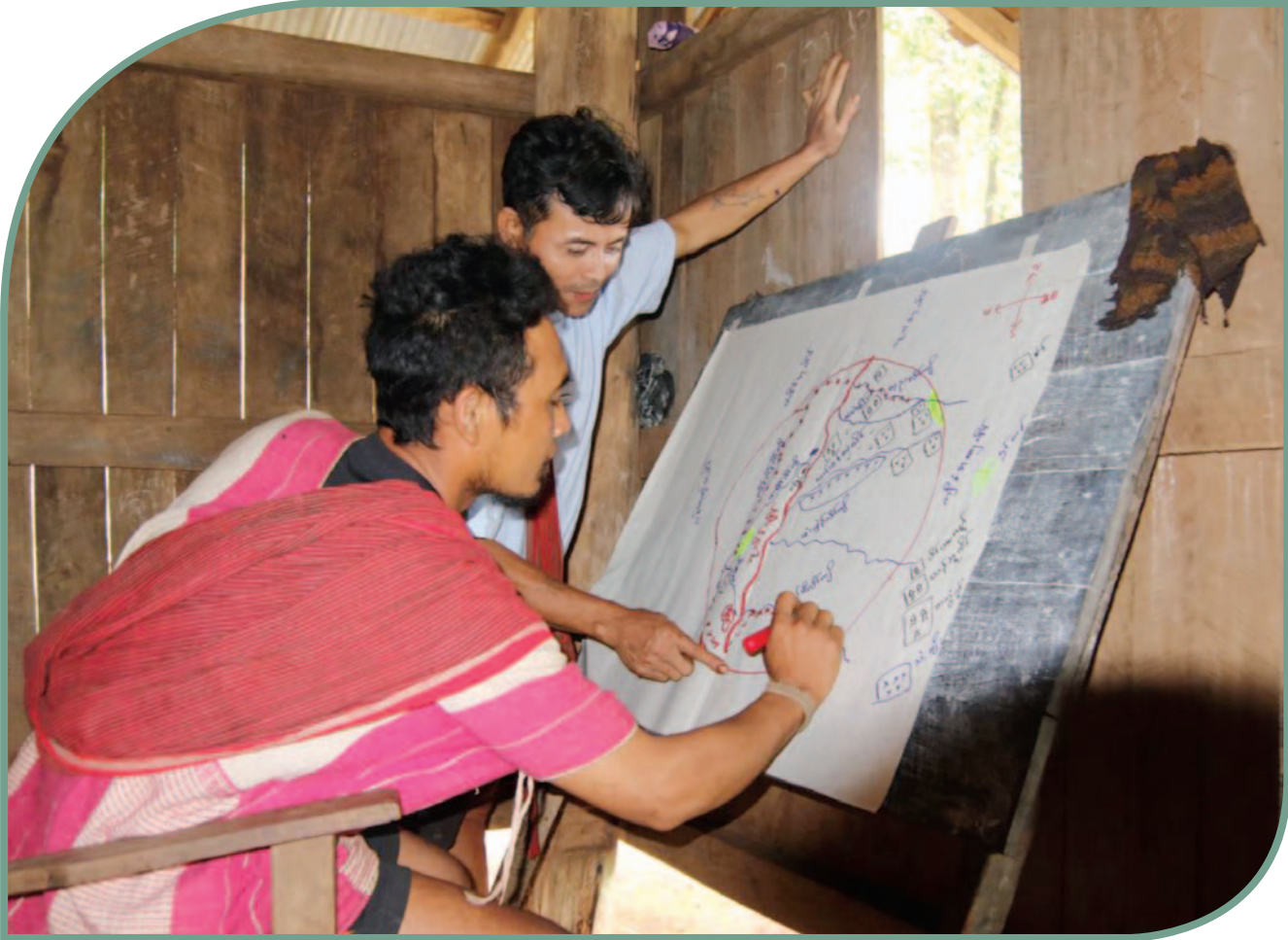
သာသွီးဒဲ ဓလေ့ရိုးရာကော်နယ်နိမိတ်ကို ရွာသူရွာသားများမှပူးပေါင်းရေးဆွဲကာ လိုအပ်သောအချက်အလက်များကို ဖြည့်စွက်နေစဉ်

သံလွင်ငြိမ်းချမ်းရေးဥယျာဉ်ပြည်သူများသည် သဘာဝပတ်ဝန်းကျင်နှင့် ပြည်သူတို့၏ကိုယ်ပိုင်ပြဌာန်းခွင့်တို့အပါ အဝင် သံလွင်ငြိမ်းချမ်းရေးဥယျာဉ်၏ဘုံအကျိုးစီးပွားနှင့် အများပြည်သူအကျိုးစီးပွားများအပေါ် ဆိုးကျိုးများ သက်ရောက်နိုင် သောနည်းလမ်းတစ်ရပ်ဖြင့် ငွေနှင့်အာဏာရယူစုဆောင်းမှုအပေါ်အခြေခံဖွဲ့စည်းထားသည့် စီးပွားရေးစနစ်နှင့် ဝင်ငွေဖော် ဆောင်မှုကို လက်သင့်ခံခွင့်ပြုခြင်းမရှိစေရ။ (အပိုဒ် ၉၅)