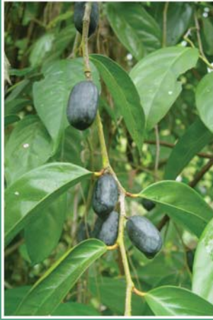
(၃၁) ဝန်သဲချေ