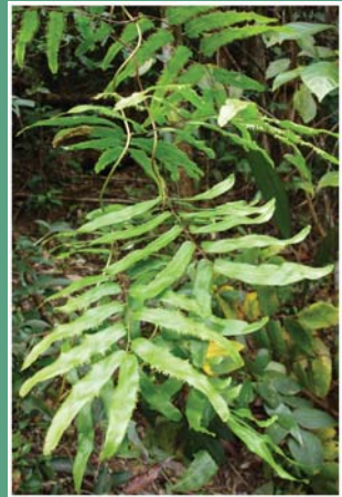
(၁၁၄) ကောက်ကောက်ညွန့်