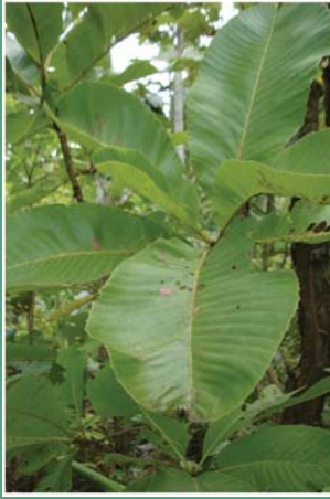
(၉၇) ဇင်းမွန်းပင်