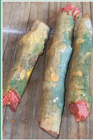
(၅) ကုန်းပူ(ရေဘူ)