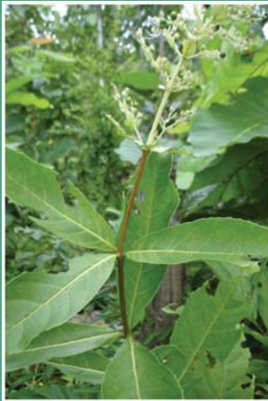
(၃၄) ယင်ပြား (နီ)