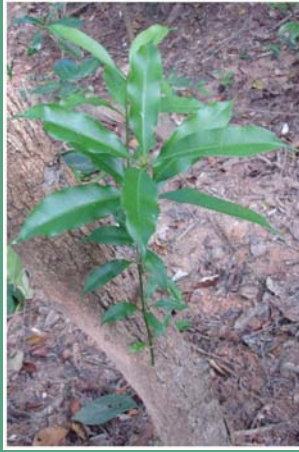
(၁၁၀) ဒေါင်းအိပ်တန်း