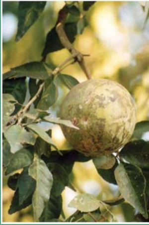
(၂၅) ဥချစ်သီး