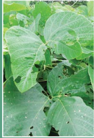
(၈၇) ခွေးလေးယားသီး