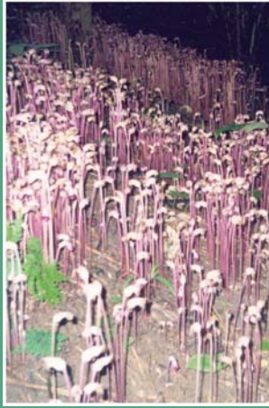
(၃၂) ငရံပတူ