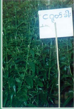
(၃) ငြုပ်ခါးသီး