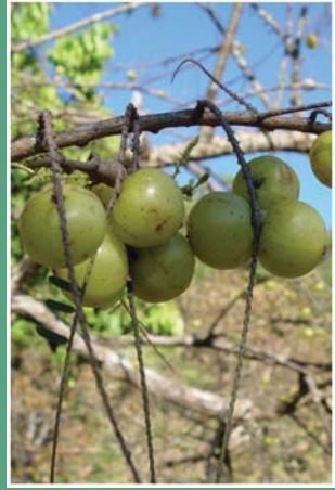
(၃၉) ဇီးဖြူသီး