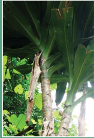
(၁၅) နလိန်ကျော်