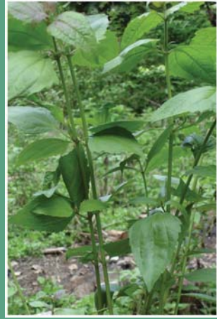
(၄၅) ဖီးစပ်ပင် (ဖီးစပ်ကြီး)