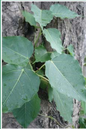
(၁၁၃) ညောင်ပင်ငယ်