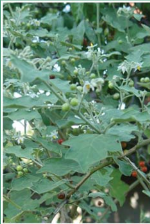
(၁၁၈) ခရမ်းခါးပင်