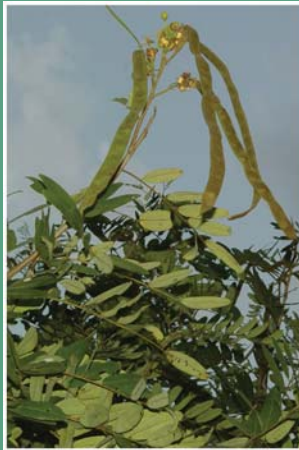
(၂၉) မယ်စလီ