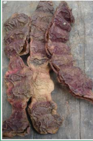
(၁၁၆) ကင်ပွန်းသီး