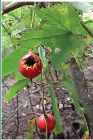
(၆၄) ကျီးအာသီးပင်