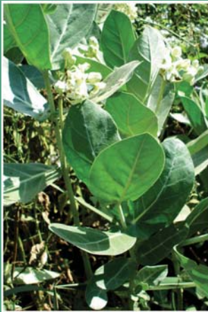
(၄၀) မရိုးရွက် (ငဖြူကြီးပင်)