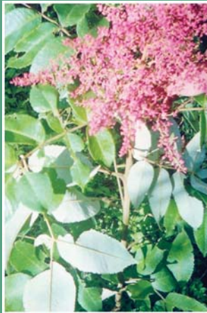
(၄၇) ဝေရောင်းချဉ်