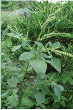
(၇၃) တင်းနုနွယ်ဆူးပေါက်