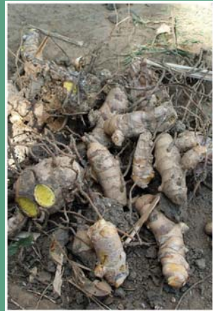
(၄၈) နန္ဒင်းခါး