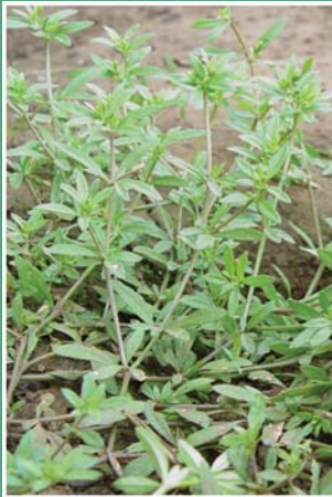
(၄၆) ဂန့်ဂလာ