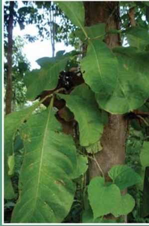
(၉၈) ဘန့်ဘွားပင်