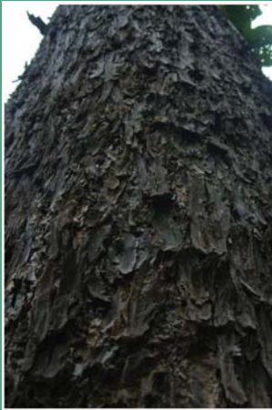
(၇၆) သစ်ဆိမ့်ပင်