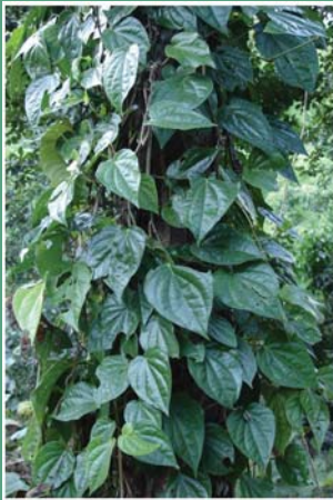
(၁၁၂) ကွမ်းရွက်