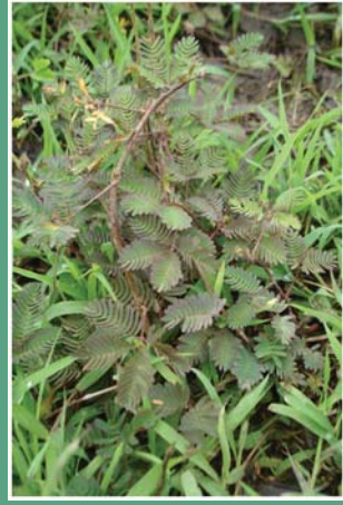
(၂၁) ထိကရုန်းနီ