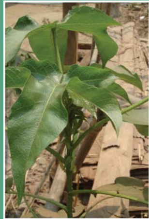
(၈၄) ဂွမ်းပင် (ဝါပင်)