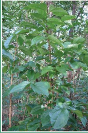
(၈၀) ခအောင်းပင်