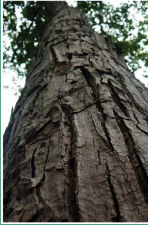
(၁၀၄) ထောက်ကြွဲ