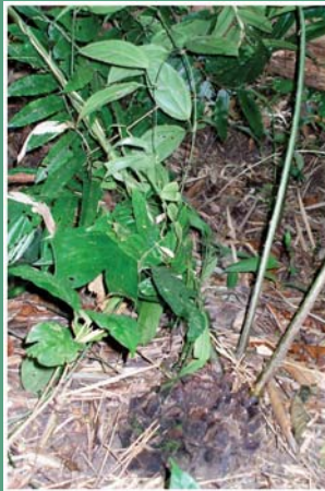
(၉၅) ဆေးမြင်းခွာ