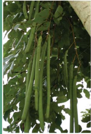
(၇၅) ငှက်ပင်