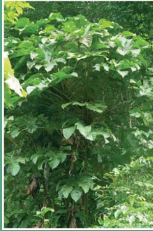
(၅၀) ကင်းလောပင်