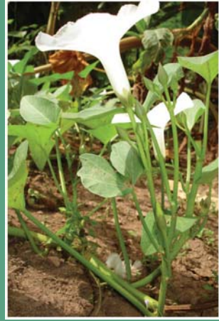
(၉၃) ကဇွန်းရွက်