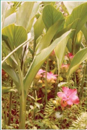
(၅၈) သရက်ကင်း