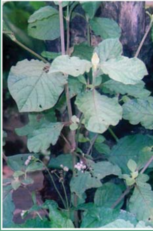
(၄၉) ကမ်းချုပ်နီ