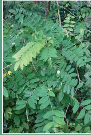
(၁၀၅) ငန်းပင်