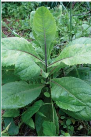
(၁၀၀) ဖုံးအသိမ်အငယ်မျိုး