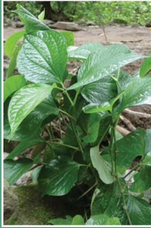
(၃၈) ပိတ်ခြင်းရွက်