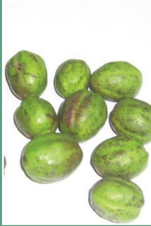
(၂) ဖန်းခါးသီး