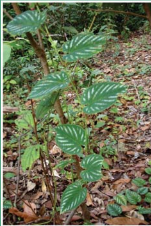
(၁၀၆) နွယ်လောင်