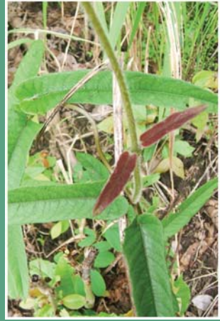
(၁၁၁) ခွေးအီးနွယ်