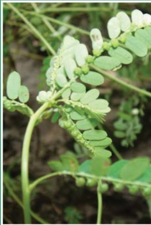
(၂၂) တောင်းဇီးဖြူ