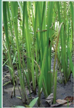
(၃၆) လင်းနေဥ