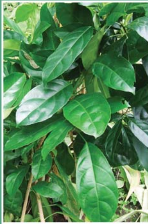
(၁၁) ဇီဝကလက်ထောက်