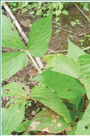
(၈၈) ကျေးမြီးဖို