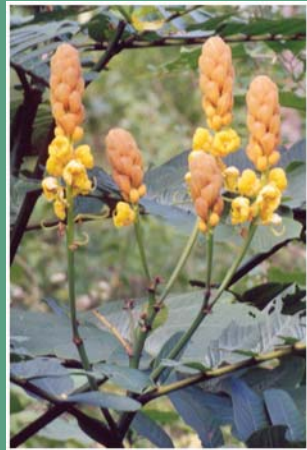
(၁၈) မယ်စလီကြီး (ပွေးကိုင်း)