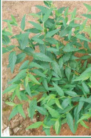
(၂၀) တံမျက်စီးပင် (ဝက်ချေးပနဲပင်)