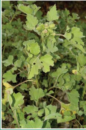
(၉၁) ကပ်စီးနဲပင် (နွားမြီးကပ်)