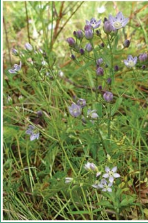
(၇) ပန်းခါး