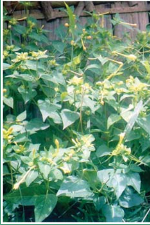
(၁၁၅) လေးနာရီပန်းပင် (မဉ္ဇူပန်း)