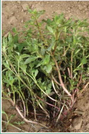
(၅၅) ကြိမ်မှန်နက်