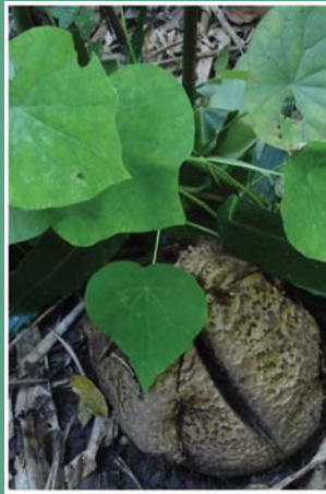
(၈၉) တောင်ကြာဥ