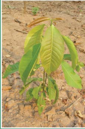
(၂၆) သက်ရင်းကြီး