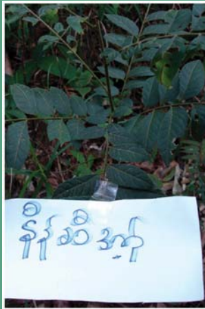
(၇၁) ပျဉ်းတော်သိမ်အရိုင်း