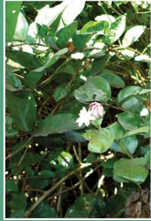
(၉) စပယ်ပန်း