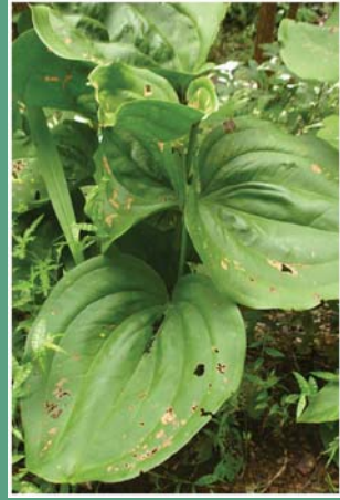
(၃၃) စိန်နဘော်အကြီးမျိုး