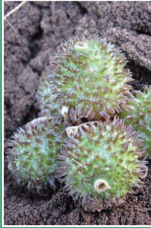
(၈၆) ဖိလာသီး