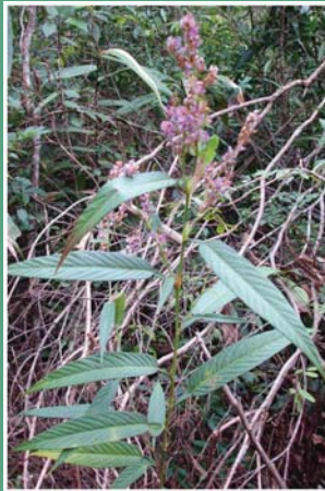
(၂၃) လောက်သေရွက်