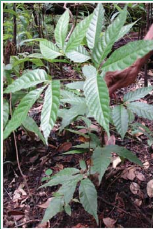
(၉၄) လက်ဖက်