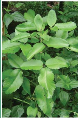
(၇၇) ရွက်ကျပင်ပေါက်