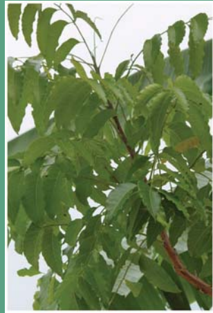
(၉၀) တမာပင်