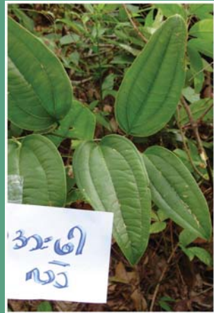
(၁၀၈) စိမ်နဘော်အငယ်မျိုး