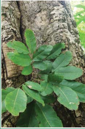
(၃၇) ရှိပင်