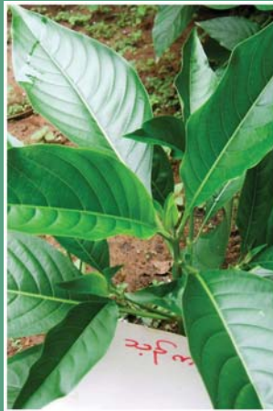
(၁၀၁) မယားကြီးပင်