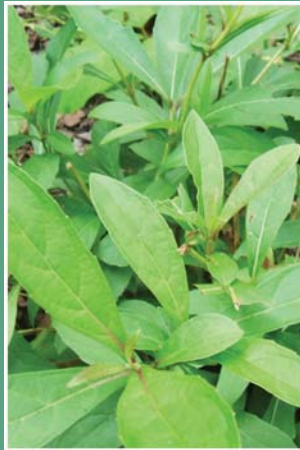
(၅၃) ယင်းပြာအဖြူ