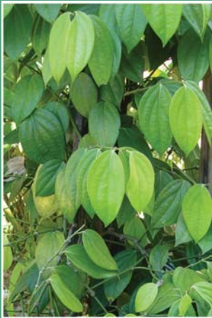
(၄) ငြုပ်ကောင်း