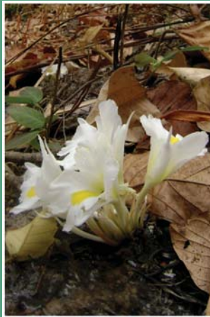
(၁၀၇) ပဒတ်စာ