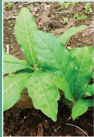
(၉၆) ဘုမ်မရာဇာ