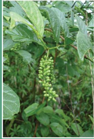
(၉၉) ကင်မလင်းသီး