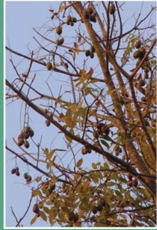
(၆၉) ဂွေးပင်