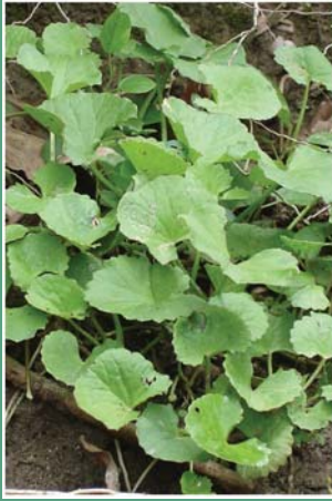
(၁၀၉) မြင်းခွာရွက်