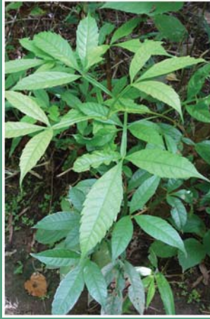
(၉၂) သံသတ်ပင်