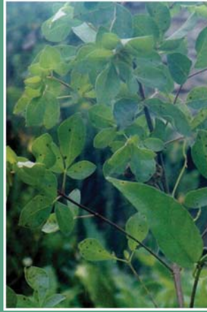
(၅၆) ကြောင်ပန်းရွက်