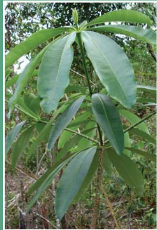
(၆) တောင်မရိုးပင်