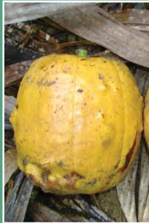
(၅၉) မဲ့လင်ချည်သီး