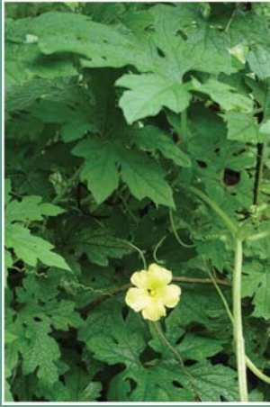
(၁၃) ကြက်ဟင်းခါးရွက်