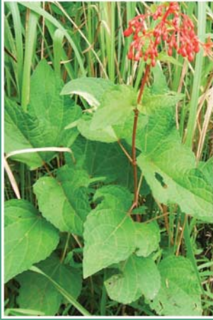
(၆၇) ပန်းပဒေသာအနီ