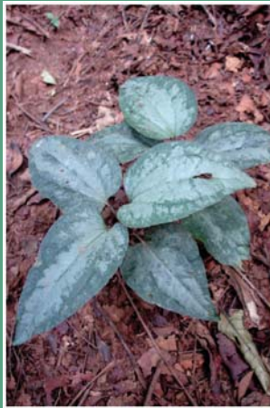
(၈၃) ကွမ်းရိုးနွယ်အနီ