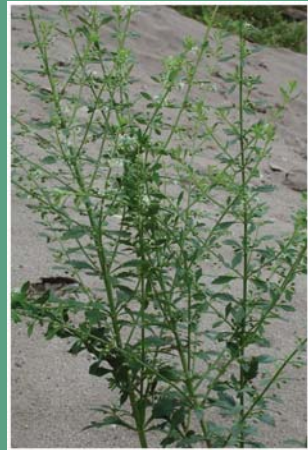
(၂၄) ခွေးသေးပန်းရွက်