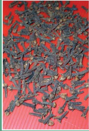
(၂၇) လင်ညှင်းပွင့်