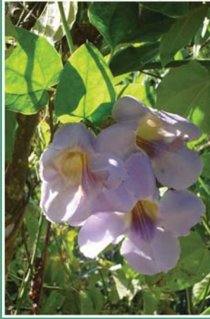
(၄၄) ကွမ်းရိုးနွယ် (ကျီးခေါင်းသီးနွယ်)