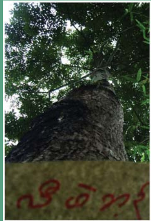
(၄၂) နတ်ပင်