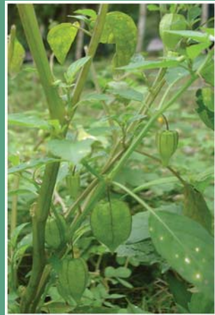
(၇၈) မေါင်မေါင်းပင် (မေါက်လောက်ပင်)