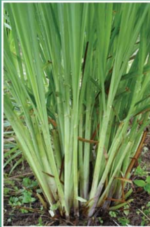
(၁၁၉) စပါးလင်