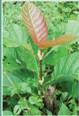
(၁၀၂) ထိမ်ပင်