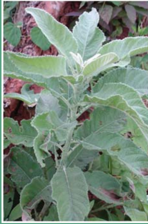
(၈) ဖုံးမသိန်