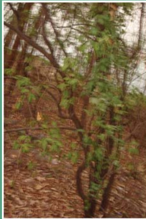
(၁၇) နံ့သာနီ