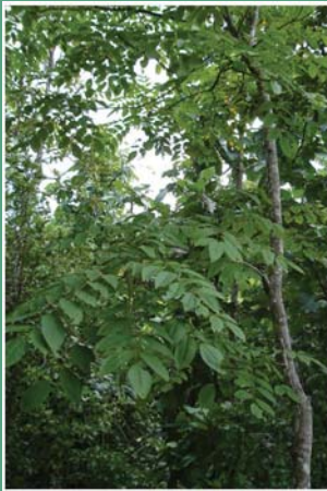
(၁၆) နဘဲပင်