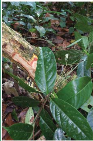
(၃၅) လက်ထုပ်ကြီး