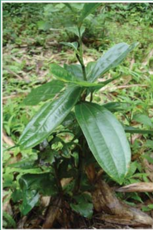
(၅၂) နလိမ်ကျော်