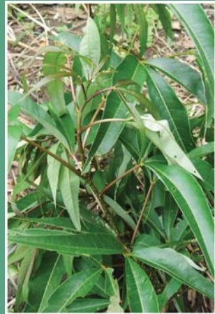
(၅၄) ခံတက်ပင်