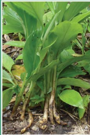
(၆၅) ဆိပ်ဖူး