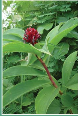
(၆၃) ဖလန်တောင်မွှေး (ရှေး)