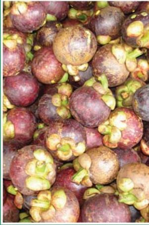
(၁၉) မင်းဂွတ်သီး