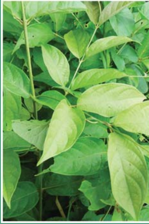
(၁၀၃) နဘူးပင်