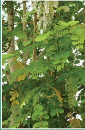
(၆၈) စစ်ပင်