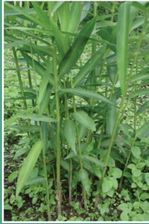
(၁၄) နတ်မျှားပင်