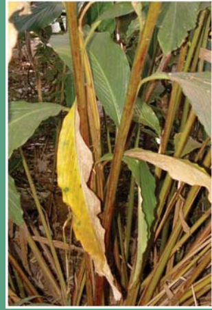
(၅၇) ပေါ်မေဆွီး