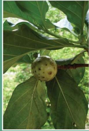
(၈၁) ရဲယိုပင်