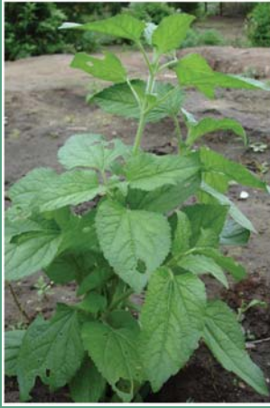
(၈၅) ဆိတ်သိုးရွက်