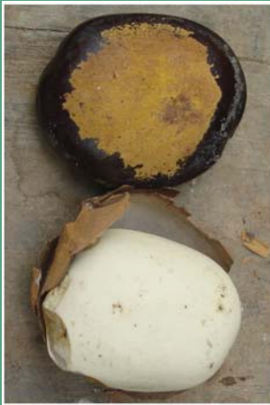
(၂၈) ဂုံညှင်း