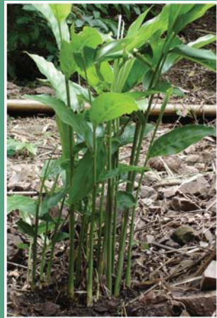
(၃၀) ပဒဲကော