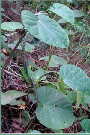
(၁) ဆင်တုံးမန္တယ်