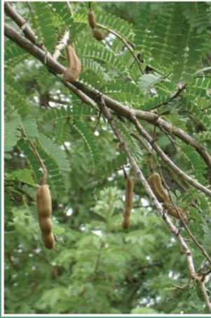
(၄၃) မန်ကျီးသီး