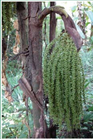
(၇၀) မင်းဘောပင်