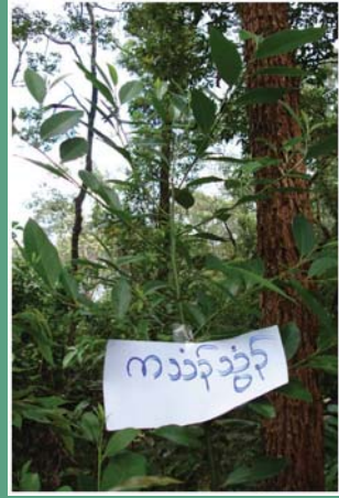
(၅၁) လွေးဆေးပင်