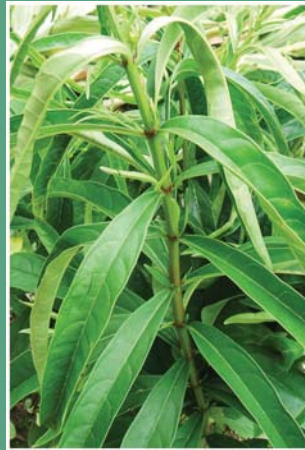
(၆၆) ငရန်ပဒူ