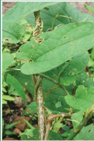
(၄၁) ငပုန်းဆေး