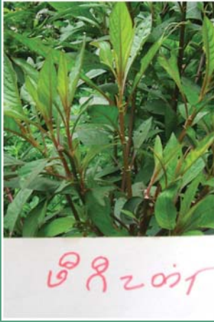
(၆၁) ကြက်မောက်ပန်း