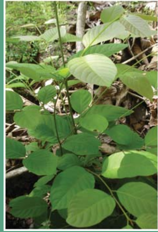
(၁၁၇) ဖန်းခါးပင်