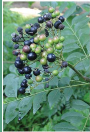
(၇၂) ပျဉ်းတော်သိမ်