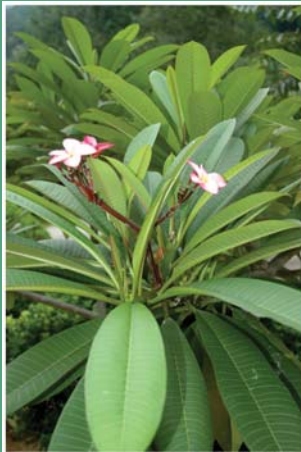
(၁၀) တရုပ်စကားပင်