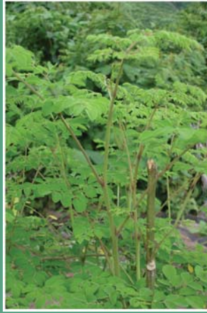
(၆၂) ဒန်ဒလွန်