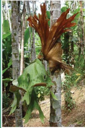
(၇၄) ဇော်ဂျီခါးပုံစ