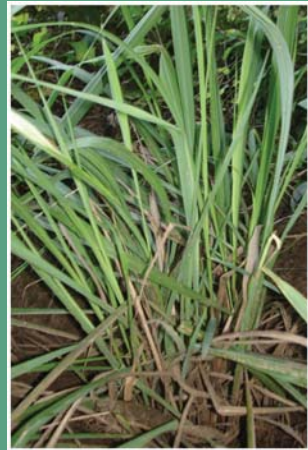
(၁၂၀) စပါးလင်နီ