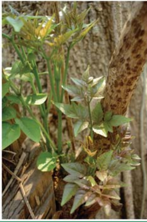
(၇၉) ကေရုဇံ