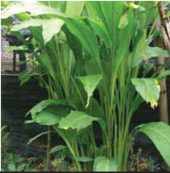
ပိာ်တခါး