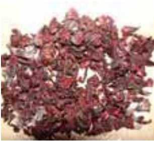
ဘဲအိၣ်သၢ်