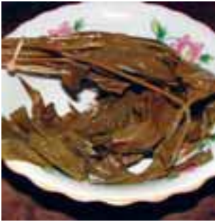
နီၣ်ထးဒီးစုၣ်ဆံၣ်