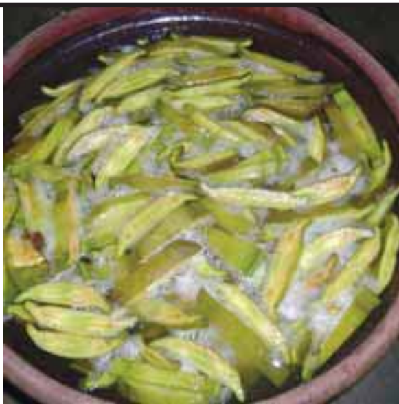
ဒီးကၣ်သၣ်စုၣ်ဆံၣ်