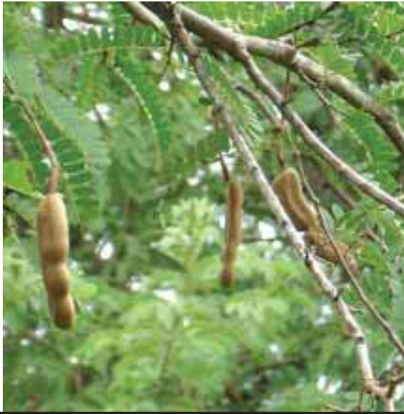
သၣ်စိကျၢသၣ်ဃု