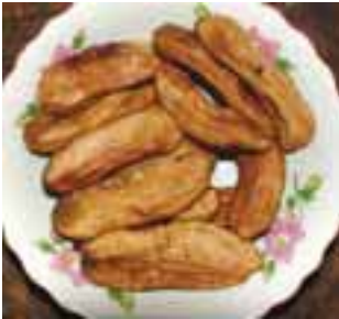
တကွံၣ် သၣ်ဃု