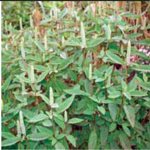
နီၣ်ကဝီၤ