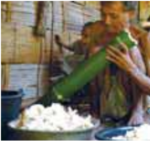
ကုၤသံးဆံၣ်