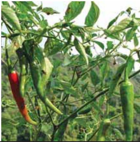
ဖိၣ်ကံၤသၣ်