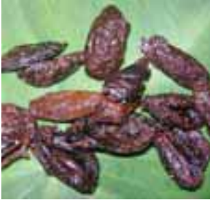
တဃီၤဆံၣ်သၣ်ဃု