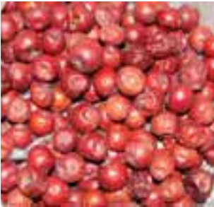
ထံမိၤတြိၤသၣ်