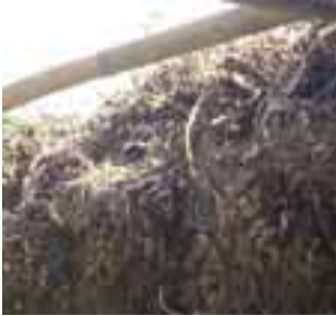
သဘ့တီၣ်လၢ်ချံၣ်