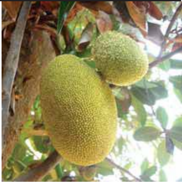
ပန္နဲၤသၣ်