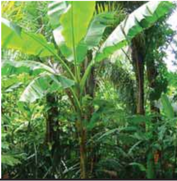
တကံၣ် ဒုၣ်