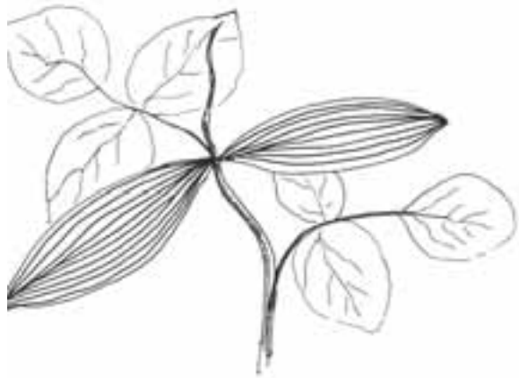
ထီးလီၤခံသၣ်