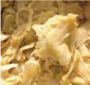
ဘီၣ်စ့ၣ်ဆံၣ်