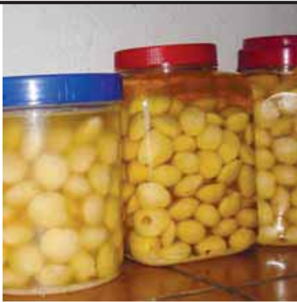
တန့သၣ်စုၣ်ဆံၣ်