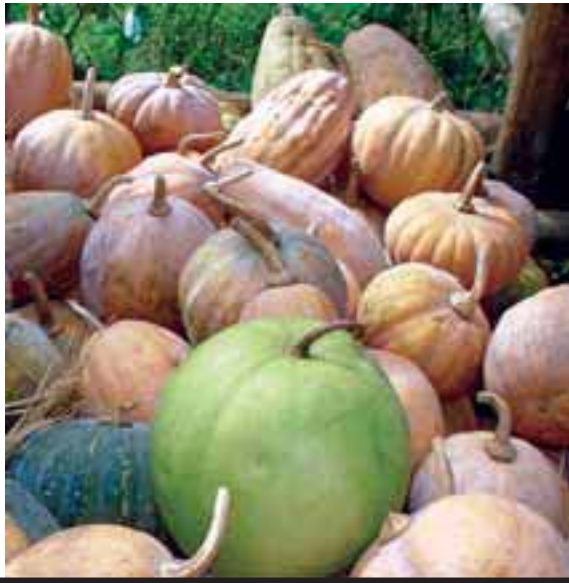
လူၢ်ခွဲၣ်သၣ်