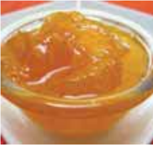
တခါးသၢ်ယုၣ်