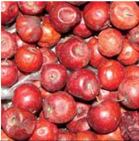
ထံမိၤကြိၤသၢ်ယုၣ်