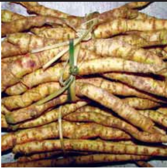
သ့ၣ်ဘီၣ်အုၣ်တၢ်