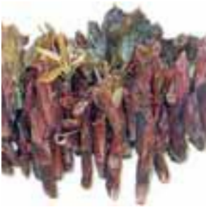
ချၢၣ်ဆံၣ်ဒီး