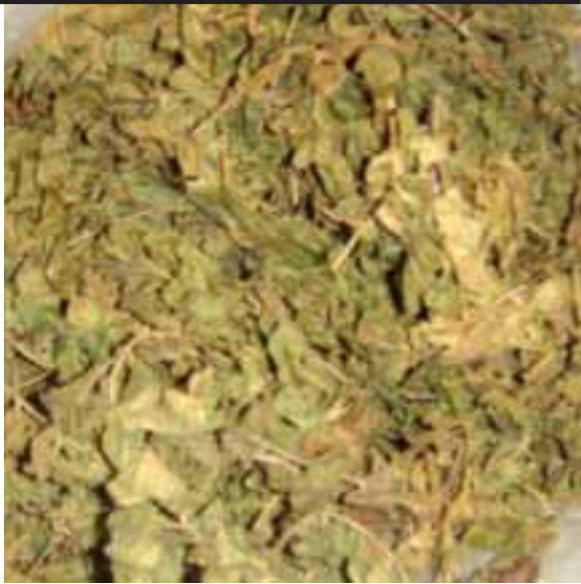
နီၣ်ထံလၢနဃု