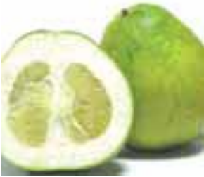
သးဟီၤသၣ်