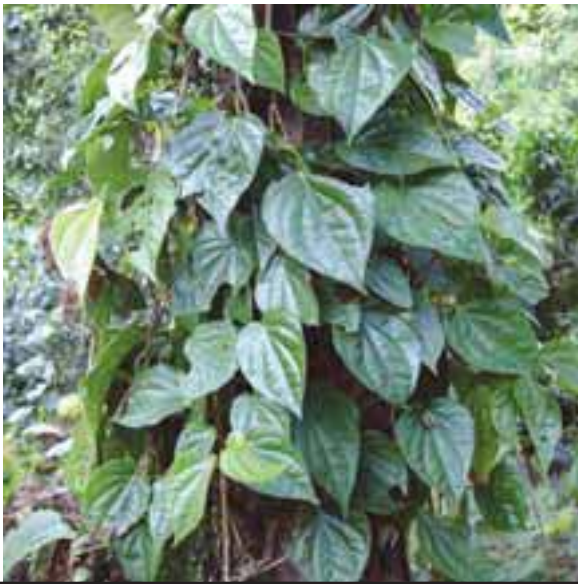
သဘျုးလၢ်