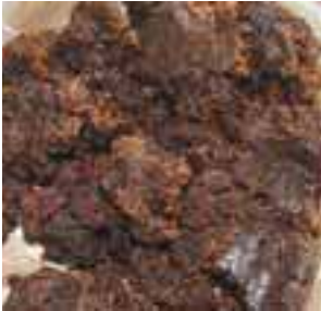
တူၢ်ရှၢ်သၢ်