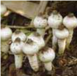
ကုၤဘျၢၣ်ဃု