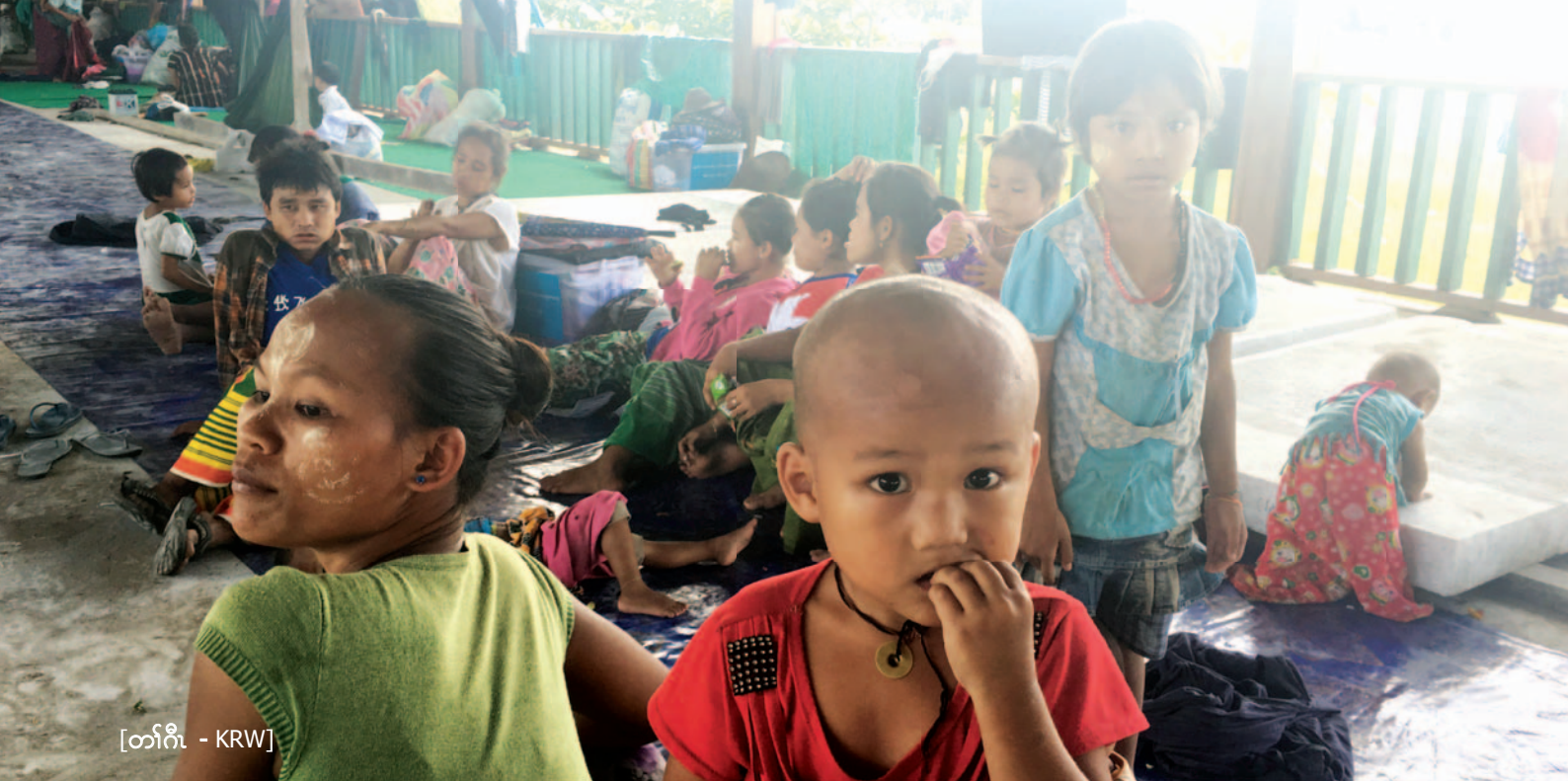
[တၢ်ဂီၤ - KRW]