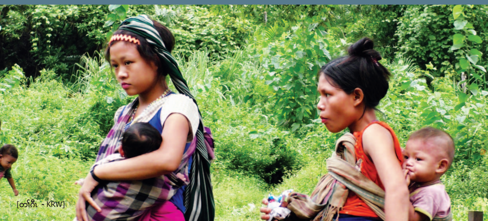
[တၢ်ဂီၤ - KRW]

လၢစးပတုဘၣ် ၂၁ - ၂၇ သီ - (KNLA) အပုၤဘၣ်မူဘၣ်ဒါဟ်ဖျါဝဲဒ်လၢ သးခိးကီၢ်ဆၢတဖၣ်အတၢ်ဟူးတၢ်ဂဲၤလၢယိၣ် လိာ်ကျိထးခိလၢမ့ၢ်ထီၣ်တကဟ့ၣ်အါထီၣ်ဝဲဒ်န့ၣ်လီၤ. ပုၤသဝီဖိတဖၣ်စံးစ့ၢ်ကီးဝဲ လၢသးခိးကီၢ်ဆၢတဖၣ်န့ၣ်လီၤအိၣ် ဆိးဝဲဘိတရီသဝီအပူၤလံၤန့ၣ်လီၤ.