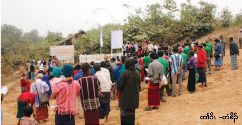
တၢ်ဂီၤ - တံခိဉ်

လိာ်ကဝီဖိဟ်ဖိဉ်ဒီးဟ်ဖျါထီဉ်အတၢ်ဟူးတၢ်ဂဲအိဖျါတၢ်ဘါသကိးယွၤ တကလၢတၢ်ဖျါတၢ်န့ဉ်ဒၣ်ဝဲ