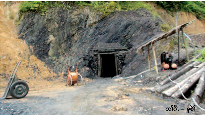
တၢ်ချံၣ်ဟီၣ်လၢလၢဟီၣ်ခိၣ်လၢတၢ်ကထုးထီၣ်ဟီၣ်လၢတၢ်ထုးတၢ်တီၤအဂီၢ်