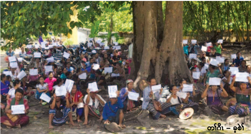
တၢ်ဂီၤ - ခုစါ

လိာ်ကဝီဖိဟ်ဖိဉ်ဒီးဟ်ဖျါထီဉ်အတၢ်ဟူးတၢ်ဂဲအိဖျါတၢ်ဘါသကိးယွၤ တကလၢတၢ်ဖျါတၢ်န့ဉ်ဒၣ်ဝဲ