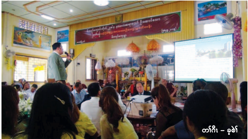
တၢ်ဂီၤ - ခုစၢ်

ပှၤတၢၤ ဟံၣ်ဖျါထီၣ်တၢ်ဂ့ၢ်ဆူတၢ်ကစီၣ်ဝဲၤကျိၤဖိသီးအတၢ်ဂ့ၢ်တဖၣ်ပှၤကသ့ၣ်ညါလၢဟီၣ်ခိၣ်ဒီးဘ့ၣ်