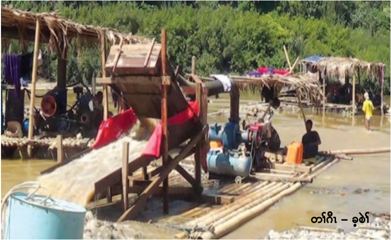
တၢ်ဂီၤ - ခူၤဖဲၢ်