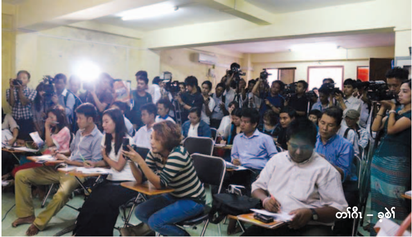
တၢ်ဂီၤ - ခုစၢ်

ပှၤတၢၤ ဟံၣ်ဖျါထီၣ်တၢ်ဂ့ၢ်ဆူတၢ်ကစီၣ်ဝဲၤကျိၤဖိသီးအတၢ်ဂ့ၢ်တဖၣ်ပှၤကသ့ၣ်ညါလၢဟီၣ်ခိၣ်ဒီးဘ့ၣ်