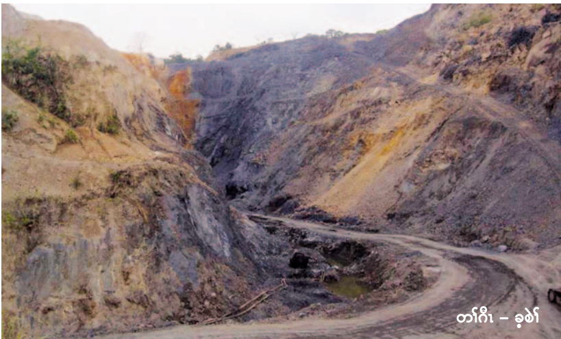
တၢ်ဂီၤ - ခူၤဖဲၢ်

တၢ်သုးကွၢ်ကစၢ်ဒီခိၣ်ခိၣ်ဖျိတၢ်သုမ့ၣ်ပီၤဒ်သိးတၢ်ချၢ်ဟီၣ်လၢကသုအဂီၢ်