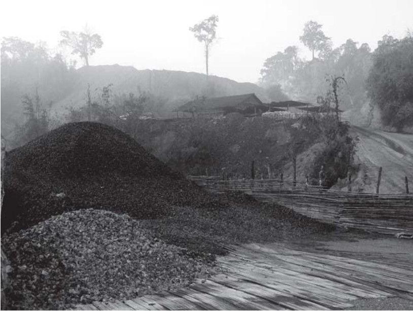
တၢ်မၤတၢ်န့ၣ်လၢၢ်ဟံၣ်လၢၢ်အတၢ်ဖံးတၢ်မၤအါအါဂီၢ်ဂီၢ်လၢကညီကီၢ်စံၣ်အပူၤ