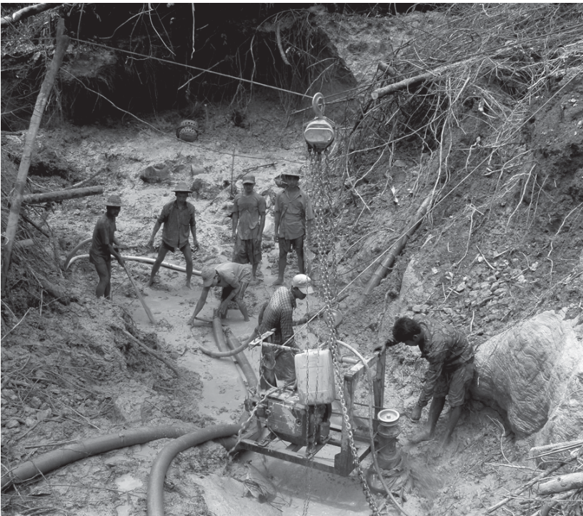
အဖဲနဲးဟးထီၣ်စ့ၣ်ကီးလၢ တၢ်ချၢ်စၢ်ထးအလီၢ်အကျဲ, တၢ်ဘၣ်အဘၣ်သီလၢတၢ်ချၢ်စၢ်ထးအလီၢ်အကျဲဒီးတၢ်တၢ်ကွၢ်တၢ်ဘၣ်အဘၣ်သီလၢတၢ်ချၢ်လၢၢ်အပူၤတဖၣ်န့ၣ်လီၤ