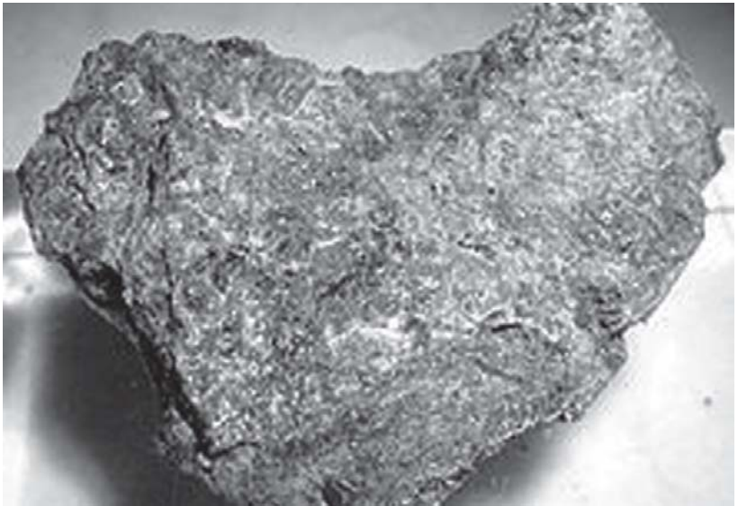
တင်ထိုင်နွံပဒါလလင် လု ဒီးဟိုင်ခိုင်ညှင်အကျါ, ပဒါအလွင်လီကင်ဒ်စုအသီးဒီးဖဲတင်ကဟီးဆဲးဘင်အီနွံဆဲးကလဲဒ်မိတ်ထံကလဲ(မုန်)အသီး