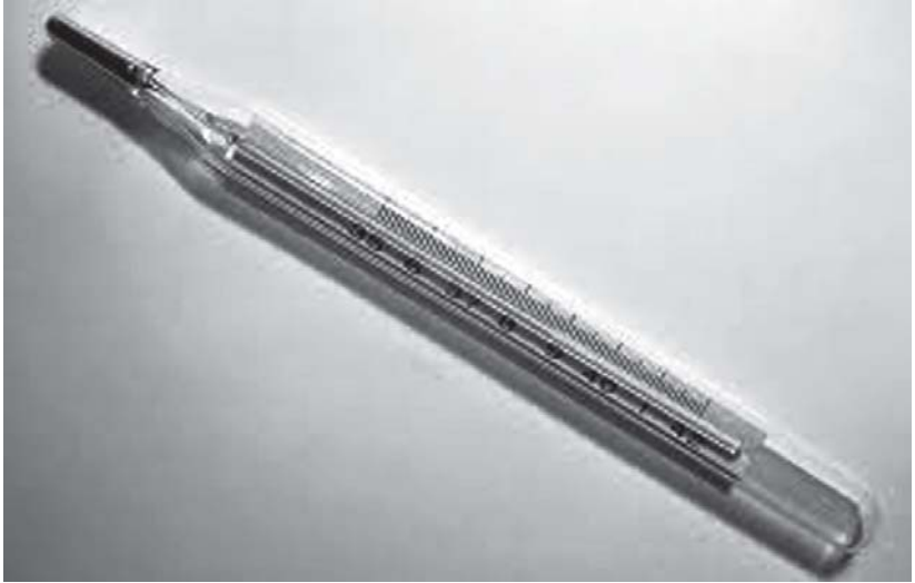
တံစူးကပါပဒါလတင်ထိုင်တင်ကီအတင်ဖိတင်လံဒ်အမှ် သမိမံထည် (သာမိုမိတာအပူချိန်တိုင်းကရိယာ) စွန်ကီး