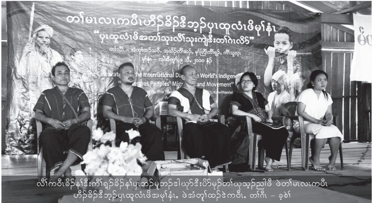
လီၢ်ကပီၤခိၣ်န့ၢ်ဒီးကီၢ်ရုၢ်ခိၣ်န့ၢ်ပုၤဘၣ်မုၢ်ဘၣ်ဒါယုဒီးပိာ်မ့ၢ်တၢ်ယုသ့ၣ်ညါဖိ ဝဲတၢ်မၤလၢကပီၤ ဟီၣ်ခိၣ်ဒီဘျီပုထူလံၤဖိအမ့ၢ်န့ၢ်, ဝဲအံၤတုၤထံၣ်ဒဲကတီး, တၢ်ဂီၢ် - ခုဖဲ

ဝဲ ၂၀၁၂ နံၣ် တုၤလၢ ၂၀၁၆ နံၣ်အတီၢ်ပူမ့ၢ် ထူလံၤတၢ်ယုသ့ၣ်ညါကရၢ်လၢလုၤသီကီၢ်ဆၢၣ်, မ့ၢ်တြီၢ် ကီၢ်ရုၢ်တဖၣ် ကရၢ်ကရိဟံၤဖျိထီၣ်အသး ဒီးယုသ့ၣ် ညါသကိးဖိသ့ၣ်ခံလၢအအိၣ်လၢကဆိထၢၣ်သီသံၣ်ပျီ ဂီၤပုၤတၢၤသ့ၣ်ပုၤအပူ ဒီးယုသ့ၣ်ညါန့ၢ်ဝဲဖိအဒုၣ်အ