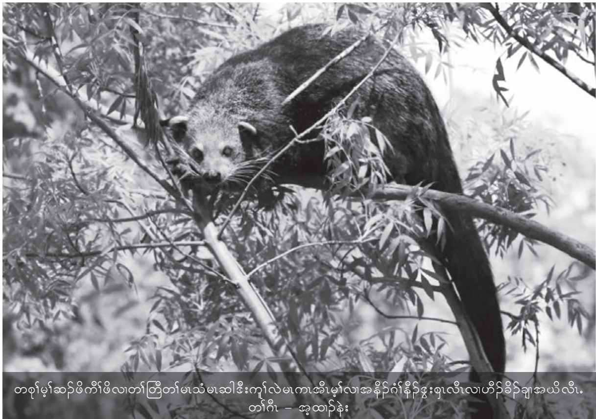
တစုၢ်မုၢ်ဆၣ်ဖီကီၢ်ဖီလၢတၢ်တြီတၢ်မၤသံမၤဆါဒီးကျၢ်လဲၤမၤကၢအီၤမုၢ်လၢအနီၣ်ဂံၢ်နီၣ်ခွဲးစုၤလီၤလၢဟီၣ်ခိၣ်ချၢအယီၤလီၤ.

အါတက့ၢ်အိၣ်ဆိးဝဲလၢတၢ်လျၢ်ကစၢ်ကလိအခိၣ်ထံး, ဒီးတၢ်လျၢ်လၢသ့ၣ်ထူၣ်ဝဲထူၣ်ပျဲၤလုၢ်ဘၢအလီၢ်န့ၣ်လီၤ. အါတက့ၢ်အိၣ်ဆိးဝဲလၢသ့ၣ်ပျၢ်တၢ်လီၢ်ဖျၢၣ်, တၢ်လီၢ်ပၤအလီၢ်လၢသ့ၣ်ထူၣ်ဒီးတပံၢ်တမါဝဲထီၣ်အလီၢ်န့ၣ်လီၤ.