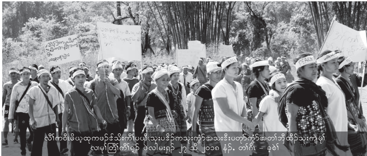
လီၢ်ကဝီဖိဖဲလုထုကဖှ်ဒ်သိးကီၢ်ပယီသုးပဒိဉ်ကသုးကွံာ်အသးဒီးပတုာ်ကွံာ်အတၢ်ဘျီထီဉ်သုးက့မုၢ် လၢမုၢ်တြုၤကီၢ်ရံဉ် ဖဲလါမးရှဉ် ၂၇ သီ ၂၀၁၈ နံဉ်, တၢ်ဂီၤ - ခုၣ်

ဖဲလါမးရှဉ် ၄ သီအနံးန့ဉ် ဒီဖျိပယီသုးမုၢ် ဒိဉ်ဟဲထီဉ်ဆူလူသီကီၢ်ဆဉ် လၢကတ့ထီဉ်ဝဲသုးဒုး