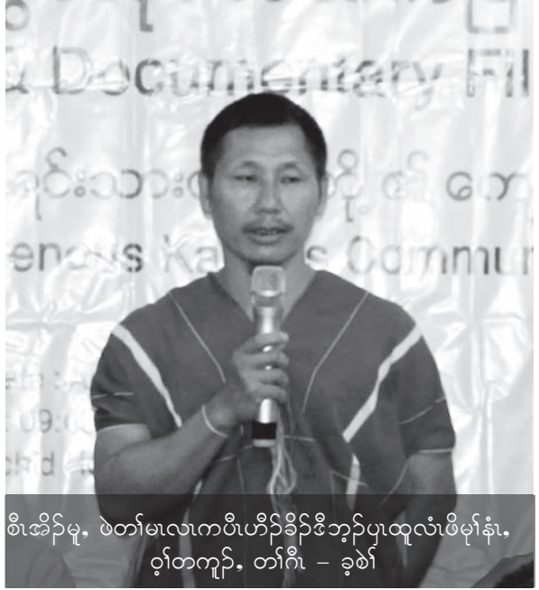
စီၤအိဉ်မ့ၢ်, ဖဲတၢ်မၤလၢကပီၤဟီဉ်ခိဉ်ဒိဘၣ်ပုၤထူလံၤဖိမုၢ်နံၤ, ဝုၢ်တကျၢၣ်, တၢ်ဂီၤ - ခုၣ်

ဆၢကတီၢ်မုၢ်မဆါတနံၤအံၤ တၢ်သ့ၣ်ထီဉ်ဝဲပုၤ တၢ်တၢ်မၤတဖၣ် မ့ၢ်တၢ်မၤတခါလၢအရ့ၤဒိဉ်မးလၢပုၤ ကညီပုၤထူလံၤဖိသ့ၣ်တဖၣ်အဂီၢ်န့ၣ်လီၤ. ဘၣ်မနုၤအ ဃိလဲဉ် လၢအပူၤကွံာ်အါနံၣ်အါလါအတီၢ်ပူၤ ပထံဉ် ဘၣ်ပမိၢ်ပၢ်ဖဲဖုသ့ၣ်တဖၣ်အိဉ်ဒီးတၢ်အဲဉ်တၢ်ကွံာ်ဒိဉ် မးန့ၣ်လီၤ. ဒ်န့ၣ်အသိးတၢ်ယုတၢ်ဖိးတၢ်သ့ၣ်တီသးရု တဖၣ် အိဉ်ဒီးအသးအသ့ၣ်အလၢကပီၤ ဒီးသုပျီဝဲ ဒိဉ်မးလီၤ. ဒီးတုၤလၢတၢ်ဒုးဖးဒိဉ်ခံၣ်တၢ်တၢ်ဝံၤအလီၢ် ခံ ကညီဖိသ့ၣ်တဖၣ်ဘၣ်ယုၢ်မ့ၢ်ဖိးလီၤမုၢ်လီၤဖးအါ မး ဒီးတၢ်ယုတၢ်ဖိးတၢ်အဲဉ်တၢ်ကွံာ်လီၤ, တၢ်ထံဉ်ဖုဉ် ထံဉ်ဖုဉ်ထီတဖၣ် အိဉ်ထီဉ်ဝဲအါမးန့ၣ်လီၤ. ဒီဖျိလၢ