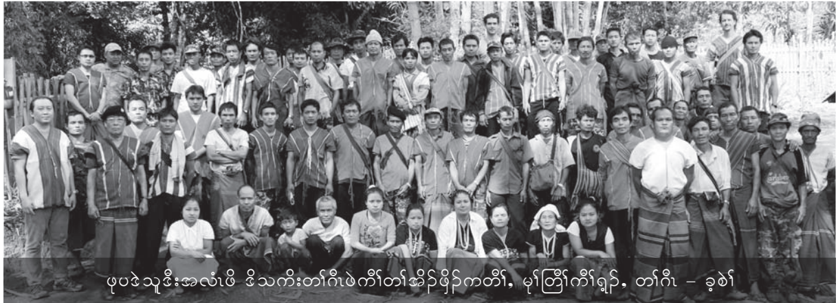
ဖုပဒဲသုဒီးအလံၤဖိ ဒိသကိးတံာ်ဂီၤဖဲကီၢ်တံာ်အိၣ်ဖျိၣ်ကတီၢ်, မုာ်တြီၢ်ကီၢ်ရၣ်, တံာ်ဂီၤ - ခုၣ်စါ

ဖဲဖုပဒဲသုသံဝံၤအလီၢ်ခံန့ၣ်, ပုတတဂၤမံးတံာ်သ့ၣ်တဖုဒဲလအတံာ်အဲၣ်ဘၣ်ဖုပဒဲသုဒိၣ်မးအပုဖဲစံးဝဲ, “ဖုပဒဲသုသံတဂၤလီၤ. ဘၣ်ဆၣ်ကဲထီၣ်တံာ်လီၤဖျဲၣ်လီၤဟိဖးဒိၣ်ညါ, သရၣ်သမါမုာ်ဂုၤ, ခိၣ်နုာ်လအရူညီနုာ်ဝဲ တဖုဒဲမုာ်ဂုၤ သးအိၣ်သးသယုာ်ဘၣ်က့ၤဖုပဒဲသု ဖဲကဆီထၢၣ်ပုတတသ့ၣ်ပုာ်ခိၣ်နုာ်အကျိၤတကအသိးန့ၣ်လီၤ.”