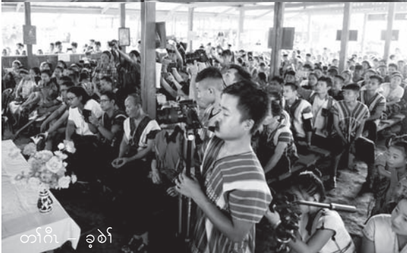
တက်ကီ - ခုဉ်

ဖဲတက်ကီလကပီဟီဉ်ခိဉ်ဒီဘုဉ်ပုထူလံဖိမုနံဒီးတက်ထူးထီဉ်ရလီတက်ယုသုဉ်ညါဖိအလံတက်ဟ်ဖျါအကတီ