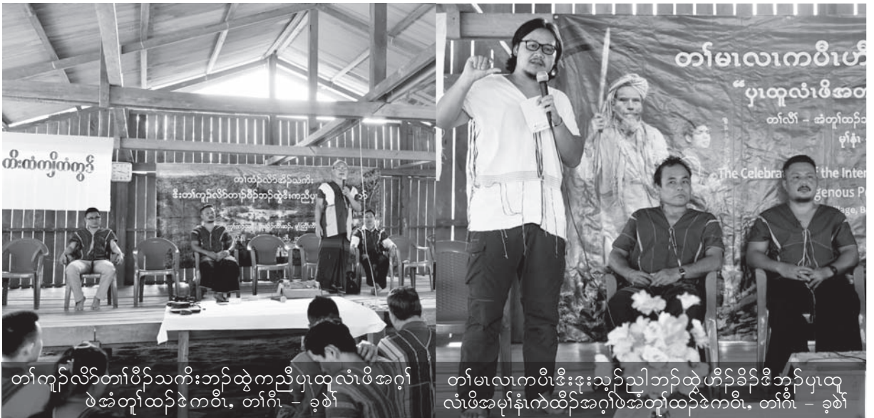
တုာ်ကုာ်လိာ်တုာ်ပိာ်သကိးဘာ်ထွဲကညီပုထုလံာ်ဖီအဂုာ် ဖဲအံတုာ်ထာ်ဖဲကပီ၊ တုာ်ဂီ - ခုဖဲ

ပုရဲာ်ကျဲတုာ်သရဲာ်စီဒီးခိာ်မု၊ ခုဖဲခိာ်ယါ န့ဆါပိညါအမုဒါခိာ်ဖဲလါ၊ “လါတုာ်တီခိာ်ရိာ်ဖဲဒီး ရဲာ်ကျဲဒုးအိာ်ထီာ်တုာ်မလါကပီကုာ်ဟီာ်ခိာ်ခီဘျာ် ပုထုလံာ်ဖီအမုာ်နံအံအဖီခိာ်၊ ပတုာ်မုာ်လါကွာ်ဖီဒီး တုာ်ပညိာ်ဖီတုာ်သုာ်တဖာ်တခိမုာ်ဝဲ တုာ်ကသုဟ့ာ်လါ ဟ့ာ်ကပီ၊ ယုးယိာ်ဟံကဲ၊ ဒီးဟံပနီာ်ကုာ်ပုထုလံာ် ဖီလါအအိာ်လါဟီာ်ခိာ်ခီတဘျာ်၊ လါအပုာ်ယုာ်စုာ်ကီး