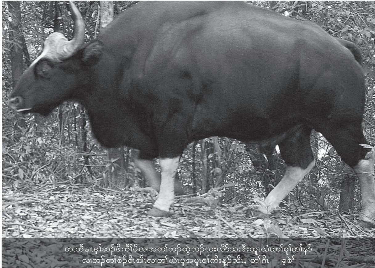
တဘီ နုာ်မုာ်ဆုာ်ထီာ်ဖိကိာ်ဖိလုအတုာ်ဘာ်ထွဲဘာ်ယးလီာ်သးဒီးထုလံတုာ်စုာ်တုာ်န့ာ် လုဘာ်တုာ်စံာ်စါအီလုတုာ်ယဲပုအပုစုာ်ကိးန့ာ်လီု. တုာ်ဂီု - ခုဝဲာ်

ဒိာ်မးန့ာ်လီု. ဒီးဖိလုအသဒါတဂုတုာ်ဒုးမံမိာ်ကဒီး အီလု (အိာ်ကနဲစီဖျုလီာ်ခိာ်) န့ာ်လီု. အဝဲသ့ာ် ကွာ်သကိးသ့ာ်ဒုဒီးထံာ်ဝဲလု (ကနဲ) တဒါ မုအိာ် ဝဲဒီးအိာ်ဝဲအခါဖျုလီာ်အခိာ်န့ာ်လီု. ဖဲန့ာ်အဆါက တီာ်ကလံမုာ်ဟဲဝဲဒီးဝဲာ်ဘီာ်တဖုာ်ဟူးဝးဝဲ ဒီးဖဲန့ာ်အ ခါဝဲာ်ဘီာ်တဘီဟဲလီုလုအပုာ်သဒါတဂုအအိာ် ဒီး ပုာ်သဒါအံာ်ဖီာ်ယာ်ဝဲမးမး ဒီးဝဲာ်ဘီာ်တဘီန့ာ်လီုဆိ တုလုသ့ာ်ခိာ်ထံး အယီအဝဲကွာလီုဆုသ့ာ်ခိာ်ထံး ဒီးအဝဲဟံးထီာ်ကွာနီာ်ရဲာ် ဒီးပျီထီာ်န့ာ်ကွာအဝဲာ်တ ဖုာ်ဒီး အဝဲာ်ကိးဂုဒီးဟဲကွာလီုဘာ်ဆုသ့ာ်ခိာ်ထံးဒီး ပုဖျုးလုတုာ်သံဒီးဟဲကွာကဒါကွာဆုအဟံာ်ဒုအညီ နုာ်အသိးန့ာ်လီု. ဒီးဖဲအဟဲကွာတုလုအဟံာ်အကတီာ်န့ာ်အ မိာ်ယာ်တသးမံနီတစဲးဘာ်. ဘာ်တနံာ်ဖဲအဝါလဲမုာ် တုာ်အဆါကတီာ်န့ာ် အမိာ်ယာ်အံးခွဲးလီုန့ာ်မုာ်လု (ဖု