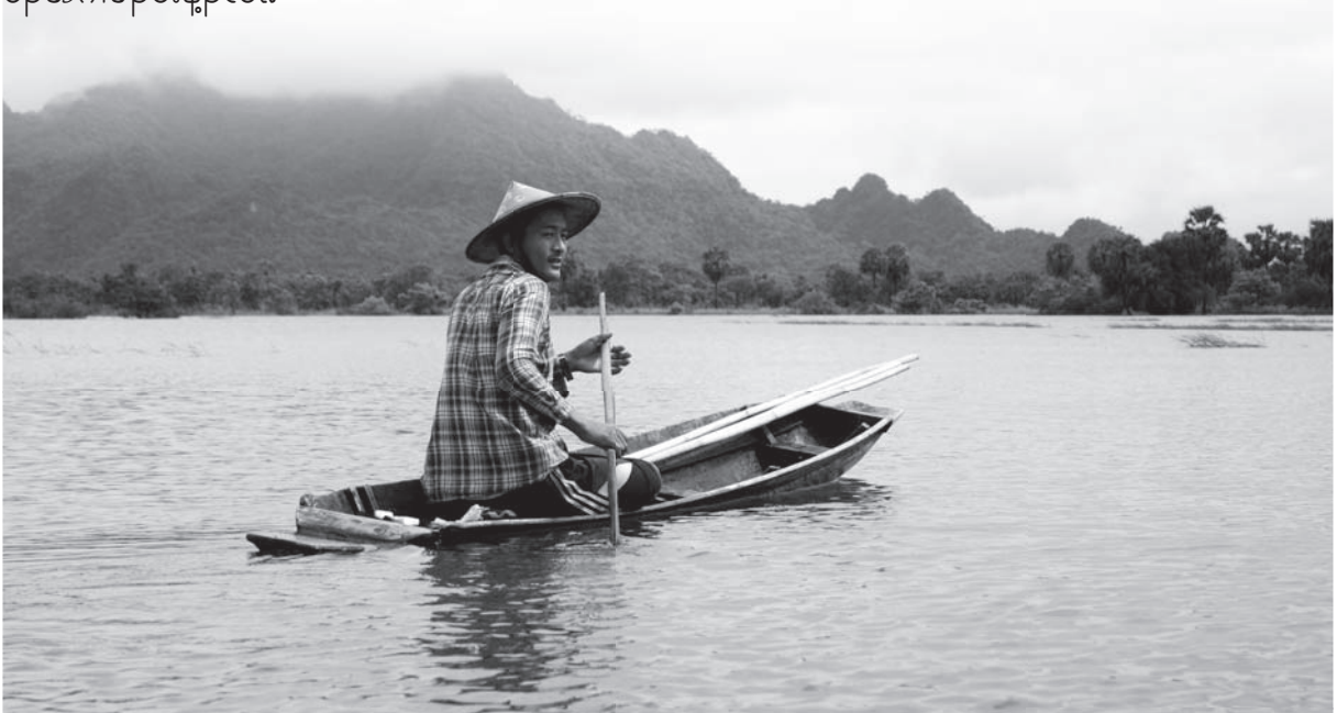
လီၢ်ကဝီၤဖိတၢ်ဖဲအိၣ်မၤအိၣ်ဒီးတၢ်လုာ်အိၣ်နီၢ်ခိသးသမူအကျိအကျဲဖဲတိလိနိန်, လၢကညီကီၢ်စဲၣ်ယံၤဒီးဝှံၣ်ဖၣ်အၣ် ၆ မံးလၢ်, တၢ်ဂီၤ - ခုၤမဲၢ်

ပုၤဖိၣ်ညၣ်ဖိစဲၣ်နီၢ်, စီၤတဝဲလၢမဲၢ်ကရီသဝီစံးဝဲလၢ, “ယတၢ်မၤခိၣ်သ့ၣ်မ့ၢ်ဖိၣ်အိၣ်ညၣ်ဒီးလုာ်အိၣ်ယဟံၣ်ဖိလီၤဖိလၢတၢ်မၤအံၤလီၤ. ပအိၣ်ဝဲအံၤပလုာ်အိၣ်ဒၣ်ပသးသမူလၢပလဲၤဖိၣ်ညၣ်လၢနိၣ်ဒီးခါအိၣ်အီၤလီၤ. လီၤဆီဒၣ်တၢ်ဖဲတၢ်စူပတုာ်ကွံၣ်အကတီၢ်န့ၣ်ထံစူၤလီၤကွံၣ်ဝဲဒီးလီၢ်ကဝီၤဖိတဖၣ်လဲၤဖိၣ်ဝဲဒၣ်ညၣ်န့ၣ်အကလုာ်ကလုာ်လီၤ. နိၣ်အံၤမ့ၢ်တအိၣ်န့ၣ် ပုၤလၢအအိၣ်ဝဲအံၤတဖၣ်အဂီၢ် ကကဲထီၣ်တၢ်ကီၤဖးဒိၣ်လီၤ.”