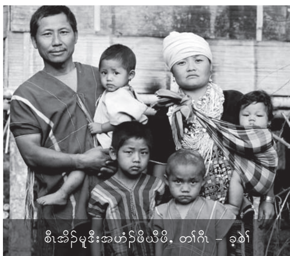
စီအိၣ်မူဒီးအဟံၣ်ဖိယီၤ, တံာ်ဂီ - ခုၣ်

နီၢ်ဖိသ့ၣ်, စီအိၣ်မူအမၤစံးဝဲဒုၣ်လၢ, “ယ ဝၤန့ၣ်တမ့ၢ်ပုၤလၢအထီၣ်ထီၣ်ဒါတံာ်နီၤတမံၤဘၣ် အဝဲ မ့ၢ်ဒုၣ်ပုၤသဝီဖိ, ပုၤထူလံၤဖိတဂၤလၢအဂုာ်လိာ်ဂဲလိာ် တံာ်လၢကမ့ၢ်အခါစး ဒဲးသိးဒီးထံဖိကီၢ်ဖိကအိၣ်မ့ၢ် အိၣ်ခုၣ်ဘၣ်အဂီၢ်လီၤ. အဝဲတဲဝဲဒုၣ်လၢကတီၢ်အံၤန့ၣ် ပခိၣ်ပနံၤတဲသကိးဝဲတံာ်မ့ၢ်တံာ်ခုၣ် ဇီးပဝဲကညီပုၤထူ