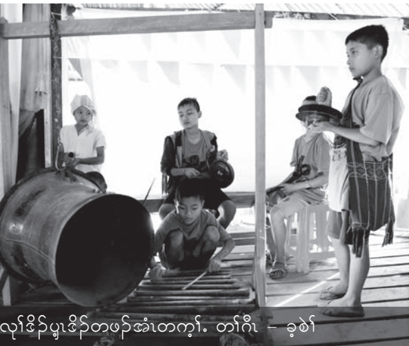
သံၣ်ခွဲၣ်ကတီၢ်က့ၤလုၢ်လၢထူသန့တၢ်ဆဲးတၢ်လၢလုၢ်ဒိၣ်ပုၤဒိၣ်တဖၣ်အံၤတက့ၢ်.