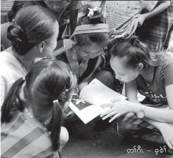
တက်ကီ - ခုဉ်