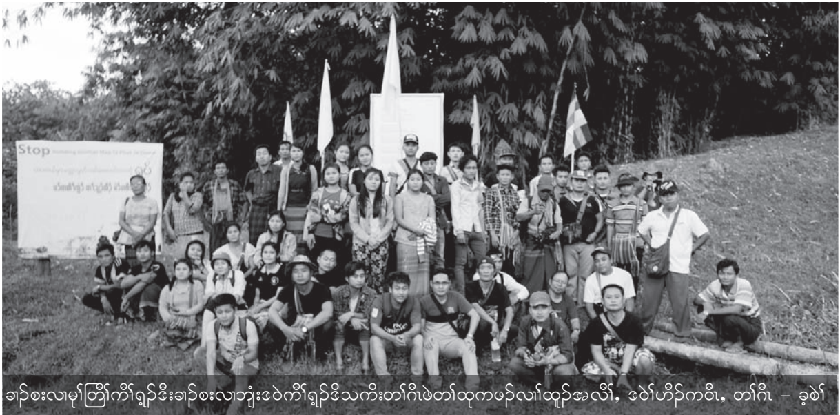
ခါာ်စးလါမုာ်တြီာ်ကီာ်ရျာ်ဒီးခါာ်စးလါဘျးဒဲာ်ကီာ်ရျာ်ဒိသကိးတါဂါဖဲတါထုကဖာ်လါထုာ်အလီာ်၊ ဒဲာ်ဟီာ်ကဝီ၊ တါဂါ - ခုဝဲာ်

လါတါလဲယုထံာ်သျာ်ညါမလိန့ာ်ဟါဘာ်ထွဲ ဒီးကီာ်ရျာ်ခဲဘျာ်အတါအိာ်သးအဖိခိာ် ခါာ်စးထံာ် ဘာ်ဝဲလါတါလီာ်ဆီလိာ်သးအိာ်ဝဲဒုာ်အါမးန့ာ်လီာ်။