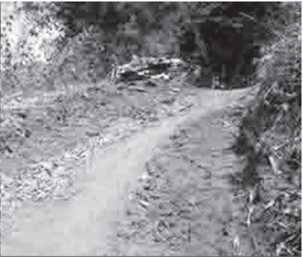
လီၢ်ကဝီဖိဟးထီၣ်ဟးလီၤကျဲမ့ၢ်ဖိလၢပယီၤသုး အဲၣ်ဒီးဘျီထီၣ်ဝဲဆူသိလ့ၣ်ကျဲမ့ၢ်, တၢ်ဂီၢ် - တံဟံၣ်စ့ သိလ့ၣ်ကျဲမ့ၢ်လၢပယီၤသုးဘျီထီၣ်ဝဲ, တၢ်ဂီၢ် - တံဟံၣ်စ့