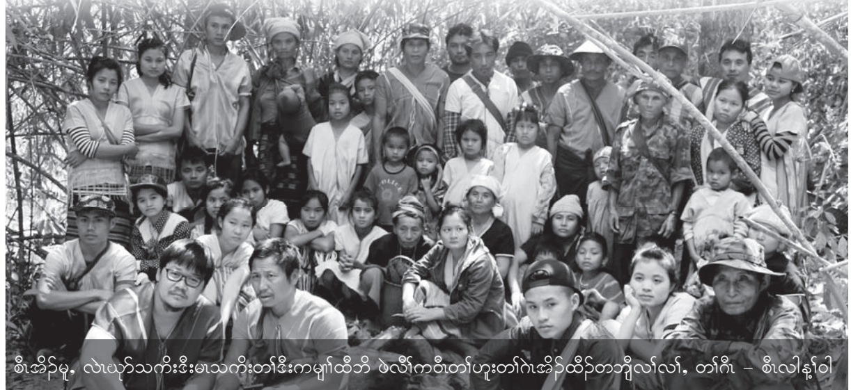
စီၤအိဉ်မ့ၢ်, လၢယုၢ်သကိးဒီးမၤသကိးတၢ်ဒီးကမ့ၢ်ထီဉ် ဖဲလီၢ်ကပီၤတၢ်ဟူးတၢ်ဂဲၤအိဉ်ထီဉ်တၢ်တၢ်လၢလၢ, တၢ်ဂီၤ - စီၤလါန့ၢ်ဝါ

တၢ်ပတၢ်ပြးအသီဟဲအိဉ်ထီဉ်တၢ်တၢ်ခိဉ်စိဒိဉ်က မိၤတဖၣ်ဟဲအိဉ်ထီဉ်ဝဲဒၣ်စ့ၢ်ကီးန့ၣ်လီၤ. ဒီဖျိတၢ်ဟံး န့ၢ်ဆူဉ်တၢ်စိတၢ်ကမိၤအယီၤ တၢ်သံတၢ်ပျၢ်လၢတကြး တဘၣ်တဖၣ်အိဉ်ထီဉ်ဝဲဒၣ်န့ၣ်လီၤ. လၢတၢ်သံတၢ်ပျၢ် အိဉ်ထီဉ်ဝဲအဖိခိဉ် ပုၤတတၢ်ဂ်ခိဉ်ထံးတဖၣ်လီၤသထြး