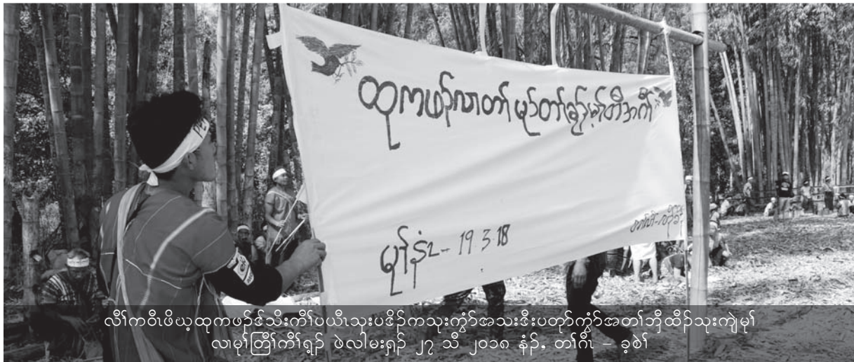
လီာ်ကဝီဖိဖဲထုကဖဉ်ဒီသီးကီဉ်ပယီသုးပဒီဉ်ကသုးကွံာ်အသးဒီးပတုာ်ကွံာ်အတၢ်ဘျီထီဉ်သုးကျဲ မုာ် လုမုာ်တြီဉ်ကီဉ်ရုဉ် ဖဲလါမးရှဉ် ၂၇ သီ ၂၀၁၈ နံဉ်. တၢ်ဂီဉ် - ခုဖဲ

တၢ်သ့ဉ်ညါဘဉ်လုနံဉ်လုအပုကွံာ်တဖဉ်န့ဉ် ကမုာ်တဖဉ် အိဉ်မုဖံးအိဉ်မုအိဉ် ဘုဉ်အိဉ်ဖိဉ်အိဉ် ဒီးအိဉ်ဘဉ်အိဉ်ဘဉ်ကူကူလုလုန့ဉ်လီဉ်. ဘဉ်ဆဉ်နဉ် သကုစးထီဉ်ဖဲ ၁၉၇၄ နံဉ်တုာ် ၂၀၁၀ နံဉ်န့ဉ်ကီဉ်ပယီ သုးဟဲထီဉ်ဒုးတုာ်ခုဉ်အဲဉ်ယုဉ်အဘျီတဖဉ်အဘျီဒီဉ်ဒီဉ် မုာ်မုာ်လုဟီဉ်ကဝီဖဲန့ဉ်အပုန့ဉ်လီဉ်. ပယီသုးတဖဉ် အံး မုသံမုဝီဝဲကမုာ်ဖိတဖဉ်, ခးသံကွံာ်ဆဉ်ဖိကီဉ် ဖိ, ဇွဲဉ်အူကွံာ်ဒုသဝီ ဟံဉ်ဃီဒီးမုဟးဂုာ်ဟးဂီတၢ် အိဉ်တၢ်အိ, ဒီးနီဃုာ်နီဃးဆုဉ်ကွံာ်ပှာတဘျီဘဉ်တ ဘျီလံန့ဉ်လီဉ်. ဒုသဝီဖိတနီဘဉ်ဃုာ်မုဟးဖျိဒီးကဲထီဉ် ပှာဘဉ်ကီဘဉ်ခဲလုကီဉ်ကွီဉ်တဲဉ်အပုန့ဉ်လီဉ်. ကီဉ်ပ ယီသုးမုာ်ဒီဉ်အတၢ်မုပယု ပှာဂုာ်ဝီခွဲးယာ်အနံဉ်လု အဆံတဖဉ် ဒုးအိဉ်ထီဉ်တၢ်သ့ဉ်တဘဉ်လီာ်ဘဉ်စးလု လီာ်ကဝီဖိဖဲန့ဉ်အဂီဉ် တုာ်ဒုဉ်လဲာ်အဝဲသ့ဉ်အတၢ်မံမိာ်