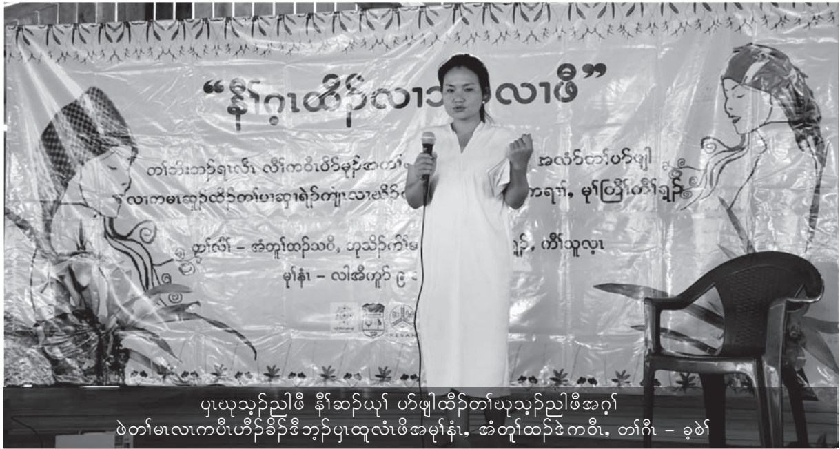
ပုၤယုသ့ၣ်ညါဖိ နီၣ်ဆၢၣ်ယုာ် ဟ်ဖျါထီၣ်တၢ်ယုသ့ၣ်ညါဖိအဂ့ၢ် ဖဲတၢ်မၤလၢကဝီၤဟီၣ်ခိၣ်ဒီဘျီပုၤထုလံၤဖိအမ့ၢ်န့ၣ်, အံၤထုၣ်ထီၣ်ဒ်ကဝီၤ, တၢ်ဂီၤ - ၁၁၆

ကျဲၤလၢအမၤလီၤတူၣ်, မၤဟးဂီၤ ဖိသ့ၣ်ခံအစၢၤတဖၣ်အိၣ်ဝဲဒ်အါမံၤအကျါ တၢ်မၤကမၤဖိလၢလီၤကဝီၤပုၤ ကမ့ၢ်စ့ၢ်ကီးကျဲၤလၢအဒုးအိၣ်ထီၣ်တၢ်ဂ့ၢ်ကီၤဆူဖိအတၢ်အိၣ်ယၢၤကလီၤစ့ၤ ဒီးဖိအကလုာ်တနီၤကလီၤတူၣ်သ့ၣ်သ့ၣ် မ့ၢ်လၢဖိကီးကလုာ်ဒဲးအိၣ်ဒီးအချံၤဒဲးဒီးတၢ်မၤကမၤအိၣ်မ့ၢ်အိၣ်ထီၣ်န့ၣ် တၢ်ဘၣ်ယိၣ်အိၣ်လၢအစၢၤကလီၤတူၣ်သ့ၣ်န့ၣ်လီၤ. အကတမံၤတၢ်မၤလဲးမ့ၢ်အူ မ့ၢ်တမ့ၢ် မ့ၢ်အူအိၣ်လဲးတၢ် မ့ၢ်အိၣ်ထီၣ်ဒီးဖိတဖၣ်လီၤမၤသ့စ့ၢ်ကီးန့ၣ်လီၤ. တၢ်ကူၣ်သ့ၣ်ကျဲၤသ့ၣ်တၢ်မၤစ့ၢ်ကီးမၤဟးဂီၤ, မၤလီၢ်မၤဒီးမၤသံကွံာ်ဖိန့ၣ်လီၤ. ဖိအကလုာ်လၢအကယၤ ဒီးသန့ၤထီၣ်အသးတၢ်လီၢ်လၢတဖၣ်သိးလိာ်သး, သ့ၣ်ထုၣ်လၢတဖၣ်သိးလိာ်သးဒီးဘိၣ်