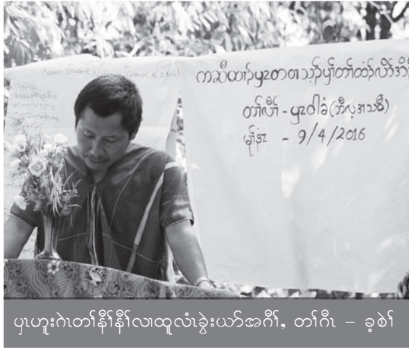
ပူဟုးဂဲတံာ်နီာ်နီာ်လဲထုလဲခွဲးယာ်အဂီ, တံာ်ဂီ - ခဲစဲ

စီအိာ်မုမုာ်စှ်ကီးလီာ်ကဝီပူတတဲခိာ်နဲတဂဲ လဲအသ့ာ်ဆုာ်သးဂဲလဲယိာ်လိာ်တံာ်မုာ်တံာ်ခုာ်ကရါ ပူ, လဲအမုာ်ဂံာ်ခိာ်ထံးကမုာ်စုလီဆိတံာ်ရဲာ်တံာ်က့ တခါလဲတံာ်ကဒဲအိာ်ထီာ်က့ကညီပူထုလဲဖဲအတံာ် ဒီသဒဲအလီာ်အက့လဲအအိာ် (၅,၄၀၀) စကွဲယါကံ လိမဲထာ်လဲအအိာ်လဲမုာ်တြီာ်ကီာ်ရဲာ်အပူန့ာ်လီ. စီအိာ်မုအံမုာ်စှ်ကီးယိာ်လိာ်တံာ်မုာ်တံာ်ခုာ်ကရါအ ကမံးတံာ်ဖိတဂဲဒီးနဲဝဲဒဲက့မုဆု လဲယိာ်လိာ်တံာ် မုာ်တံာ်ခုာ်ကရါအတံာ်မုာ်လဲကွာ်စီလဲတံာ်မုာ်တံာ်ခုာ်အ ဂီ, တံာ်ဒီသဒဲက့ဟုကယာ်က့တံာ်မုအါကလုာ်, ဒီး တံာ်ရဲာ်သဲကတီက့လုာ်လဲထုသန့ဒီးတံာ်ဆဲးတံာ်လဲ သ့ာ်တဖှ်န့ာ်လီ. ဖဲတံာ်မဲကမုာ်တံာ်က့လိာ်တံာ်ပီာ်