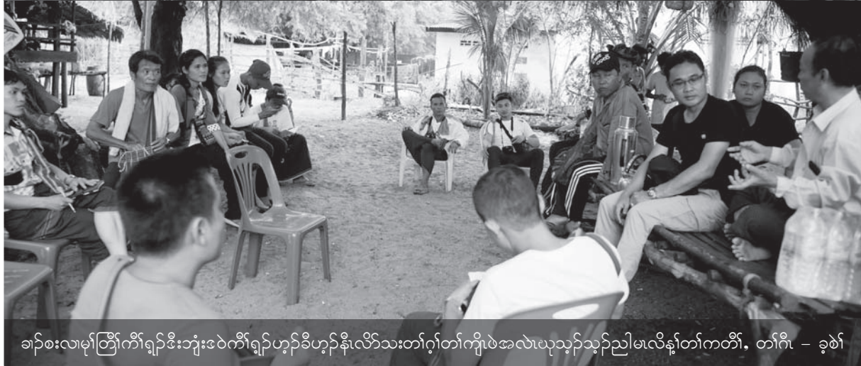
ခါာ်စးလးမ့ာ်တြီာ်ကီာ်ရျာ်ဒီးဘျးဒဲာ်ကီာ်ရျာ်ဟ့ာ်ခီဟ့ာ်နီာ်လိာ်သးတါဂုာ်တါကျိာ်ဖဲအလဲယုသ့ာ်ညါမးလိန့ာ်တါကတီာ်, တါဂီ - ခုစဲာ်