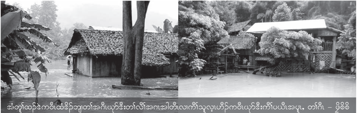
အံၤတူၢ်ထၣ်ဒဲကဝီၤခိၣ်ဘျီတံၢ်အဂီၢ်ယုာ်ဒီးတံၢ်လီၢ်အါတီၤလကကီၢ်သုလုဟီၣ်ကဝီၤယုာ်ဒီးကီၢ်ပယီၤအပုလ, တံၢ်ဂီၢ် - ဖြဲစိစိ

တနံၣ်အံၤလကညီကီၢ်စဲာ်တံၢ်လီၢ်အါတီၤအပုလ တံၢ်စူၤထံၣ်ဒိၣ် ဒီးဟီၣ်ခိၣ်လၢ်အါန့ၢ်ဒီးနံၣ်လကအပုလကွံၣ် ဒီးတုၤထီၣ်လကတံၢ်သံတံၢ်ပုၤအိၣ်ထီၣ်စ့ၢ်ကီးန့ၣ်လီၤ. ■