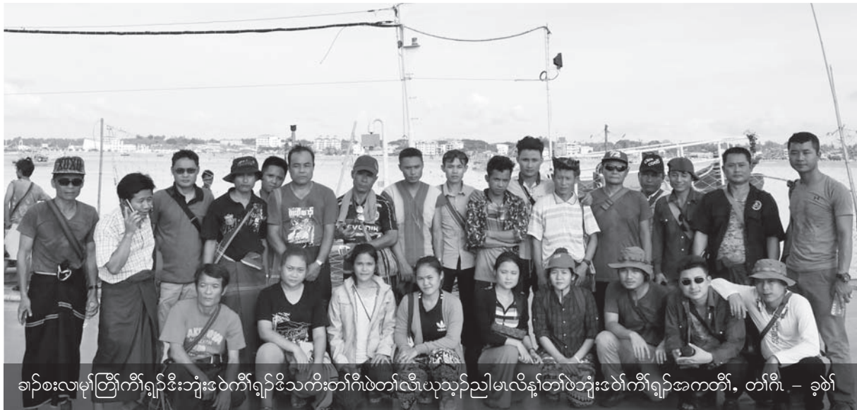
ခါာ်စးလးမ့ာ်တြီာ်ကီာ်ရျာ်ဒီးဘျးဒဲာ်ကီာ်ရျာ်ဒီသးကီာ်ဂီဖဲတါလီယုသ့ာ်ညါမးလိန့ာ်တါဖဲဘျးဒဲာ်ကီာ်ရျာ်အကတီာ်, တါဂီ - ခုစဲာ်

ဒဲာ်ဒီးမ့ာ်တြီာ်အခါစးတဖာ်အံာ် တါကဲဘျးအိာ်ဝဲဒ်လး, ခါာ်စးလးဘျးဝဲာ်တဖာ် အဲာ်သ့ာ်အတါထံာ်ဆီတလဲအိာ်ထိာ်ဝဲလး ကဘာ်ကတီာ်ကျဲာ်အိာ်ယးန့ာ်ဆာ်တါအိာ်ယး, လုာ်လါထုသန့ဒီးတါဆဲးတါလးလးကအိာ်ယုာ်အိာ်ကဒီးအဲာ်သ့ာ်အဂီာ်န့ာ်လီာ် ဒ်န့ာ်အသးခါာ်စးလးမ့ာ်တြီာ်တဖာ်စ့ာ်ကီာ် အဲာ်သ့ာ်ထံာ်ဘာ်ဝဲတါဂုထိာ်ပသီထိာ်တါဖဲးတါမးလးဘျးဒဲာ်ပူအံာ် ကဲထိာ်အဲာ်သ့ာ်တါကီာ်တါဂီဒီးဒုးထိာ်ဟူးထိာ်ဂဲာ်ထိာ်အဲာ်သ့ာ်အသး လးကဘာ်ကျဲာ်ဒီးဒီသးအါဆီကျဲာ်ဟီာ်ကဝီအဂီာ်န့ာ် စီာ်မးဘျာ်ထုစံးဝဲန့ာ်လီာ်. ■