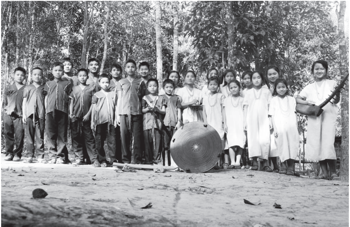
ဒုးဆူၣ်ထီၣ်, မၤဒိၣ်ထီၣ်ထီၣ်က့ၤသန့ဆဲးလၢကွီဒ်သိးကအိၣ်သ့ၣ်ဆီလီၤသးဂၢ်ဂၢ်ကျၢကျၢဒီးကဲထီၣ်ဒိဂ့ၤတဲာ်ဘၣ် ဒီးကစိာ်မူစိာ်ဂဲၤဘၣ်ပပုၤကညီဒီတကလုာ်အထူသန့တၢ်ဆဲးတၢ်လၢန့ၣ်တက့ၢ်, တၢ်ဂီၤ - တံညၣ်ကံၢ်

“ဆူထံခံဖိတၢ် ပကတၢ်ထီၣ်ပချံဖိအံၤယုၤန့ၣ်နီၤ.”