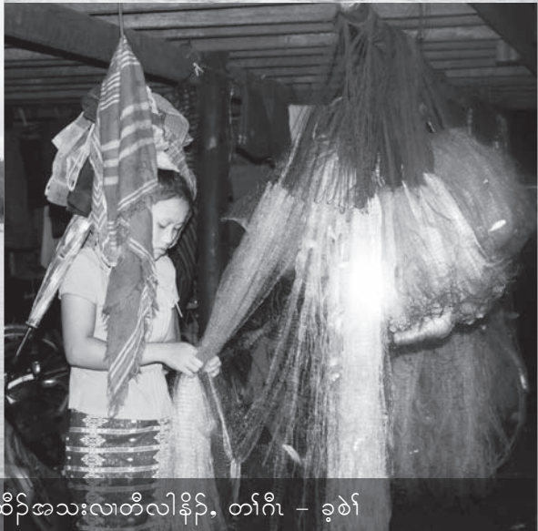
လီၢ်ကဝီၤဖိလုၢ်အိၣ်အသးသမူဒီးဒီးသန့ၤထီၣ်အသးလၢတီၤလါနီၣ်