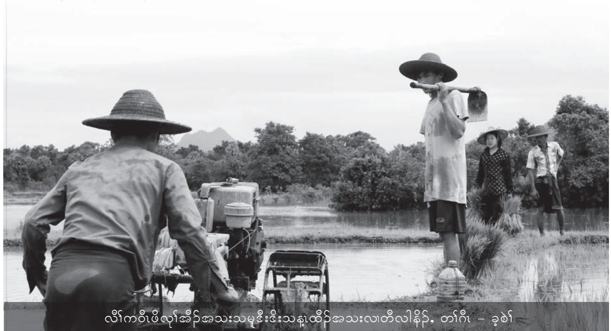
လီၢ်ကဝီၤဖိလုာ်အိၣ်အသးသမူဒီးဒီးသန့ၤထီၣ်အသးလၢတီလါနီၣ်

လၢတီလါနီၣ်အံၤအပျၢန့ၣ်တၢ်မူအါကလုာ်အိၣ် သကိးဝဲဒီး လီၢ်ကဝီၤဖိတဖ၂်ဟ်ဖျါဝဲလၢ အထံၣ်န့ၢ်ဝဲ ညၣ်ကလုာ် (၃၀) သးဆံဘျဲၣ်, ထီၣ်အကလုာ်အစ့ ကတၢ်ယံၢ်ဆံ (၅၀) ဒီးဆၣ်ဖိကီၢ်ဖိအကလုာ်အဂၤအါ မး ဒီးတၢ်မူအကလုာ်လၢအအိၣ်ဝဲဒၣ်လၢတၢ်ဘၣ်ယိၣ် လၢအစၢၤကလီၤတူၢ် လၢတၢ်ဟ်ပနီၣ်အိၣ်လၢဟီၣ်ခိၣ်ဘီ