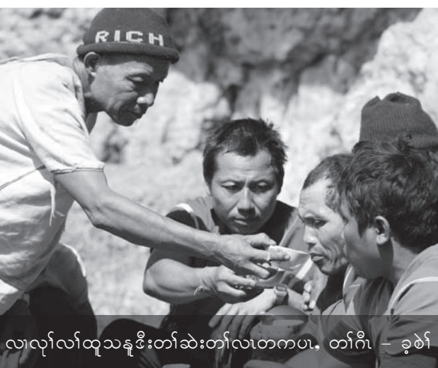
လၢလုာ်လၢထူသန့ဒီးတံာ်ဆဲးတံာ်လၢတကပ, တံာ်ဂီ - ခုၣ်