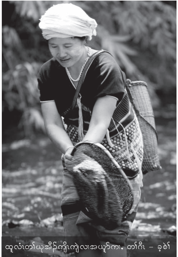
ထူလံတံယုအိဝဲကျိကျဲလောယုာ်ကော, တံဂီ - ခုစဲာ်

သးပုာ်စီမီလါ စဲးဝဲလော, “ ဒုသဝီတံလီကိးတံ မုာ်ယုအိဝဲယာ်အိဝဲသကိးဆဲးဖိကီဖိ ဒုဒ်ဖိညုဒ်ဖိလောတဘဲဒ်ဘျးဘဲဒ်ဒါဘဲဒ်န့ ထံကျိတဖ်ကဟးဂီကွာ်, ဒုဒ်ဖိညုဒ်ဖိကလုာ်ကွာ် ဒီးပမအိဝဲဆုညါအဂီတအိဝဲလောဘဲဒ်. ပမုာ်အဲဒ်ဒီးအိဝဲန့ ပမအိဝဲသုဒီးပကတံအါကဘဲဒ်သုစုာ်ကိးန့လီ. တဘျီဘျီပသုညါဒုထဲ ပကအိဝဲအါဒီး လောပကသုကတံအါဒ်သိးဆုညါ ပမအိဝဲအါကသုအဂီ ပတဆိကမိဒ်ဘဲဒ်. ပုသးပုာ်စဲးဝဲ အိဝဲဒုဒ်ကတံလု, အိဝဲညုဒ်ကတံကွာ်, တံလောပသုအါ ပအိဝဲအါခဲလုာ်န့ ပကဘဲဒ်သုဒီးသဒကတံအါန့လီ.”