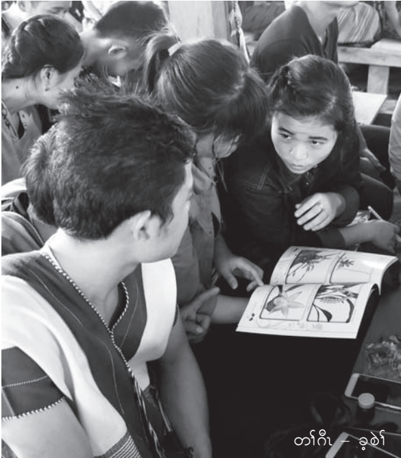
တက်ကီ - ခုဉ်