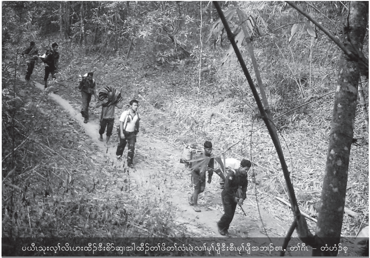
ပယီၤသုးလုာ်လိၤဟးထီၣ်ဒီးစိာ်ဆုၤအါထီၣ်တၢ်ဖိတၢ်လံၤဖဲလၢမ့ၢ်ပျီဒီးစိာ်ပျီအဘၣ်စၢ. တၢ်ဂီၤ - တံဟံၣ်စ့

ခိဖျိလၢဒၣ်ဒါတဖၣ်ဟဲထီၣ်ဒီးမၤဟးဂီၤပဝဲပုၤ ထူလံၤဖိတဖၣ်အဒူလီၤသံၣ်လီၤ, တၢ်လီၤတၢ်ကျဲဒီးအ သ့ၣ်ခိၣ်ဝဲခိၣ်. ဒူသဝီ ထံကျိထံကွာ်သ့ၣ်ဒိၣ်ဝဲပုၤ အယီၤ ပတအဲၣ်ဒီးလၢတၢ်ဟးဂုာ်ဟးဂီၤသ့ၣ်တဖၣ်အံၤ ကမၤအသးအါထီၣ်လၢပဟီၣ်ကဝီပတၢ်လီၤတၢ်ကျဲ လၢဘၣ်. ပဝဲထူလံၤဖိတဖၣ်ပအိၣ်မုၤသ့ၣ်လၢပျံၤပူၤ, ပလုာ်အိၣ်ပသးသမ့, ပဒီးန့ၣ်ထီၣ်ပသးသ့ၣ်ဒၣ်ထဲလၢ ပျံၤပူၤလီၤ. ဒ်ပဒီးသန့ၣ်ထီၣ်ပသးဒီးသ့ၣ်ပုၤဝဲပုၤအသိး ဒ်ပတၢ်သ့ၣ်ညါ, တၢ်ကုၣ်သ့ၣ်လၢအလီၤစၢလၢမိၢ်ပံၤဖဲ ထူလံၤအစိၤလံၤလံၤတဖၣ်အံၤ, သံဂုၤမုၤဂုၤ ပကဂုာ်ကျဲး စးအံးထွဲကွၢ်ထွဲဒီးကတိၤအီၤန့ၣ်လီၤ. ယအိၣ်တ့ၢ်ဒီး ယတၢ်မံမိၢ်လၢမ့ၢ်တနံၤ ပကအိၣ်ဘၣ်လၢပထံလီၤကီၢ် ပူၤမ့ၢ်မ့ၢ်ခၣ်ခၣ် ပူၤဖျဲးဒီးတၢ်ဘၣ်ကီၢ်ဘၣ်ဂီၤအကလုာ် ကလုာ်တဖၣ်န့ၣ်လီၤ. ■