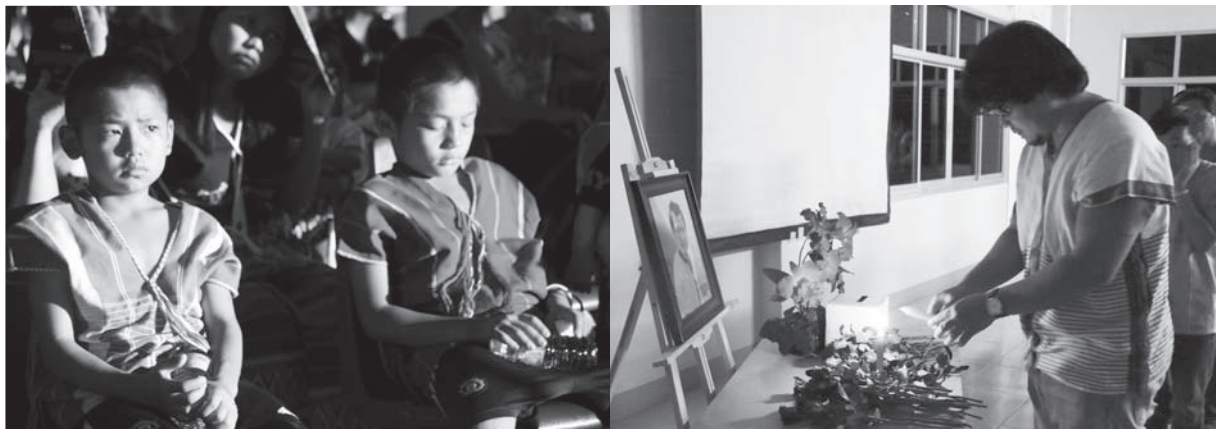
စီအိန်မုအဖိခွါဖဲတဲဟ့န့ယုဃိန်ဟ့န့လါဟ့န့ကဝီမုးကတီ, တဲဂီ - ခဲစဲ

လါပဝဲကညီဖိခိန်ယါဒီးပုဂုဝီတဲမပုဘျး ဖဲကရါ (ခဲစဲ) ဒီးကညီပုထူလံဖဲလါအအိန်လါမုတြီ ခဲလါအဂီ, စီအိန်မုအတဲသံအံ့မုတ်သဒုးသပျီ လါတဲထဲထီဖျဲလါအဂုတသ့ဘာန်တခါန့လီ. လု တက့ပတသါပုနီအဝဲအတဲဟ့န့လီအသးဒီးတဲ ဂဲလိတ်လါတဲသ့ထီကတဲမုတ်တဲခုန်ဒီးတဲဒီသဒါ ကမ္မာပံဖဲဖုအဟီခိန်ကပံတဲလီတဲကျဲဘာန်. ဒ်န့ အသိးပဝဲအာပဲသီဝဲဒုတ်ပယီသးအတဲမအါမသီ ရါရါစါစါလါအတဲအိန်ဒီးတဲဟဲကဲဒီးတဲဟဲလုဟဲ ပုလီကဝီကမ္မာအသးသမုသ့တဖန်န့လီ. ပယီ သးသ့တဖန်မုတဲမဟးဂီတဲထံကီဒီတဘွန်တဲပ တုတဲခဲအတဲအာန်လီအီလီ ဒီးမုတဂုလိတ်တဲဝဲ ကယုန့လါဘျါလီကွံတဲဘာန်ဂံဂုတဖန်ဒ်တဲယု လီဘျါလီတဲဂုလိတ်ဘျါလိတ်တဲဖဲတဲမအကျိအကျဲ အသိးဘာန်န့, တဲသဒုးသပျီလါအဟဲကဲထီအသး ဒ်အံ့တမဲန့တဲဟးဆုးတဲအါကသ့ဝဲဒုန်န့လီ. ■