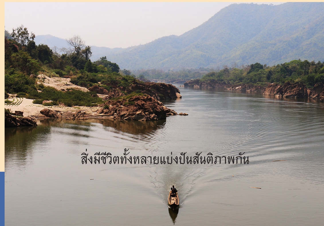
สิ่งมีชีวิตทั้งหลายแบ่งปันสันติภาพกัน

วิสัยทัศน์เพื่อภูมิภาคที่ชนเผ่าพื้นเมืองกะเหรี่ยง แห่งความบรรสานสอดคล้องระหว่างมนุษย์-ธรรมชาติ ในเมียนมาร์ตะวันออกเฉียงใต้