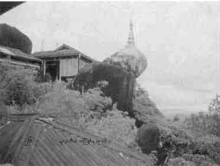
ကွဲးထံးလုၢ်-အီဉ် လၢမ့ၢ်န့ဉ်ကစၢ်အ လီၤ. ဆီထံးကီၢ် ဆဉ်. တၢ်လီၤကဝီၤ အံၤသ့ဉ်ပုၤတီဉ်ဒီဉ်မၤ. ဝဲအံၤတၢ်မၤဆီဉ်ဟ့ဉ် သ့ဉ်ဘျးကတုၢ်ထီဉ်ဆူ ထီဉ်တဖျဉ်အံၤအစီဉ် ထံးလဲ. တၢ်မံၤလုာ် လၢအစီဉ်လုၢ်ဒီတဖဉ် ဟဲသုးထီဉ်အသးဆူ ကစၢ်ဒီခိဉ်လဲ.

မးထီဉ်လၢသုးပဒီဉ်သ့ဝဲဒေၣ် “ဒီဉ်လုၢ် ဒီဉ်” အသန့န့ဉ် နူဖိသဝီဖိတဖဉ်ဘဉ်တၢ် သုးက့ၢ်အလီၤအကျဲဒီး ဘဉ်ဟံးတုၢ်က့ၢ်အ ဟီဉ်ခိဉ်ကပံာ်. အတၢ်ဖိတၢ်လံၤတဖဉ်ဒီး ဘဉ်လဲၤအီဉ်ဝဲတၢ်လီၤလၢန့အဖသုးပဒီဉ် ဟံးပနီဉ်န့ဉ်အဝဲသ့ဉ်အလီၤန့ဉ်လီၤ. တက တီၢ်ယီ ဒီဖျိဟီဉ်ခိဉ်ကပံာ်တလၢတလီၤလၢ တၢ်ကဖဲးစ့ၢ်ဖဲးသံဉ်. ကသ့ဉ်အီဉ်ဖျးဆီဉ် ဘုဉ်အီဉ်ဖိဉ်အီဉ်တၢ်လၢပုၤကီးဂၤအဂီၢ်အ ယီ နူဖိသဝီဖိတဖဉ် ဘဉ်က့ၢ်ဆဉ်မဲာ်ဒီးတၢ် ကီၤတဲလၢဒီးက့ၢ်ဘဉ်. အဝဲသ့ဉ်တဖဉ်စ့ၢ် ကီးမ့ၢ်မၤဆီဉ်စံာ်ဂုၢ်. ခုးဂုၢ်. ဘဉ်ဟ့ဉ်ကဒီး တၢ်ခိတၢ်သ့လၢ သုးပဒီဉ် ဒီးခိဉ်ဖျဉ်ဘီတ ဖဉ်ယုာ်န့ဉ်လီၤ. ဟီဉ်ခိဉ်ကပံာ်တဂုၢ်အယီ ပုၤသဝီဖိတဖဉ်စံးဝဲလၢ ဘုတအကၢ်အဖိ ခိဉ်မၤန့ဉ်ထဲဘု ၁၅ န့ဉ်လီၤ. ဘဉ်ဆဉ် အဝဲသ့ဉ်ဘဉ်ဟ့ဉ်တၢ်ခိတၢ်သ့လၢပယီၤသုး အဆီဉ်တနံဉ် ဘုတအကၢ် ၁၂ န့ဉ်အယီ အဝဲသ့ဉ်အီဉ်တလၢဘဉ်.