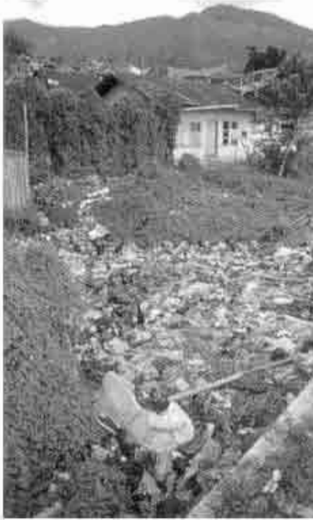
တၢ်တဖၣ်တဖၣ်အါ အိၣ်ဝဲဒၣ်လၢနီၣ်ထီၣ်ပအဆဲးလၢ မံၤဟ့ၣ်သ့ၣ်ဖျိအကဟး, စၢရၣ်မး, ကလံၤဒီးစုၤမၤအိၣ် ကီၢ်, ကီၢ်အုၣ်ဒိၣ်န့ၣ်. တၢ်တဆၣ်တဖၣ်အါ မၤ ဘၣ်အါဝဲဒၣ်ဖျိတၢ်ကွံၣ်ဒီးခိၣ်ယၢ. ဟဲဝဲလၢတၢ်သ့တၢ်စ့ တၢ်အယီၤန့ၣ်လီၤ.

န့ၣ်သးကွံၣ်တၢ်ခိၣ်ထီၣ်ထီၣ်ဒီဖျိလၢမဲးဖိက ဟၣ်အတၢ်သ့တၢ်ဘၣ်တဖၣ်ခိၣ်ထီၣ်လဲၣ်ထီၣ် လၢကဘၣ်သ့ၣ်န့ၣ်န့ၣ်ဝဲတၢ်ထူးတီၤအိၣ်ယၢ တဖၣ်လၢကျဲၣ်လဲၣ်န့ၣ်လီၤ. လၢဟီၣ်ခိၣ်ချာအံၤ ပုၤနီၣ်ဂံၢ်အကကွံၣ် ဘျီန့ၣ်ကဒီးသမ့အသးလၢန့ၣ်ဆၣ် ထူး တီၤအိၣ်ယၢအဖိခိၣ်တၢ်ခွဲးတၢ်ယၢတအိၣ် လၢအဝဲသ့ၣ်အဂီၢ်ဘၣ်. ပုၤဖိသ့ၣ်တဖၣ်တ နံၤဘၣ်တနံၤသံကွံၣ်ဝဲအဂၤတကလၢလဲၣ် ယၣ်ဒီဖျိတၢ်အိၣ်တၢ်အီၤထူးအယီၤလီၤ. ဟီၣ်ခိၣ်ချာတၢ်သ့တၢ်သ့ၣ်လၢအဟးထီၣ်သၢ ပုၤတပုၤန့ၣ်ဘၣ်တၢ်သ့အီၤဒ်အမ့ၢ်ဆၣ်ဖိကီၢ်ဖိ တဖၣ်အဆၣ်လၢပုၤကဲခိၣ်တဖၣ်ကအိၣ် ဘၣ်ဝဲတၢ်ဖဲးတၢ်ညၣ်ဝဲဝဲဝဲဘဲဘဲအဂီၢ်လီၤ. သ့ၣ်ပုၤအါမးဘၣ်တၢ်ကွံၣ်ဖျိကွံၣ်အီၤဒ်သိး တၢ်ဘျီဆၣ်ဖိကီၢ်ဖိကသ့အဂီၢ်န့ၣ်လီၤ. ပဝဲကီးဂၤဒီး လၢတၢ်တဟ်သ့ၣ်ဟ်သး ဘၣ်အပူၤန့ၣ် ပမၤဟးဂီၤကွံၣ်န့ၣ်ဆၣ်တၢ် အိၣ်ယၢအါမးသ့ဝဲဒီဖျိတၢ်သ့တၢ်စ့ၣ်လၢအ မိၣ်န့ၣ်သးကွံၣ်တၢ်အသမ့အယီၤန့ၣ်လီၤ. အဒိ အဘူးကတၢ်ကီးမ့ၢ်နံၤဒီးန့ၣ် ပလဲၤပုၤတၢ် ဒီး ဟဲက့ၤစိၣ်မျးစတံး ထၢၣ် (ကီၣ်တံး စၢ)ဆူပဟံၣ်န့ၣ်လီၤ. ယံၣ်ထီၣ်အါထီၣ်ဒီး လၢခဲကဲထီၣ်တၢ်တယီၣ်တယၢ မၤဘၣ်အါ ဘၣ်သီထီၣ်ပခိၣ်ပယၢန့ၣ်လီၤ. မျးစတံး ထၢၣ်ကကဲထီၣ်အဂီၢ် လိၣ်ဘၣ်ကဲကသံၣ်တ ဖၣ်လၢအဟဲလၢရၣ်နီၣ်သီ ဒီးန့ၣ်ဆၣ်ကဲသ ဝဲအဆိၣ်န့ၣ်လီၤ. နသ့မျးစတံးဒီးအါ တၢ် ကဘၣ်မ့ၣ်ထူးထီၣ်ရၣ်နီၣ်မ့တမ့ၢ် န့ၣ်ဆၣ် ကဲသဝဲဒီးအါ ဒီးမိၣ်ယၢကဟးဂီၤဒီးခိၣ် ထီၣ်န့ၣ်လီၤ. တုၤပသ့အီၤဝဲဒီးတၢ်ကွံၣ် အီၤတစုန့ၣ် ကဲထီၣ်ကဒီးတၢ်ကွံၣ်အတၢ်ဘၣ် အါဘၣ်သီ-မျိတယံတလၢလၢပပုၤတဝါအ ကီၢ်န့ၣ်လီၤ. မျးစတံးကကျၣ်ဒီးဟးဂီၤကွံၣ် န့ၣ် ဟံးတၢ်ဆၢကတီၢ်ယံၣ်ဒိၣ်မး. နမ့ၢ်န့ၣ်