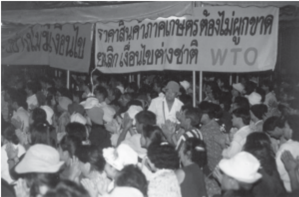
ကျိၣ်တဲာ်ပူထုစံၣ်ဖိသ့ၣ်နီၢ်ထံစံၣ်ပနီၣ်လၢကတၢၤကွံာ်ကီၢ်ချၢအတၢ်ကျဲၣ်လၢၣ်မၤကၤတၢ်ဘျီတဖၣ်

ဒုၣ်ကမၤန့ၣ် ညီၣ်နီၢ်ကျဲးစးဆါဝဲသ့ၣ်ဖျါပနံၣ်ဒ်အမ့ၢ်ဘု, ကံဖဲ, မ့တမ့ၢ်အံၤသ့ၣ်ဆါန့ၣ်လၢ. အဝဲသ့ၣ်ဘၣ်ပျဲလိာ်အသးတကီၢ်ဒီးတကီၢ်လၢကထုးထီၣ်ပနံၣ်သ့ၣ်တဖၣ်အံၤအါထီၣ်အါထီၣ်န့ၣ်လၢ. ဘၣ်ဆၣ်, အခါဖဲဘုသ့ၣ်တဖၣ်အိၣ်ဝဲဂီၢ်မ့ၢ်ဂီၢ်ပၤလၢဟီၣ်ခိၣ်အကျးအပူတဘျီလံၤန့ၣ်, ဘုသ့ၣ်တဖၣ်အပူလၢလၢ. ထံ ကီၢ်လၢအလဲထီၣ်လဲထီၣ်အဖဲမၤမ့ၢ်တဖၣ်အပူထုစံၣ်ဖိအါမးန့ၣ် ဆါက့ၤအဘုဒ်အကမၤပူကၤကလံၤတန့ၢ်လၢ ဘၣ်. အဝဲသ့ၣ် ပြုလိာ်အသးဒီးထံ ကီၢ်လၢအလဲထီၣ်လဲထီၣ်တဖၣ်အတၢ်ဆါဘုအပူတန့ၢ်ဘၣ်န့ၣ်လၢ. မ့ၢ်ထံ ကီၢ်လၢအလဲထီၣ်လဲထီၣ်တဖၣ်ဒ်အဖဲရကၤ