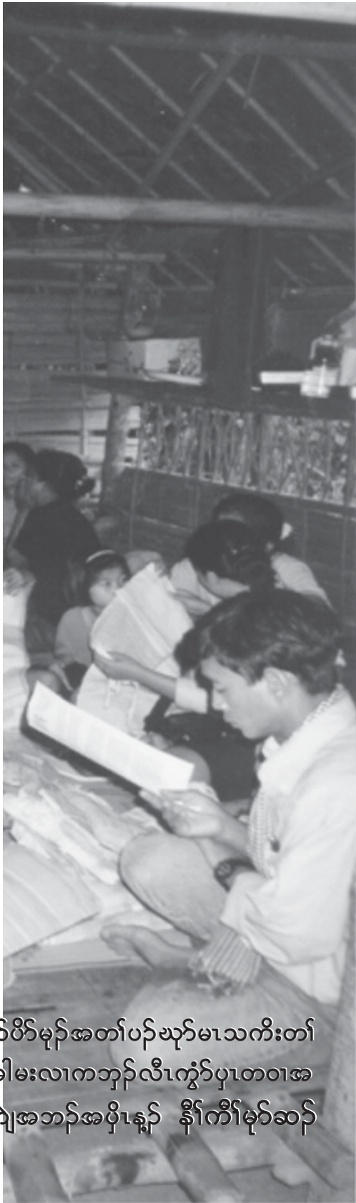
တၢ်ပိၣ်မ့ၣ်အတၢ်ပၣ်ဃုာ်မၤသကိးတၢ် တၢ်အိၣ်အိၣ်မးလၢကဘျၢၣ်လီၤကွၢ်ပှၤတၢ်အ လၢကွၢ်အဘၣ်အပိုၤန့ၣ် နီၣ်ကီၢ်မ့ၣ်ဆၣ် တၢ်

သကိးတၢ်ဒီးသဝီဖိတဖၣ် ဒီးထူးထီၣ်ဝဲလံာ် လဲၣ်ဘၣ်ဃးကညီဖိအလုလၢထုသန့အတၢ် ဆဲးတၢ်လၢ၊ တၢ်ဖဲးစးစးသံၣ်အထုသန့. ဒု သဝီ အတၢ်သိၣ်တၢ်သီ ဒီးတၢ်သံၣ်ခွဲၣ် က တီၤက့ၤန့ၣ်ဆၣ်တၢ်ထူးတီၤဆိၣ်ယၢအဂ့ၢ်အ ကျိၤသ့ၣ်တဖၣ် လၢကညီပျီၣ်ကျိၣ်ဒီးကွၢ် တဲၣ်ကျိၣ်န့ၣ်လီၤ. တၢ်ဂ့ၢ်တၢ်ကျိၤအမ့ၢ်အ တီၢ်ဘၣ်တၢ်ရၤလီၤအိၣ်လၢပှၤတၢ်အနီၣ်က စၢ်ဒၣ်ဝဲအယီၤ တမ့ၢ်ပဒိၣ်တၢ်ကရၢကရီ (NGO) တဖၣ်မ့ၢ်ဂ့ၢ်, ကွၢ်တဲၣ်ထံဖိကီၢ်ဖိ တဖၣ်မ့ၢ်ဂ့ၢ်, ဖးဘၣ်ဝဲ ဒီးပှၤတၢ်နီၤယဲယု သ့ၣ်ညါလီၤတၢ်ဂ့ၢ်တၢ်ကျိၤဒီးရၤလီၤက ဒီးဝဲတဆိဘၣ်ဆိအယီၤ, တုၤခဲအံၤအဝဲသ့ၣ် ဆိၣ်ဘၣ်ဒဲးဝဲလၢအဒုသဝီန့ၣ်လီၤ. တၢ်လၢ ယဟံးအခီပညီဖဲအံၤန့ၣ် ပှၤတၢ်တခါက ဆိၣ်စံၣ်ဆိၣ်ကျၢၤဒီးကလဲၤထီၣ်လဲၤထီၣ်န့ၣ် ဒီးသန့ထီၣ်အသးလၢပိၣ်မ့ၣ်တဖၣ်အတၢ် ပၣ်ဃုာ်မၤသကိးတၢ်လၢတံးတံးမၤကိးက ပၤဒဲးအပူၤန့ၣ်လီၤ.