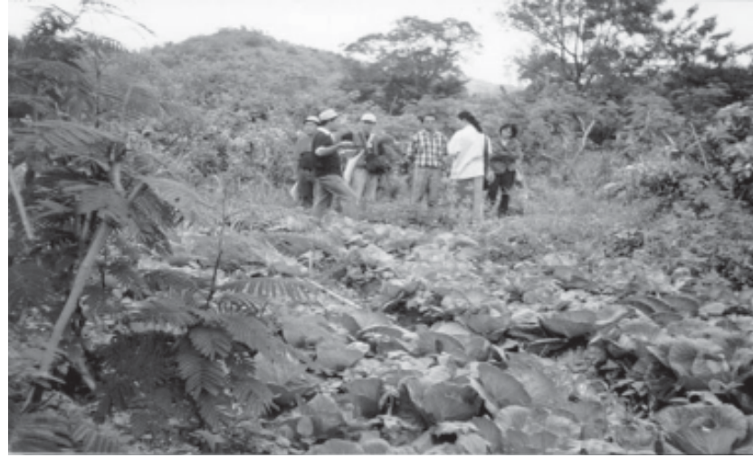
သရၣ်ဖးယိၣ်(ပုၤသိၣ်လိန့ၣ်ခိၣ်စၢ်အန့ၣ်ဆၢၣ်ခိၣ်ယၢၤတၢ်မၤလိ) တဲယုၤပုၤဟးမၤလိတၢ်ဖိဘၣ်ဆးအန့ၣ်ဆၢၣ်သ့ၣ်ဖျးကရၢၢ်လၢအဆိလီၤဝဲဒ်သိးကကထီၣ်တၢ်အဒိအတဲာ်လၢယူဟံၣ်ဒါသဝီဖိလၢအသ့ၣ်ကကသံၣ်တၢ်သ့ၣ်တၢ်ဖျးတဖၣ်အဂီၢ်န့ၣ်လီၤ.

လၢတၢ်လဲၤဒိတကတီၢ်ညါအပူၤပထံၣ်ဘၣ်လၢဒိဖျိတၢ်ကွၢ်ဒၣ်ထဲမ့ၢ်ကျဲၤဝဲၤကွၢ်အတၢ်လဲၤထီၣ်လဲၤထီၣ်တကယၤဒုအယီၤန့ၣ်ဆၢၣ်တၢ်ထူးတီၤအိၣ်ယၢၤတဖၣ်ဘၣ်ဟးဂုၢ်ဟးဂီၤဒီးလီၢ်ကဝီၤကမ့ၢ်တဖၣ်ဘၣ်ကွၢ်မဲာ်ဒီးန့ၣ်ဆၢၣ်ခိၣ်ယၢၤဒီးပုၤဂုၢ်ဝီတၢ်ဂုၢ်ကီၢ်အါမးန့ၣ်လီၤ. ကျဲၤလၢကကြိဆၢကွၢ်မ့ၢ်ကျဲၤဝဲၤကွၢ်အတၢ်လဲၤထီၣ်လဲၤထီၣ်အလၢသဟီၣ်လၢအဆူၣ်အံၤကန့ၢ်အဂီၢ်န့ၣ်အိၣ်ဒ့ၣ်တၢ်ဒုးအိၣ်ထီၣ်, တၢ်မၤဆူၣ်ထီၣ်မ့ၢ်တမ့ၢ်တၢ်မၤလဲၤထီၣ်လဲၤထီၣ်လီၢ်ကဝီၤပုၤတတၢ်န့ၣ်လီၤ. ဒ်(TVS) အတၢ်လဲၤဒိဖျိလၢအနံၣ်၂၀အတီၢ်ပုၤအိၣ်အသိးလီၢ်ကဝီၤအတၢ်လဲၤထီၣ်လဲၤထီၣ်ထီၣ်စံးတၢ်န့ၣ်ပုၤကညီၣ်အတၢ်လဲၤထီၣ်လဲၤထီၣ်ကဘၣ်ဟဲလၢဆိဝံၤမးတၢ်ဖိတၢ်လဲၤအတၢ်လဲၤထီၣ်လဲၤထီၣ်ကဘၣ်ဟဲလၢခံန့ၣ်လီၤ. ထဲန့ၣ်မးကမ့ၢ်တၢ်လဲၤထီၣ်လဲၤထီၣ်လၢအဂါအကျၢသ့ဝဲန့ၣ်လီၤ. ■