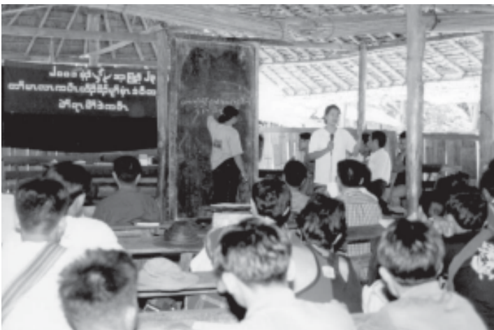
ဟီဉ်ခိဉ်မုာ်နံၤန့ဉ် ၂၀၀၀ ဝဲမၤရၢဖိဒဲကဝီၤ, လၢခုဉ်အနံဉ်စံဉ်ကွံာ်တီၢ်ခိဉ်ရိၣ်ဝဲဒ် အိဉ်ဃုဉ်ဒီးတၢ်ကတီၢ်တၢ်ပိဉ်သကိးထံအတၢ်ဂုၤကီၢ်လၢဒဲကဝီၤအပူၤ

ဆၢဝဲလၢအိဉ်ဝဲ ၁၄၀ ဘုဉ်ဒီးပုၤနီဉ်ဂံၢ်ဝဲလၢအိဉ်ဝဲ အကကွံာ် ၂၀၀ ဂၤယုဉ်ယုဉ်န့ဉ်လီၤ. ဝဲနံဉ် ၂၀၀၀ တၢ်မၤလၢကပီၤဟီဉ်ခိဉ်မုာ်နံၤအမုးန့ဉ် ပုၤလၢအပဉ်ယုဉ်အိဉ်ဝဲပုၤ ၅,၀၀၀ ဖု လၢထံကီၢ် ၁၈၃ဘုဉ်အပူၤ(ကညီဘဉ်ကီဘဉ်ဝဲဒဲကဝီၤဘဉ်တၢ်ဂံၢ်ယုဉ်အီၤ) ဒီးတနံဉ်ဘဉ်တနံဉ်န့ဉ် ပုၤပဉ်ယုဉ်လၢတၢ်မၤလၢကပီၤဟီဉ်ခိဉ်မုာ်နံၤအမုးအံၤအါထီဉ်ဝဲကွံာ်ကွံာ်န့ဉ်လီၤ.