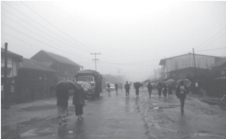
တံ ဖျါ အါ မး လာ ကီာ် ပယီၤ ထး ခိ တံ လီာ် တ တီၤ အ ပျာ တံ ဂီၤ-စိး ချာ

မိ တု (Montine) ထံ တမာ်, အိဉ် လာ ဝုာ် တ ကျဉ် အ က လံာ် စိး, စိၤ စုာ် ၃၅၀ မံး လာ် (၅၆၀ ကံ လိ မံး ထာဉ်) တ ဖျါ အံၤ အ ထံ အ မာ် ဝဲ ခိဉ် အ က စိၤ ထီဉ် န့ဉ် ဝဲ လါ ယုာ် ၂ သီ အ နံၤ ဟဲ အါ ထီဉ် ဝဲ ၇ ခိဉ် ယီာ် (၂.၁၄ မံ