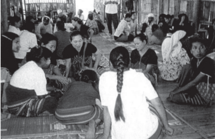
အုဖှင်ပိန်မုါတဖုတ်တိခိန်ရိုမဲဒီးမဲလါကဝီဟိန်ခိန်မုါနံနံ ၂၀၀၁ အိန်ယုဒီးတံကတံတံတံပိန်သကီး “ဟိန်ခိန်မဲလါခီဖျိနှဆာင်တံဘုတုအယိ”

အဝဲသုဒဲအတံပညိန်လါတံမလါကဝီဟိန်ခိန်မုါနံအံမုါဝဲဒဲသီးကဒုဖျါထိန်တံကဆဲဒီးရဲညဲကတံကု နှဆာင်ခိန်ယု ဒီးဒဲသီးမဲအိန်တံလီတပုလါလါကအိန်မုါဒီးအိန်မဲအိန်ဘုလိန်ဖိမဲဒီးနှဆာင်အဂီ နှင်လီ. လါတံကတံ တာင်ပိန်သကီးအပူနှင် တံဟဲဖျါထိန်တံသံကွါဒဲအမုါ- ဟိန်ခိန်လါပအိန်မုါလါအပူအံကဲဘျူးလါပဂီဒဲလဲင်, ဟိန်ခိန်ဒီးနှဆာင်တဖုန်ဘုတံမဲဟဲဒီးဂီအိဒဲလဲင်, ခီဖျိလါတံမဲဟဲဒီးဂီခိန်ယု နှဆာင်တဖုန်အယိမဲဘုဒဲတံဆါကတံဒဲလဲင်ဒီး ဒဲသီးပဟိန်ခိန်သုတဟဲဒီးဂီတဂုအဂီ ပကြါးမဲ